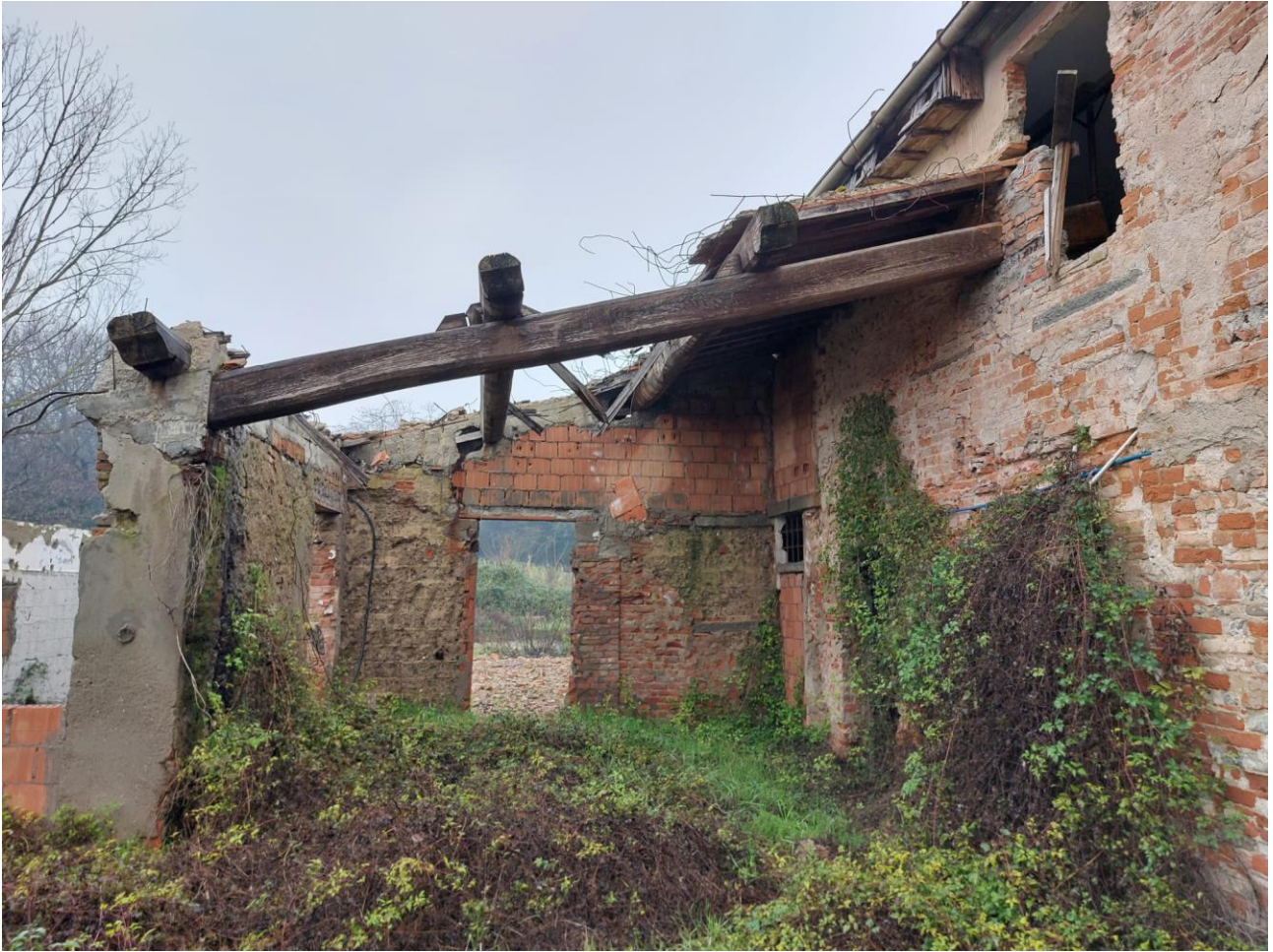
PORTICO ANTERIORE: NOTARE LA PARETE CON 3 DIVERSE TIPOLOGIE DI MURATURA