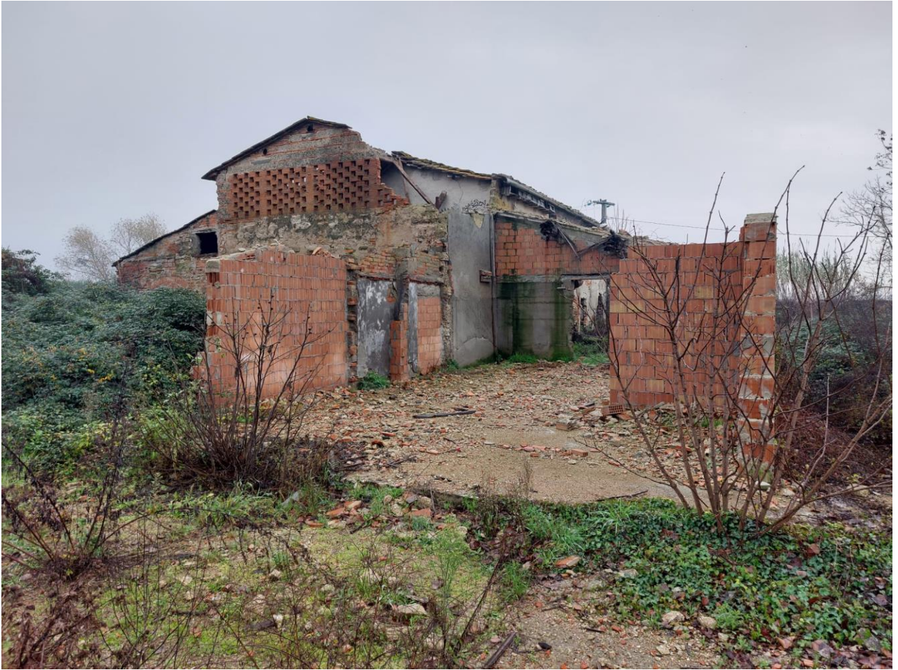
MANDOLATO PARZIALMENTE CROLLATO