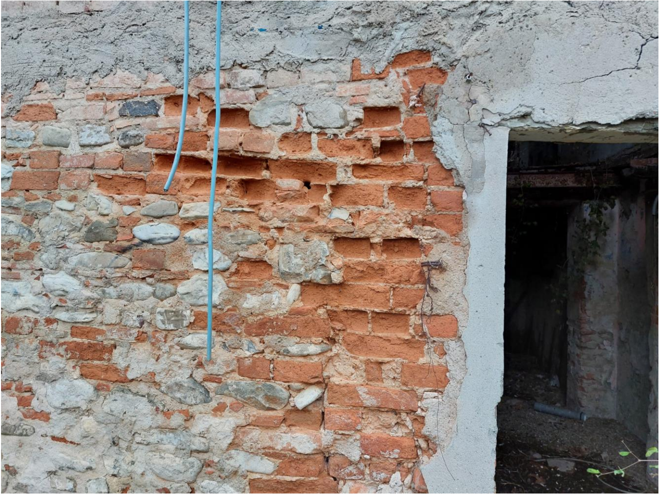
PARTICOLARE MURO ESISTENTE ORMAI PRIVO DI RESISTENZA STATICA