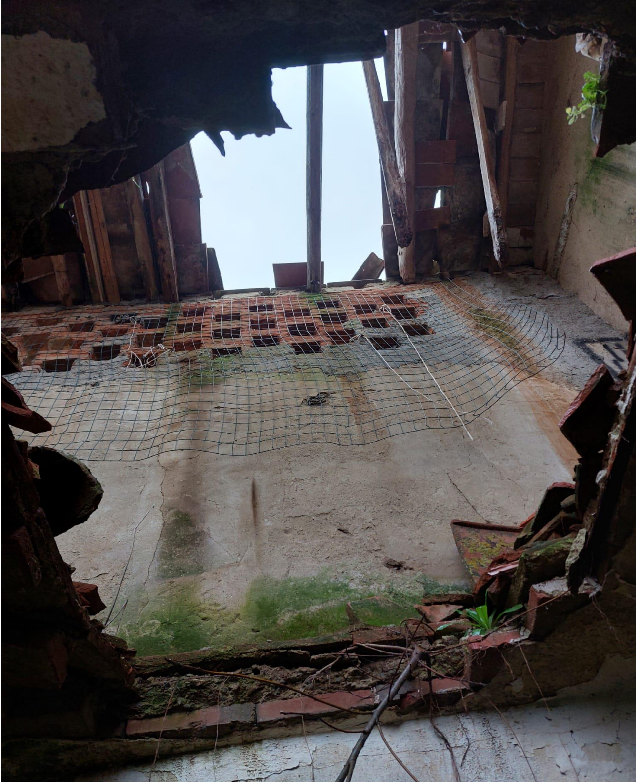
CROLLO COPERTURA E DEL SOTTOSTANTE SOLAIO