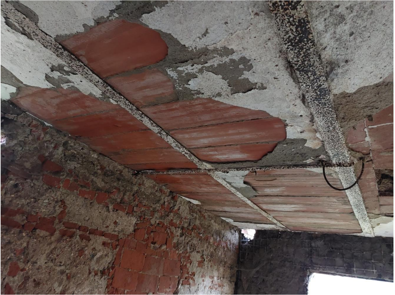
UNICHE PORZIONI SOLAIO NON CROLLATO (SOLAIO LONGARINE/TAVELLONI)