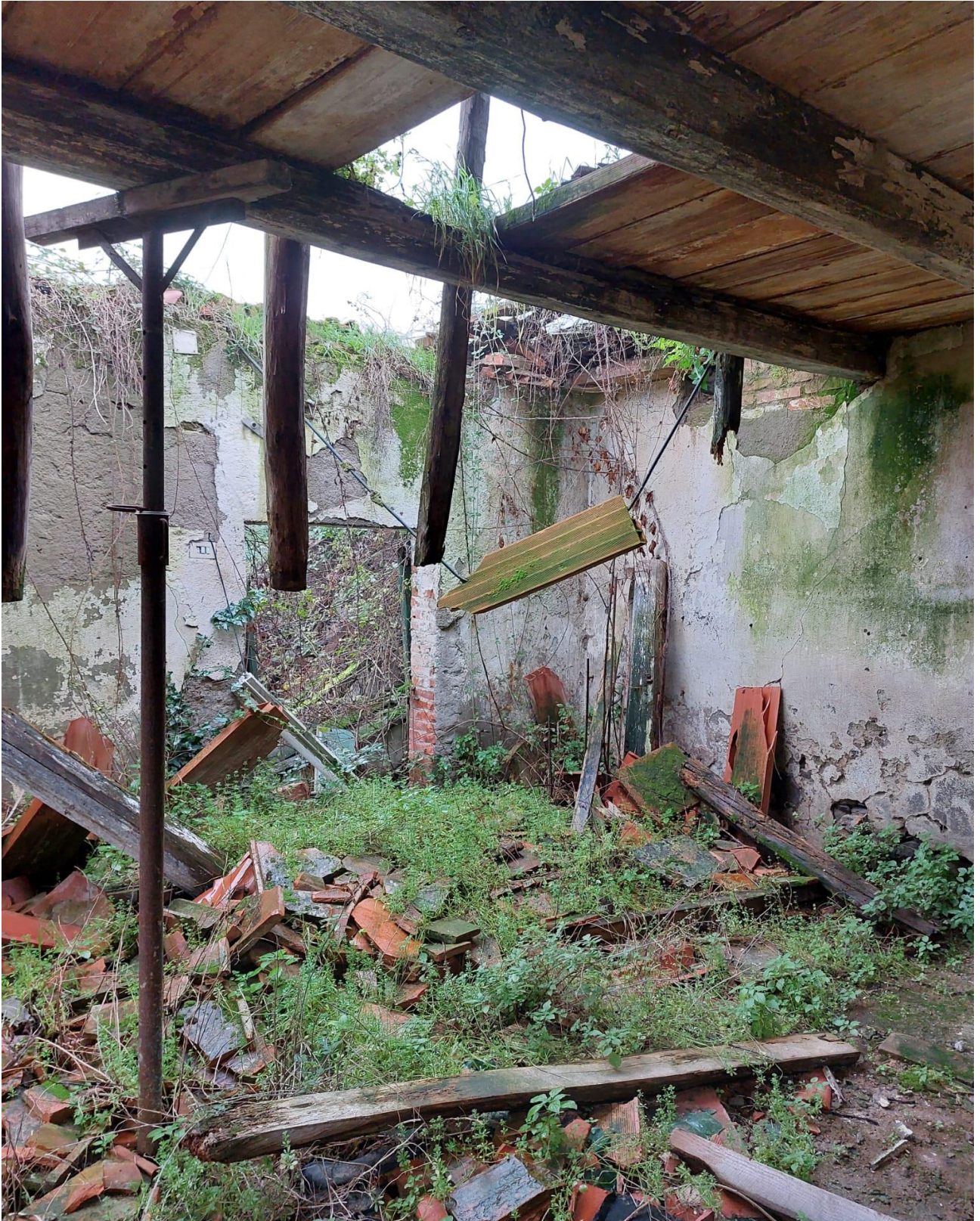
LOCALI PIANO TERRA CON COPERTURA TAVELLONI CROLLATA