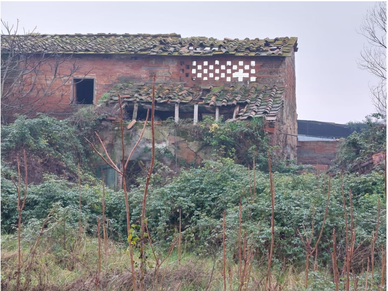
VISTA DA NORD: TETTO E MURO SUD CROLLATI E TETTO LOCALI PT CROLLATO