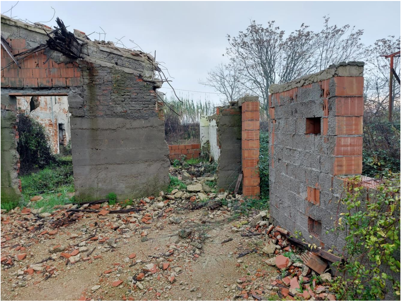
ULTERIORI PARTI CROLLATE