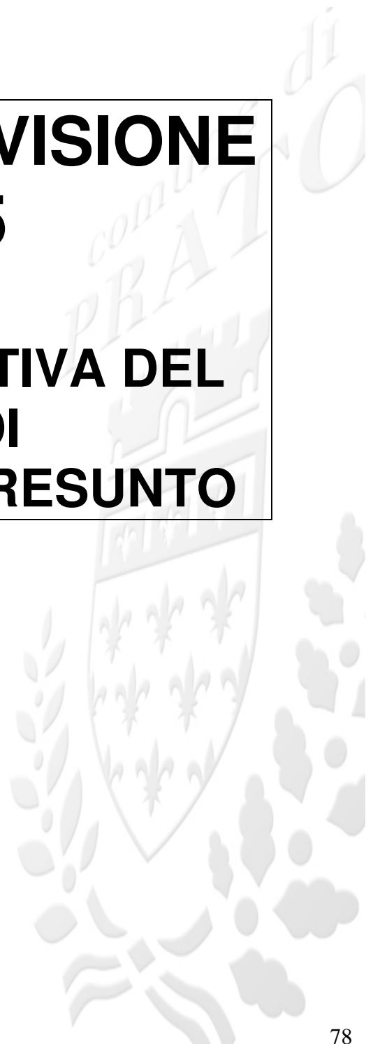
TABELLA DIMOSTRATIVA DEL RISULTATO DI AMMINISTRAZIONE PRESUNTO