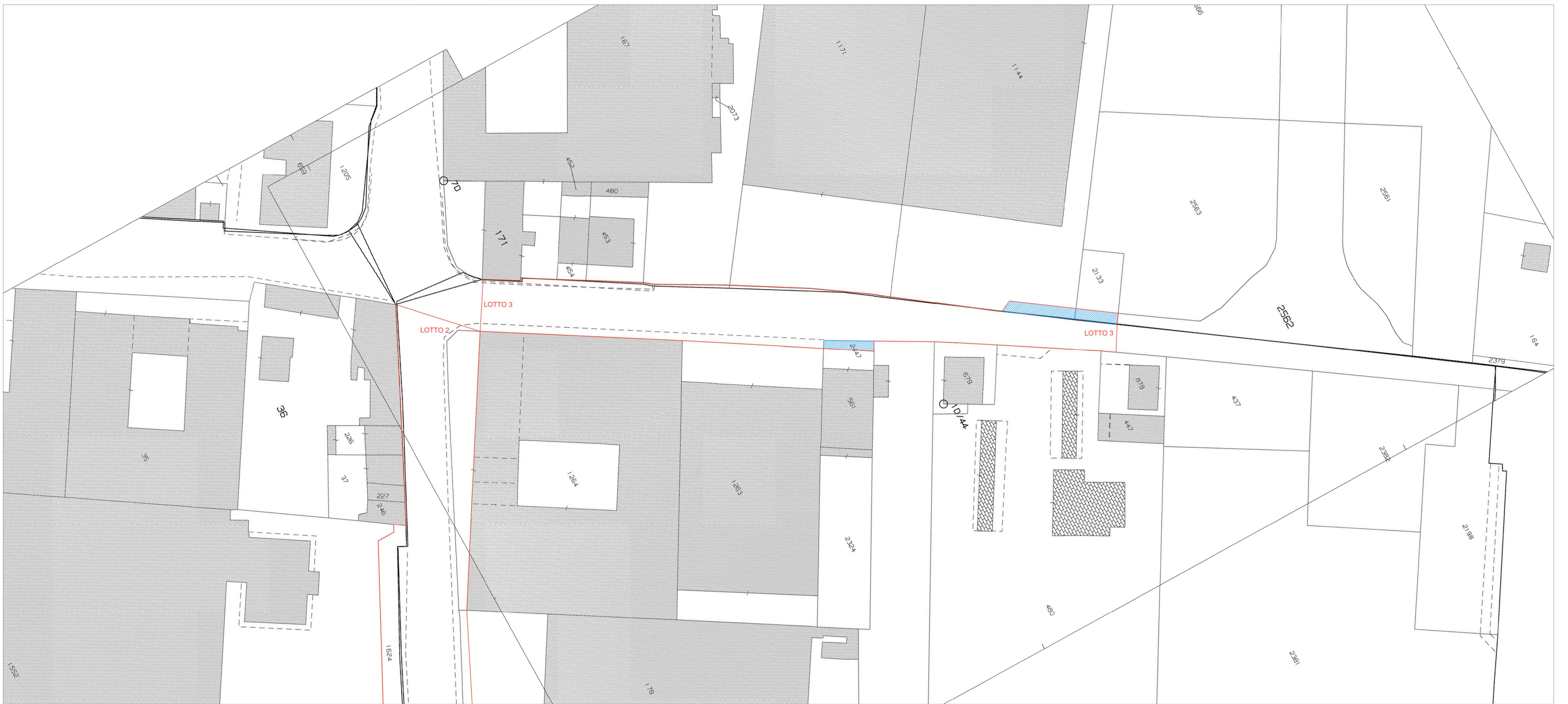
Sovrapposizione perimetro del progetto su quadro di unione aggiornato TRONCO E scala 1:500