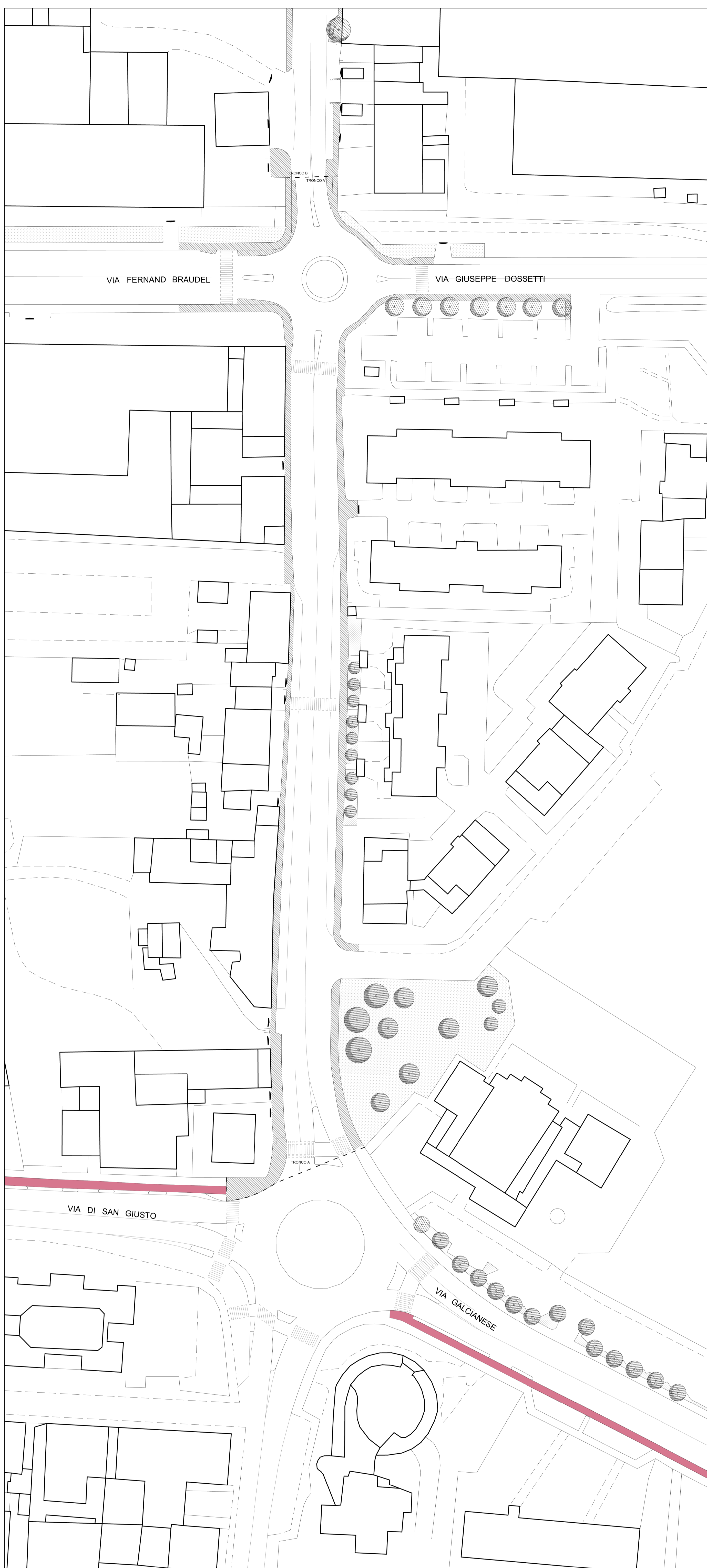
STATO DI FATTO, TRONCO A, scala 1:500