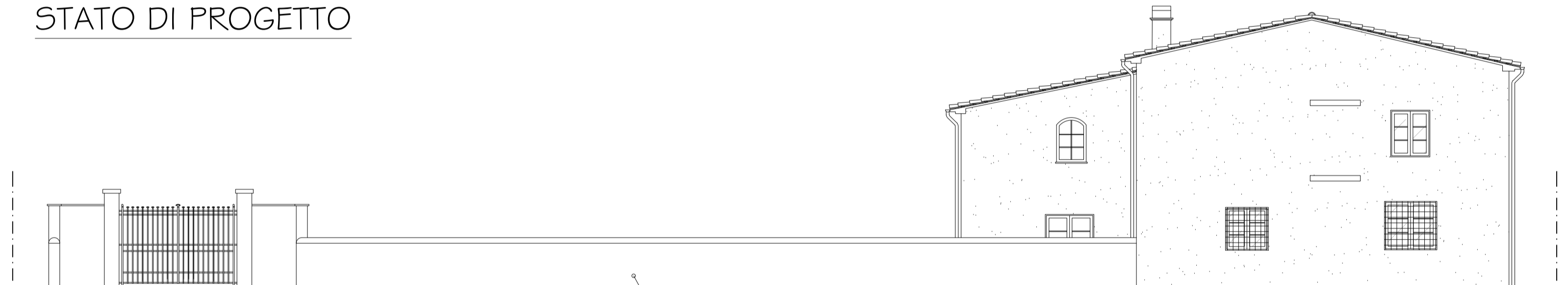
Prospetto Lato Via Magenta scala 1:100