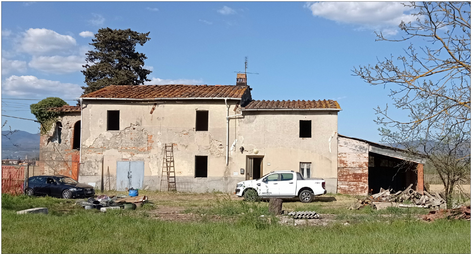
Foto stato attuale