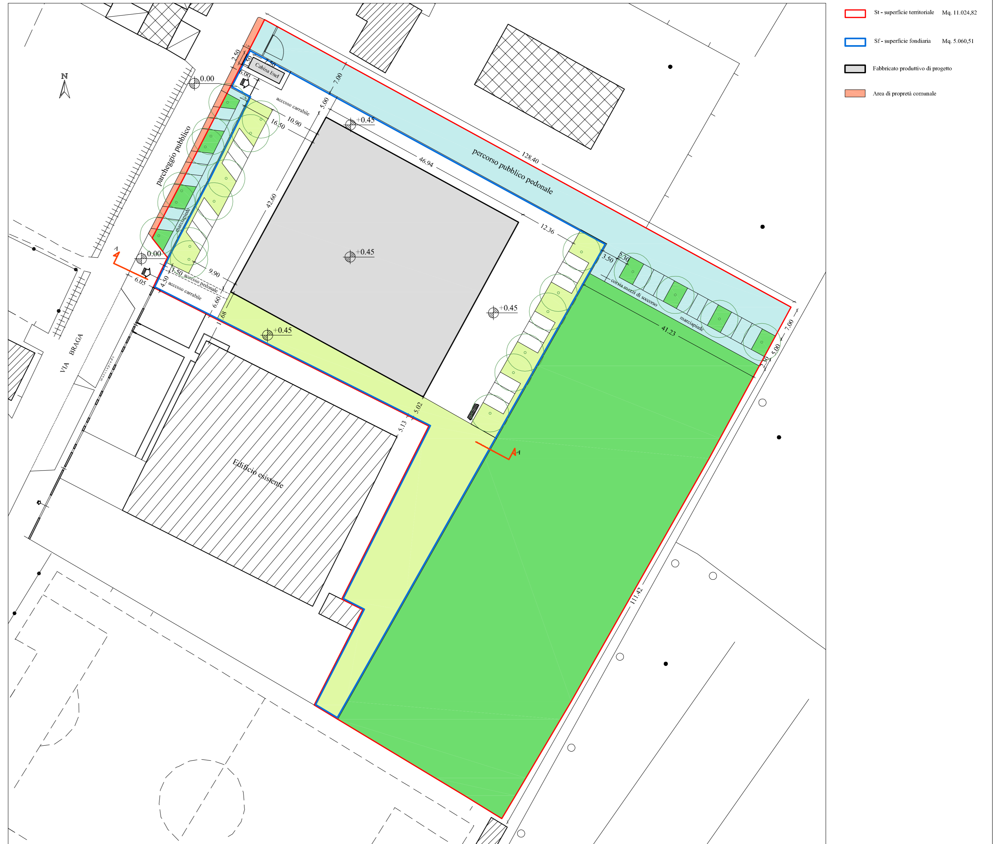
PLANIMETRIA GENERALE - Scala 1:500

Planimetria generale - Sezione territoriale