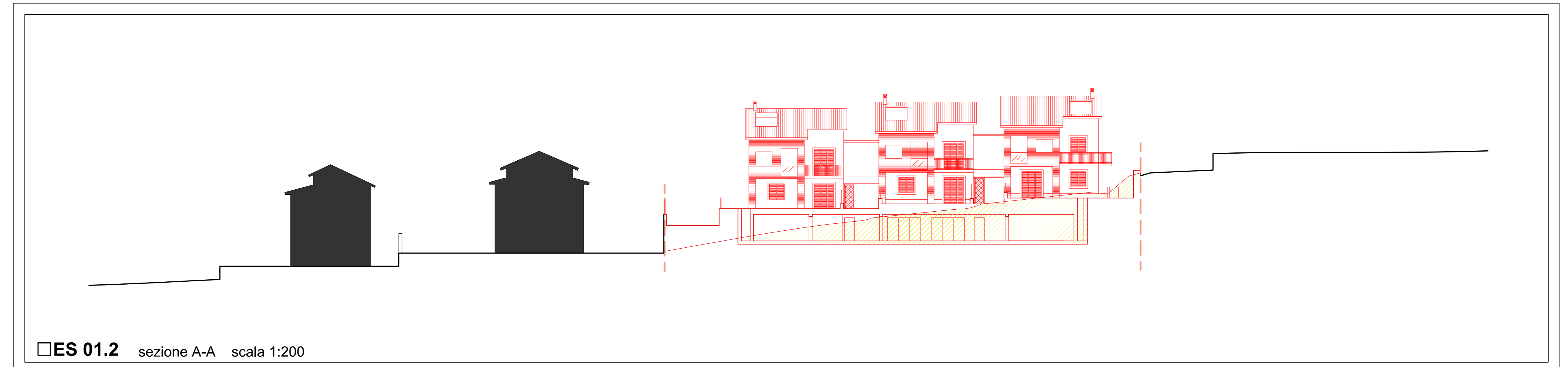
ES 01.2 sezione A-A scala 1:200