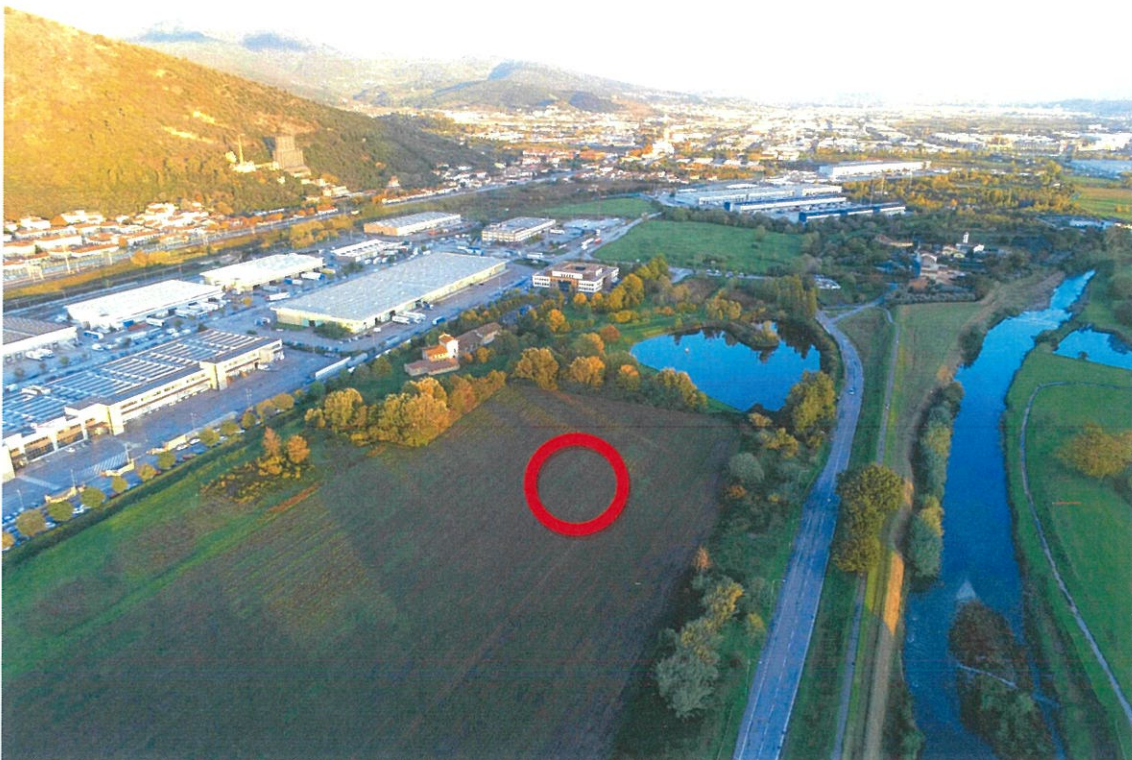
VISTA DA DRONE DA PRATO VERSO GONFIENTI.