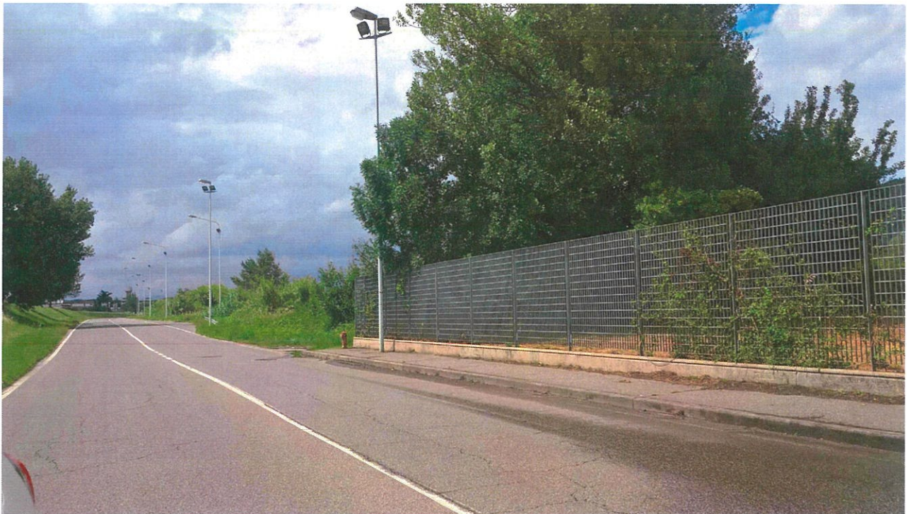
VISTA DA VIA A. DE' GASPERI VERSO PRATO A DX DOPO LA RECINZIONE L'AREA D'INTERVENTO.