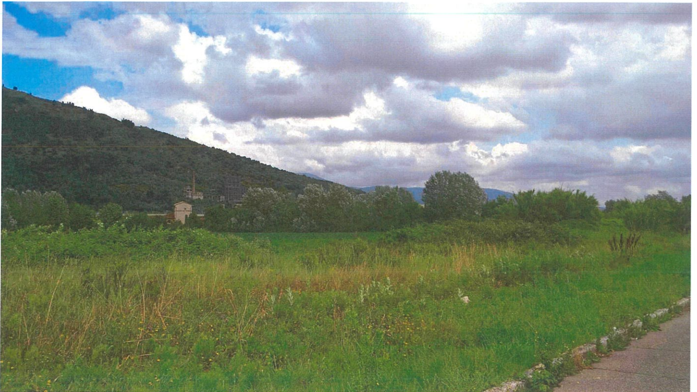
VISTA DELL'AREA D'INTERVENTO DA VIA VIA A. DE'GASPERI.