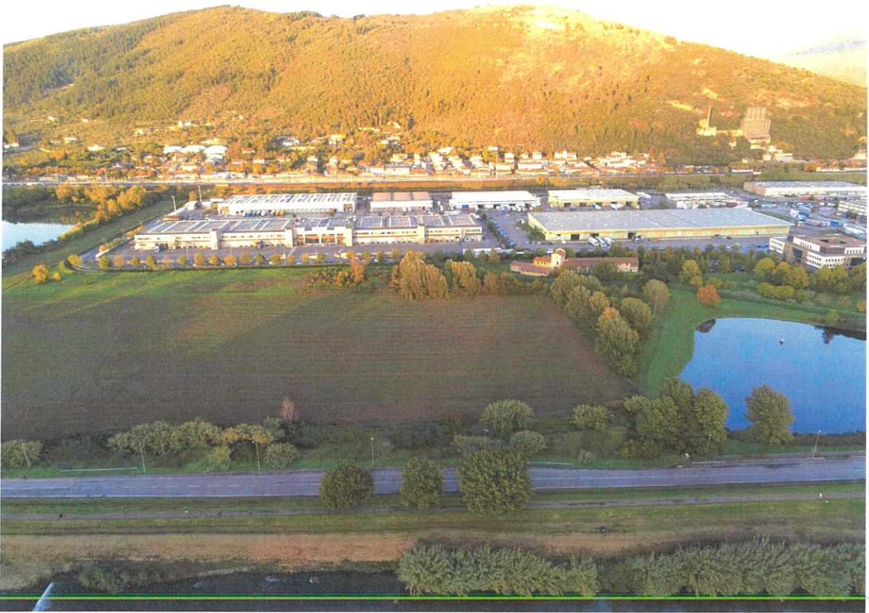
VISTA DA DRONE VERSO IL FRONTE DELL'AREA D'INTERVENTO.