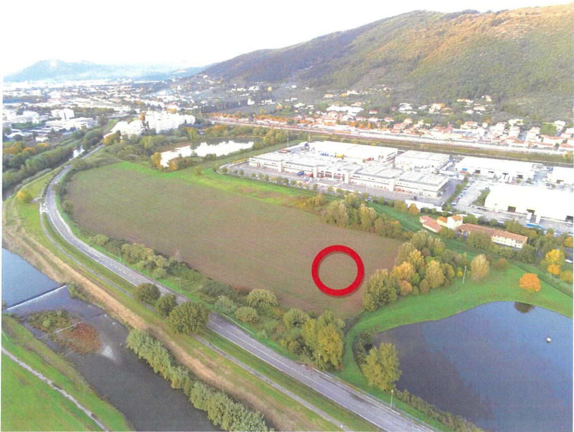
VISTA DA DRONE DA GONFIENTI VERSO PRATO.