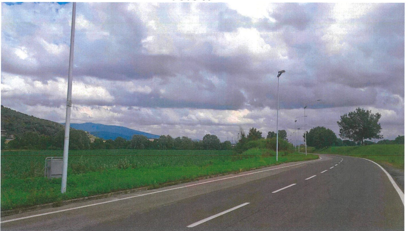
VISTA DA VIA A. DE'GASPERI VERSO GONFIENTI O A SX L'AREA D'INTERVENTO.