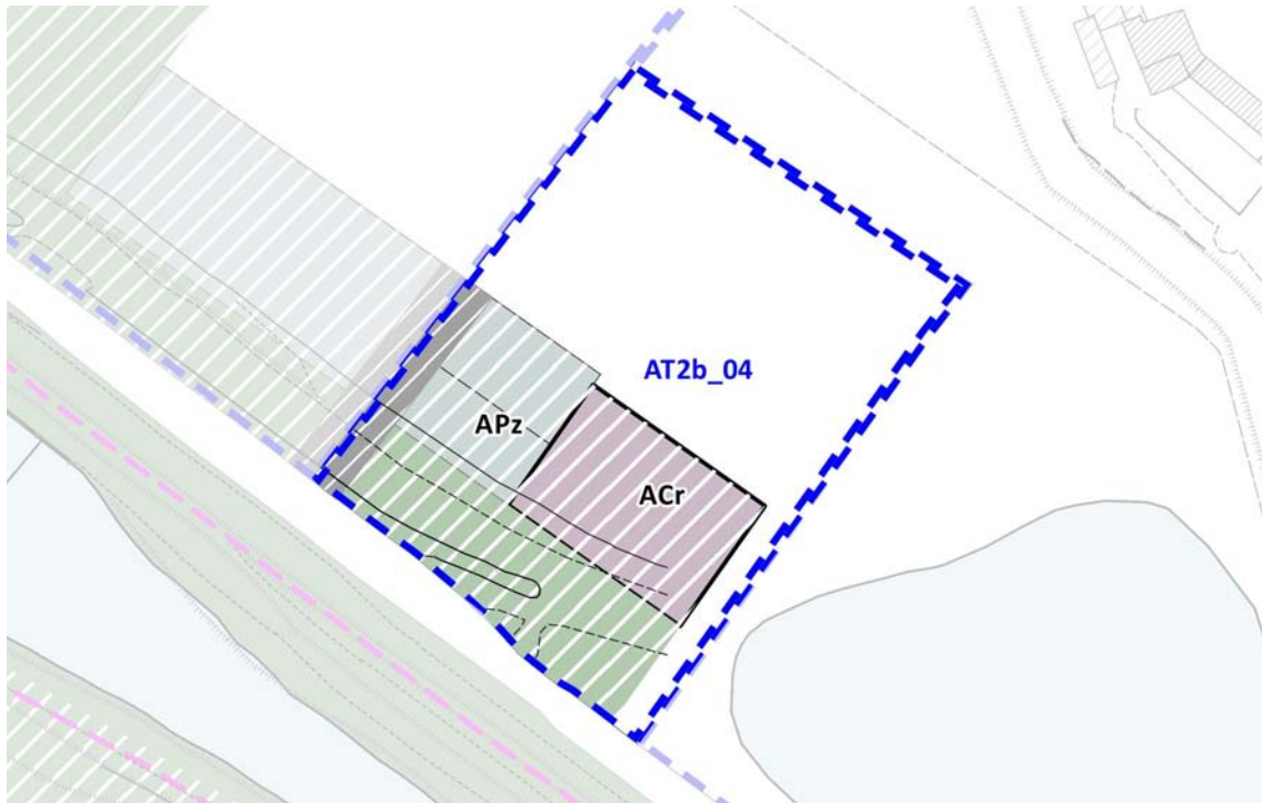
ESTRATTO DISCIPLINA DEI SUOLI E DEGLI INSEDIAMENTI