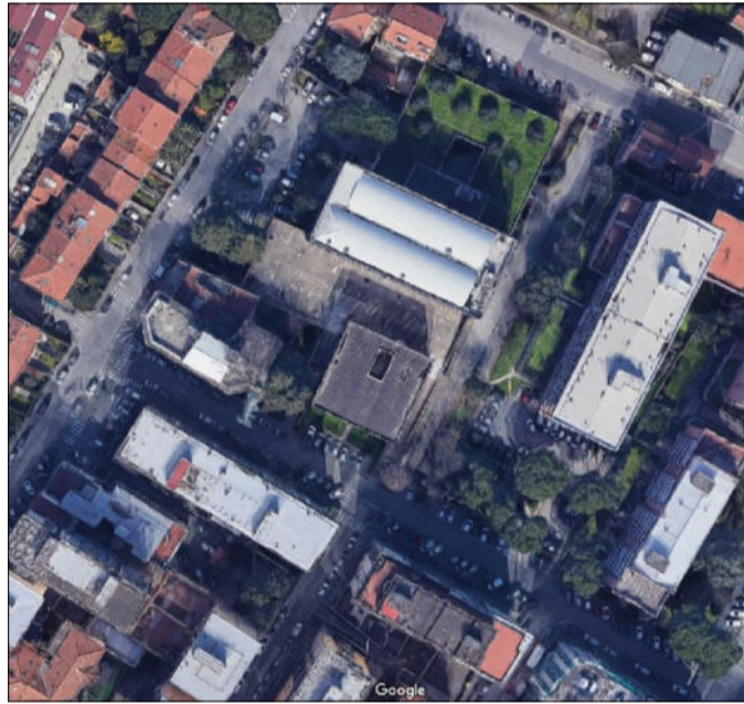
Tavola: 01 Scala: 1:2000, 200 Spazio riservato agli uffici:

Progettista Arch. Antonio Silvestri - Comune di Prato