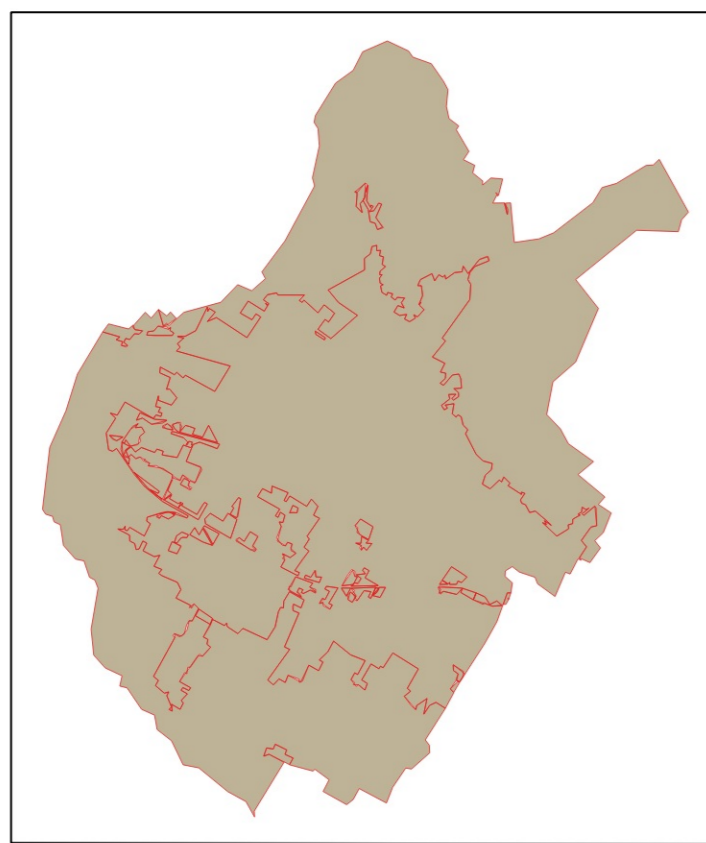
TAVOLA UNICA SCALA 1:15000