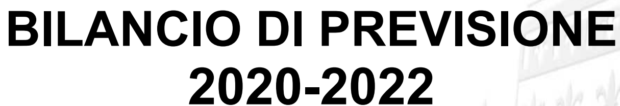
TABELLA DIMOSTRATIVA DEL RISULTATO DI AMMINISTRAZIONE PRESUNTO