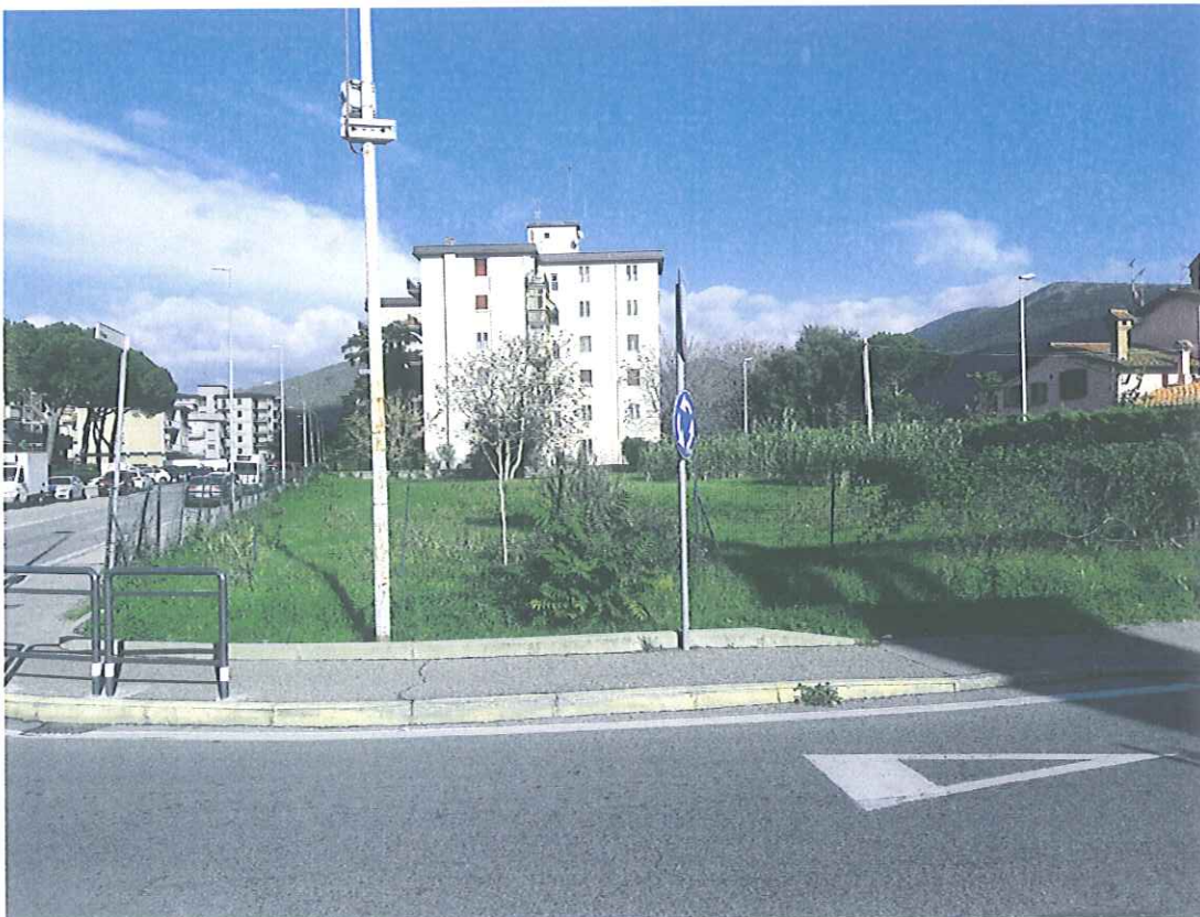
AREA DESTINATA ALLA REALIZZAZIONE DEL PARCHEGGIO IN VIA TIRSO