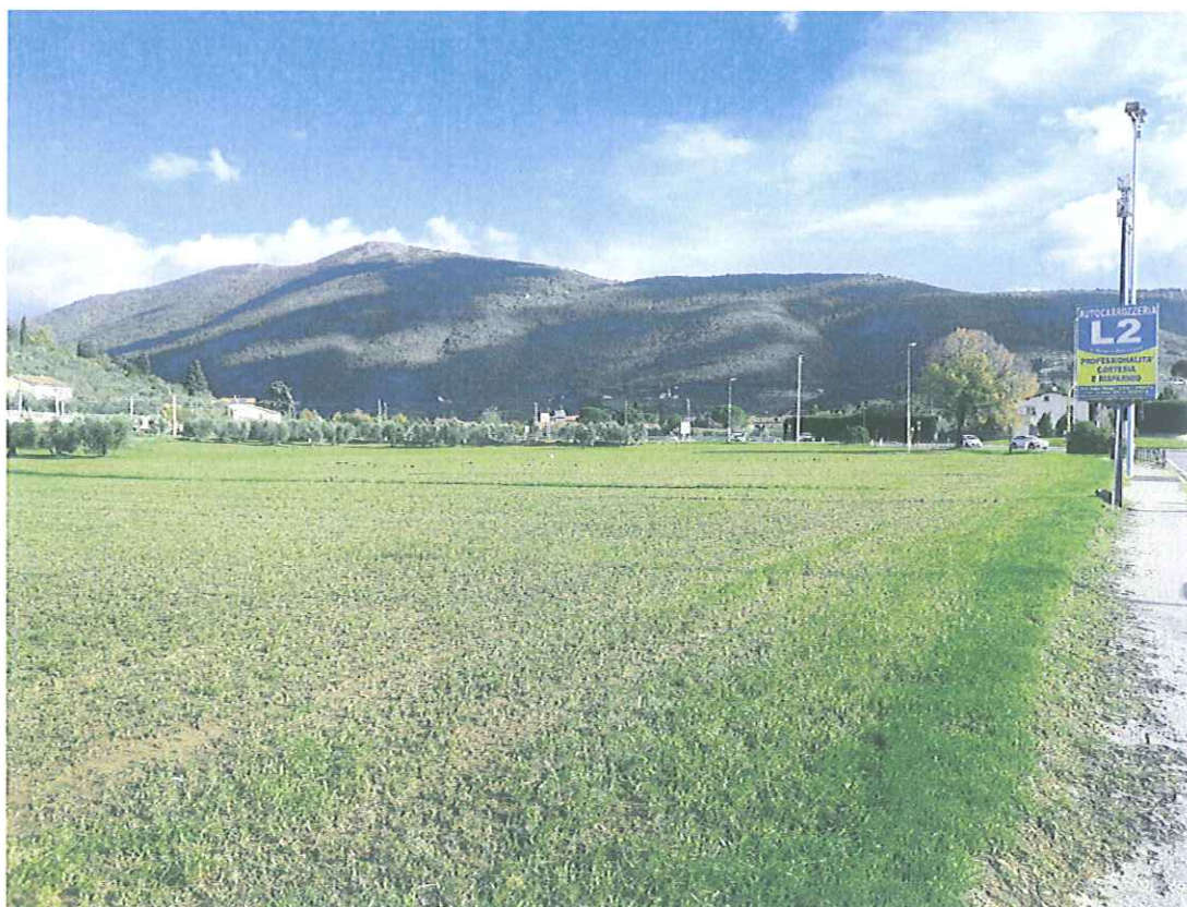
AREA IN FREGIO A VIA DI CANTAGALLO DESTINATO ALLA PARZIALE CESSIONE COME RICHIESTO DA V/PEC DEL 07.11.2017