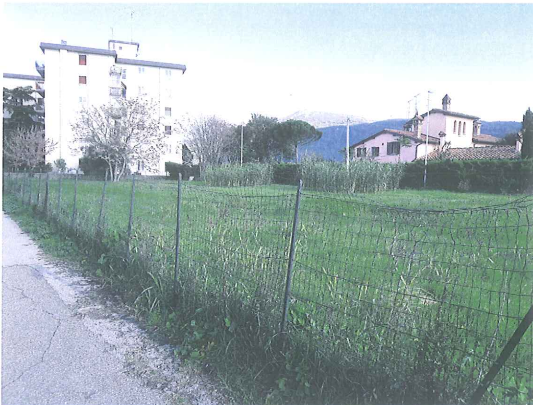
AREA DESTINATA ALLA REALIZZAZIONE DEL PARCHEGGIO IN VIA TIRSO