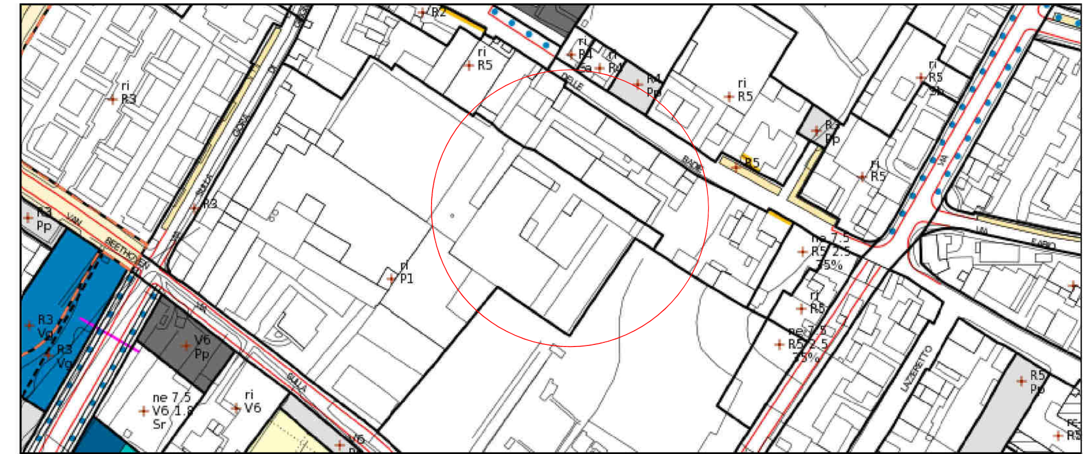
Usi del suolo e modalità di intervento