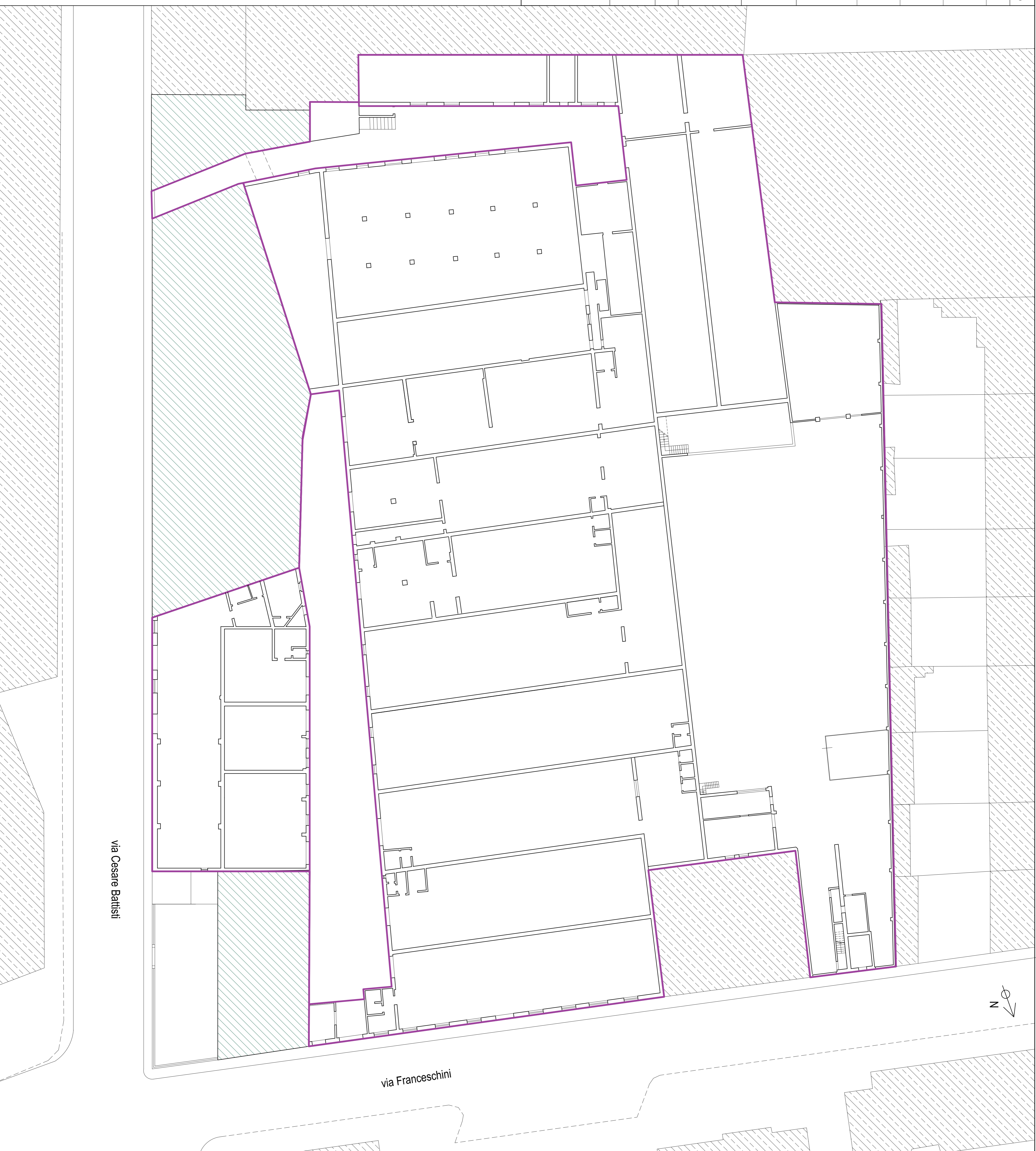
Piante piani superiori - scala 1:1000