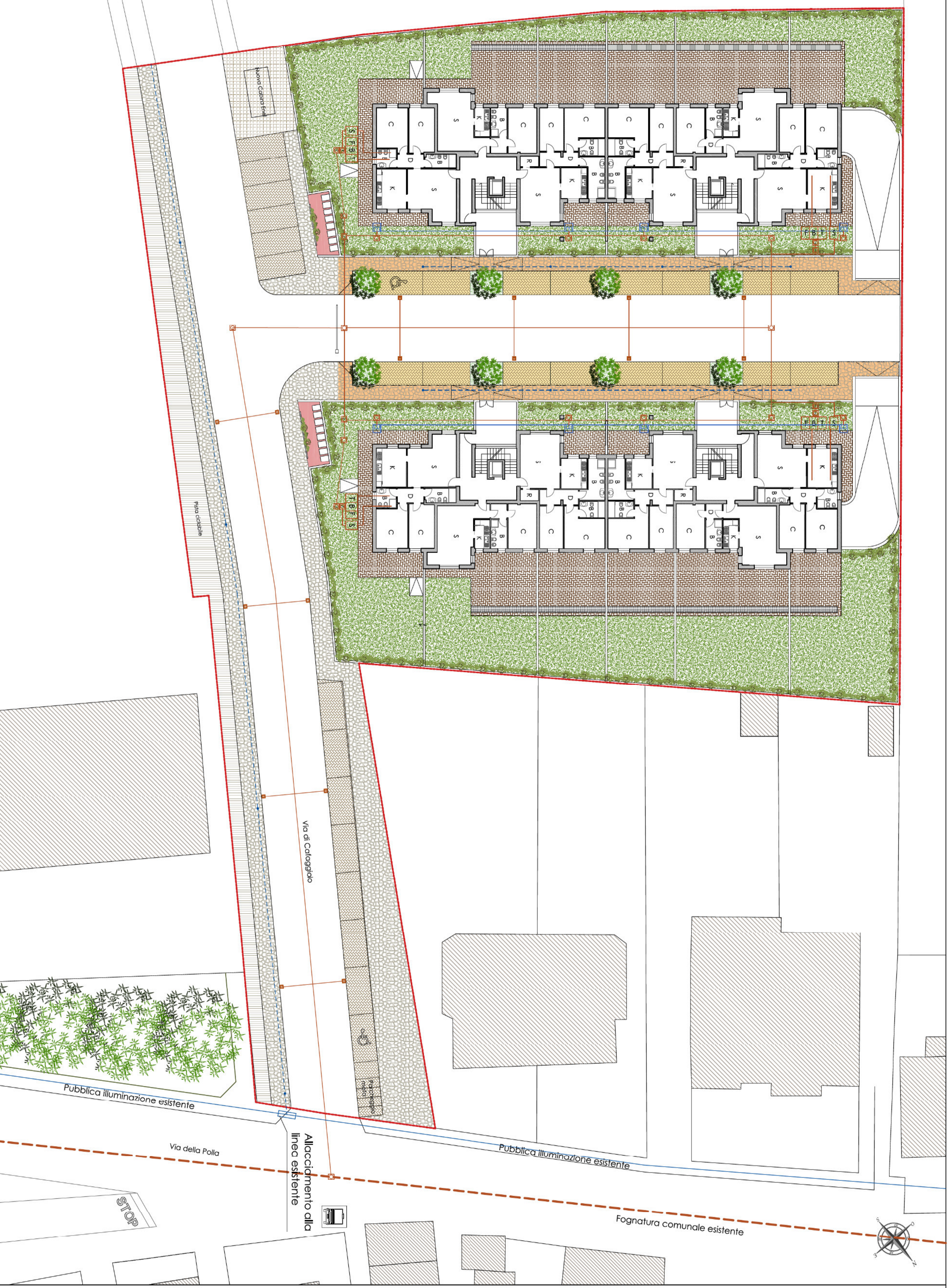
Sovrapposto RU con stato di progetto Scala 1:1000