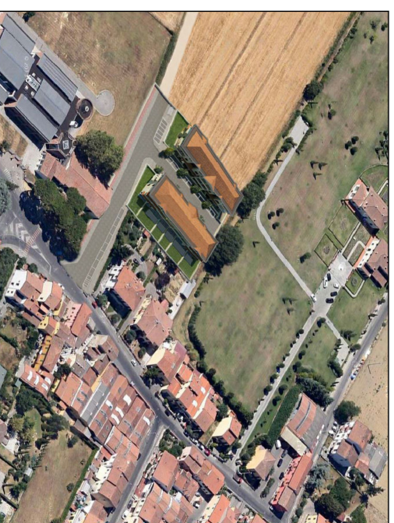
Vista dall'alto 1