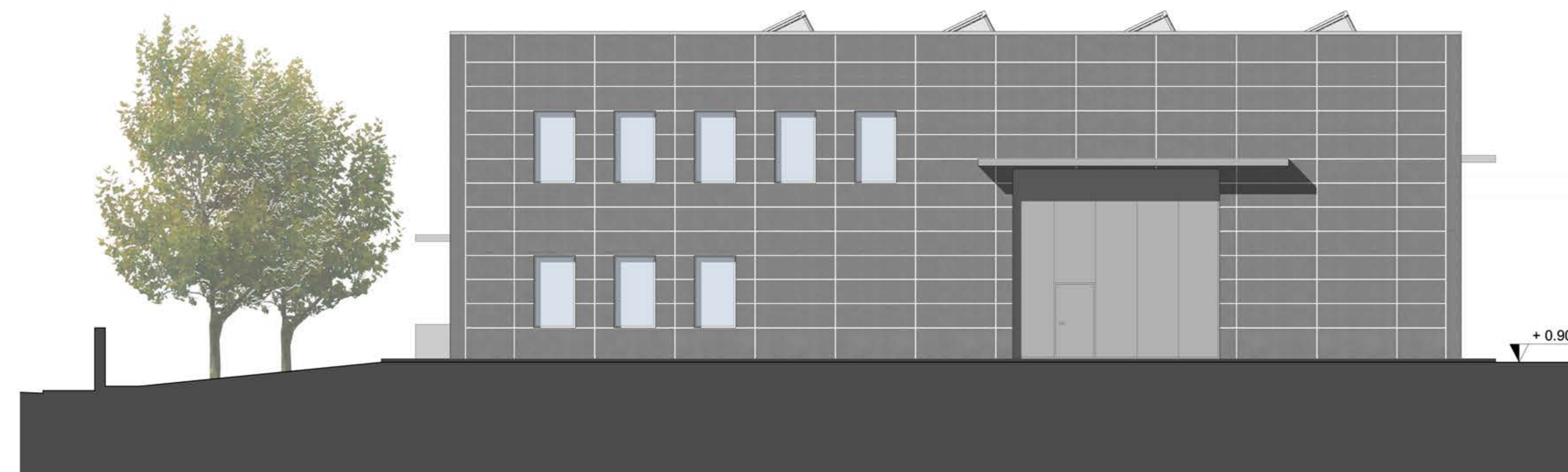
PROSPETTO SUD-EST SCALA 1/100