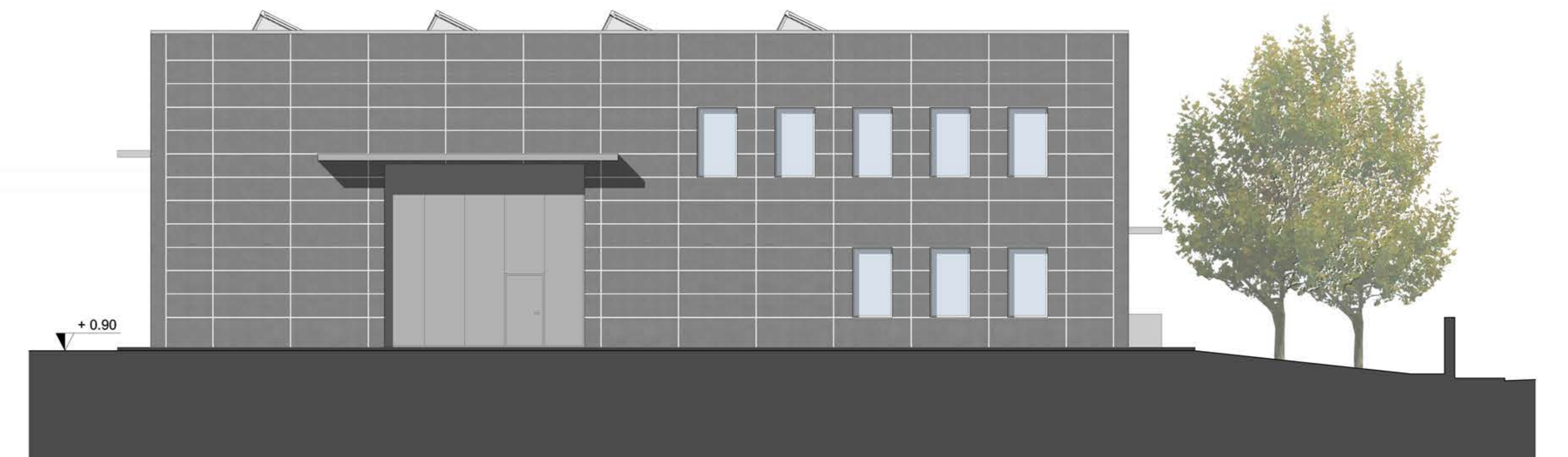
PROSPETTO NORD-OVEST SCALA 1/100