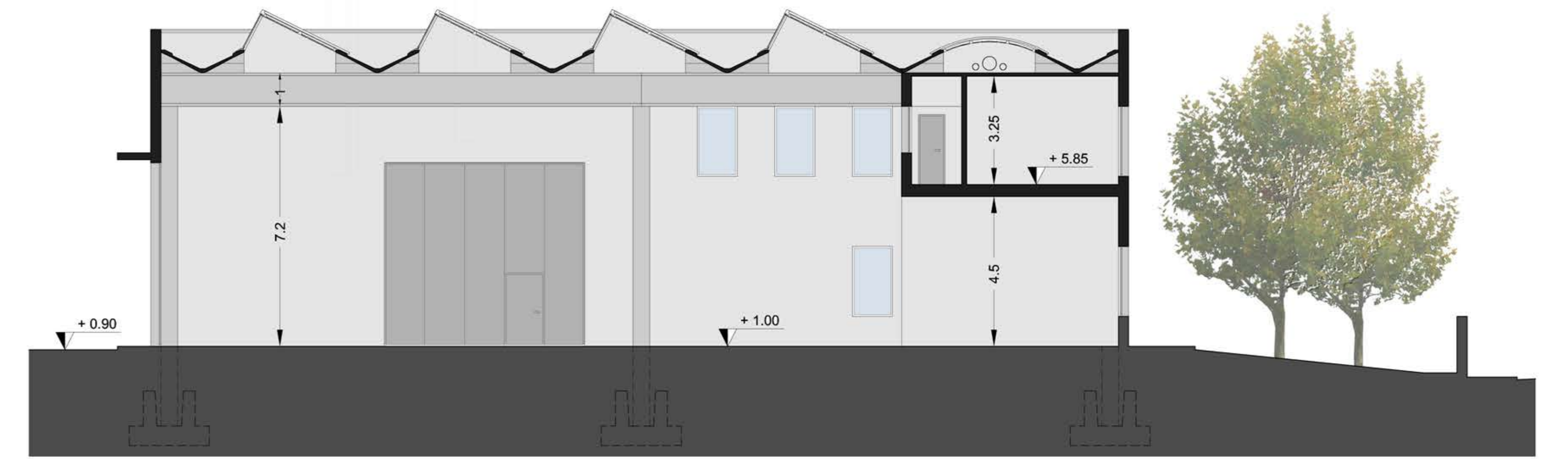
SEZIONE CC' SCALA 1/100