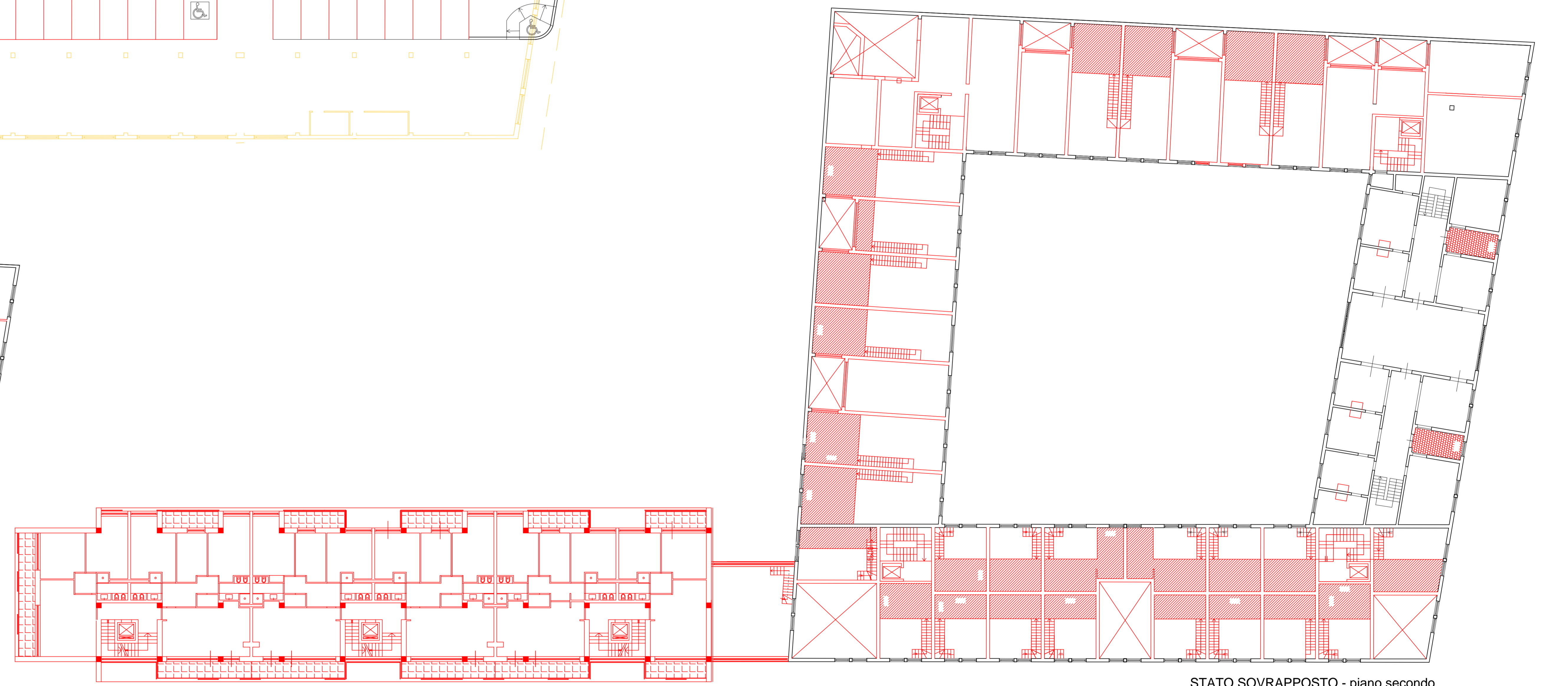
STATO SOVRAPPOSTO - piano secondo