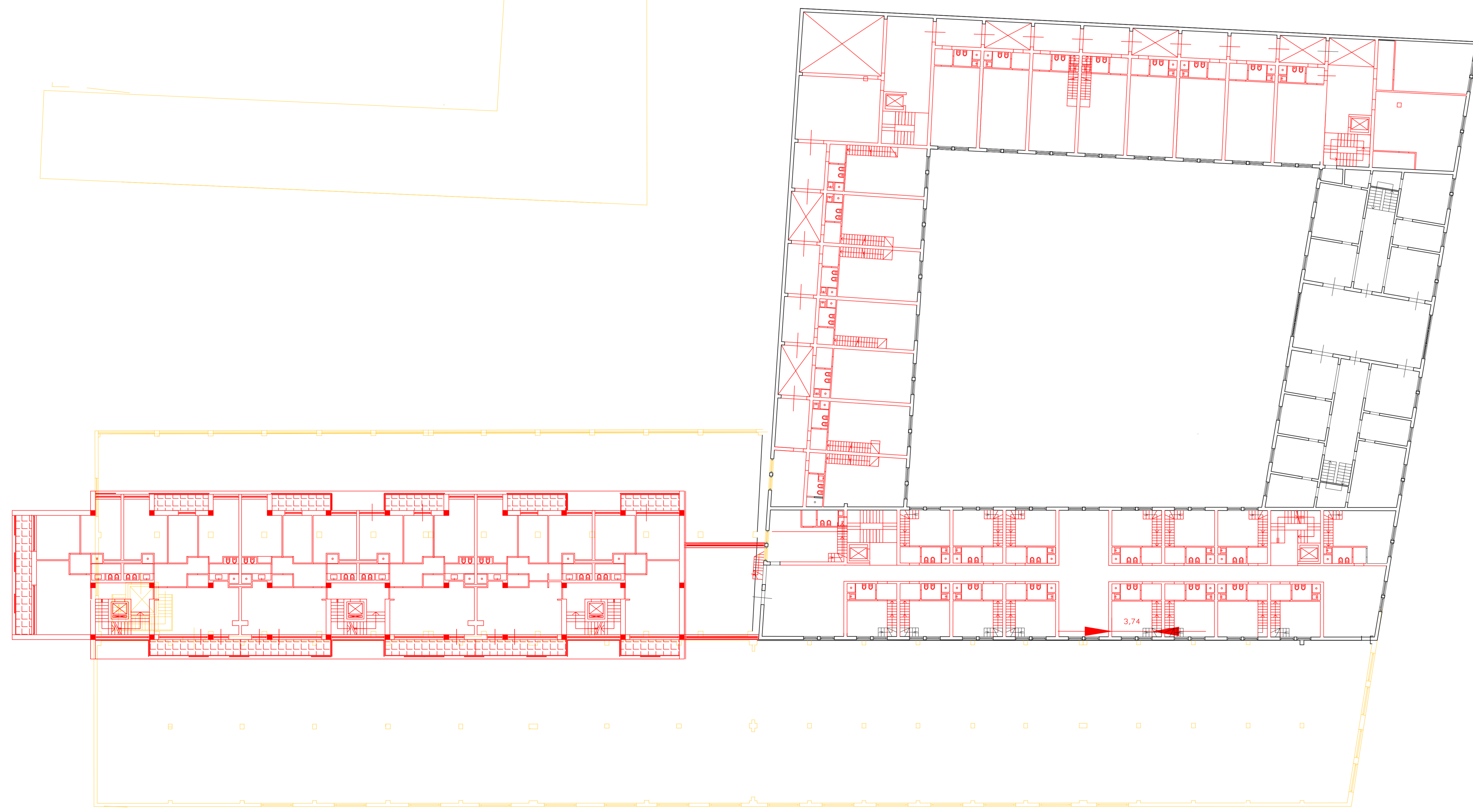
STATO SOVRAPPOSTO - piano primo