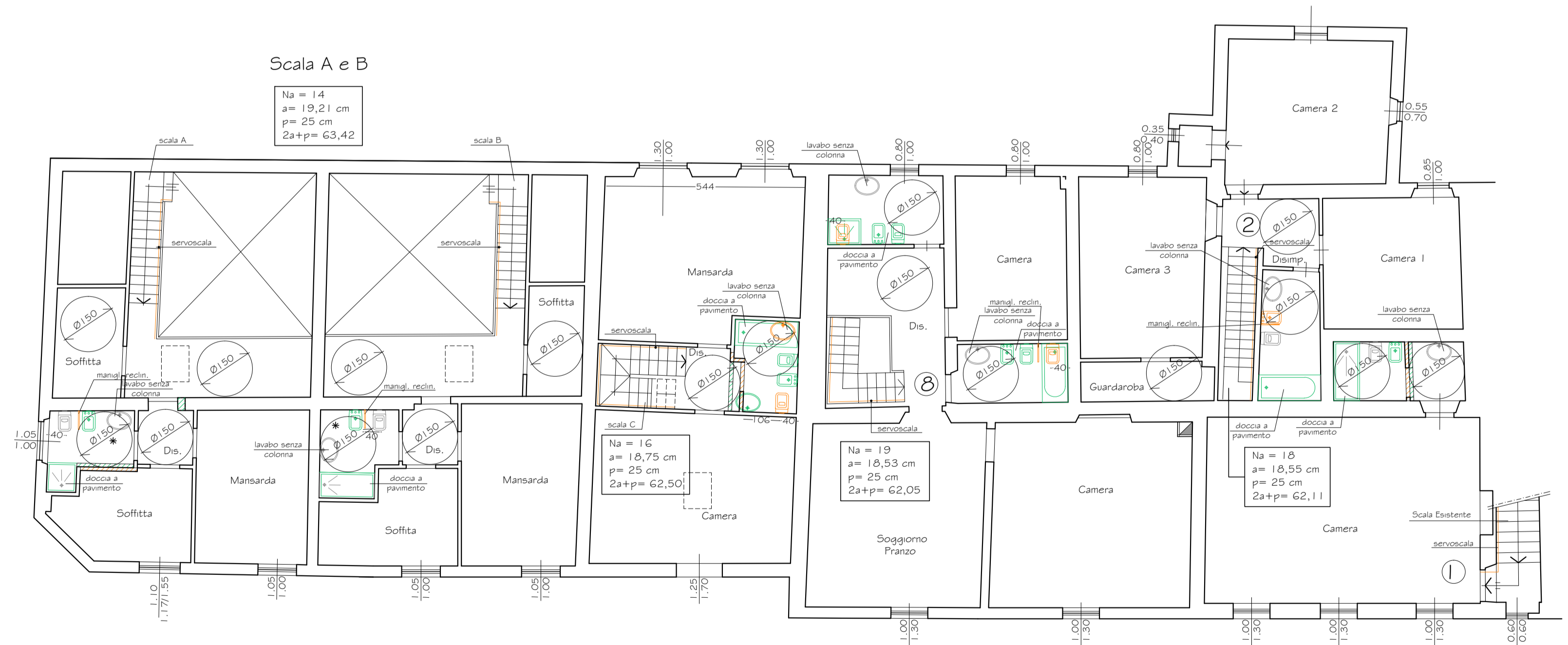
Pianta Piano Primo