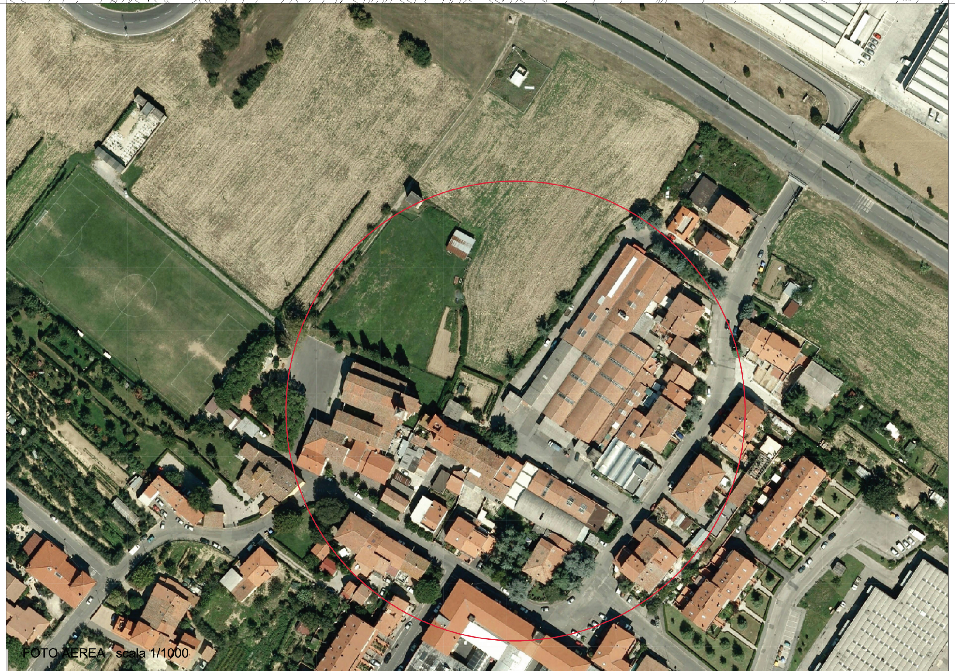
FOTO AEREA scala 1/1000