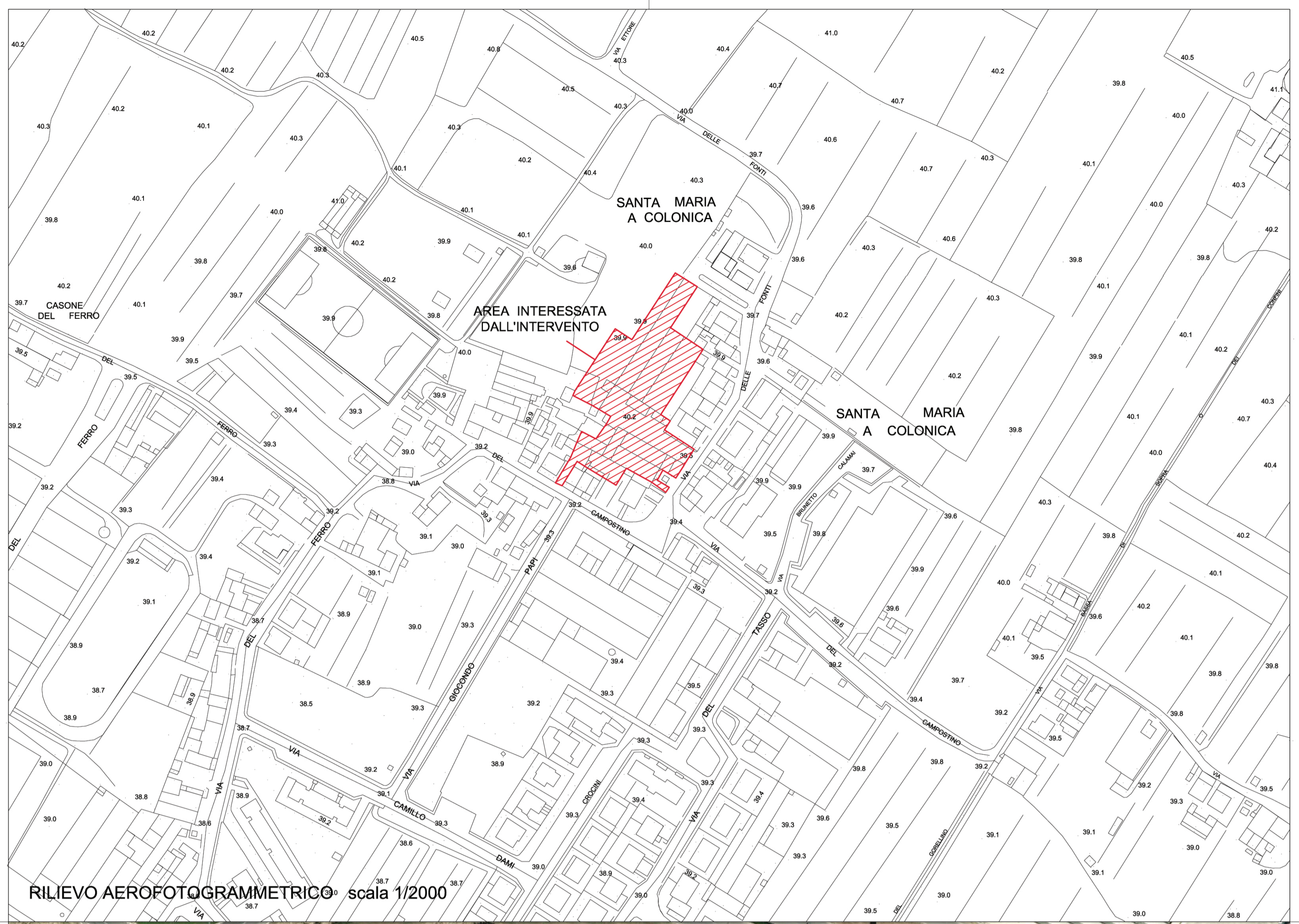
RILIEVO AEROFOTOGRAMMETRICO scala 1/2000