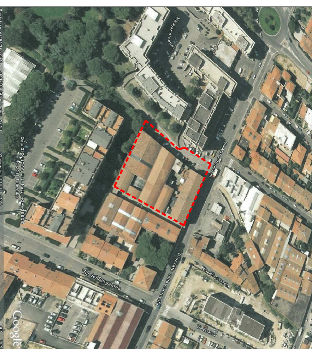
FOTO AEREA - STATO ATTUALE