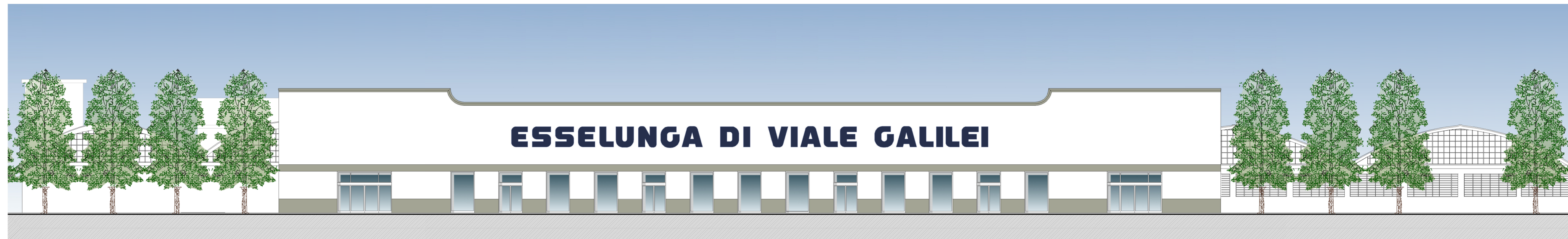
PROSPETTO LATO VIALE G. GALILEI