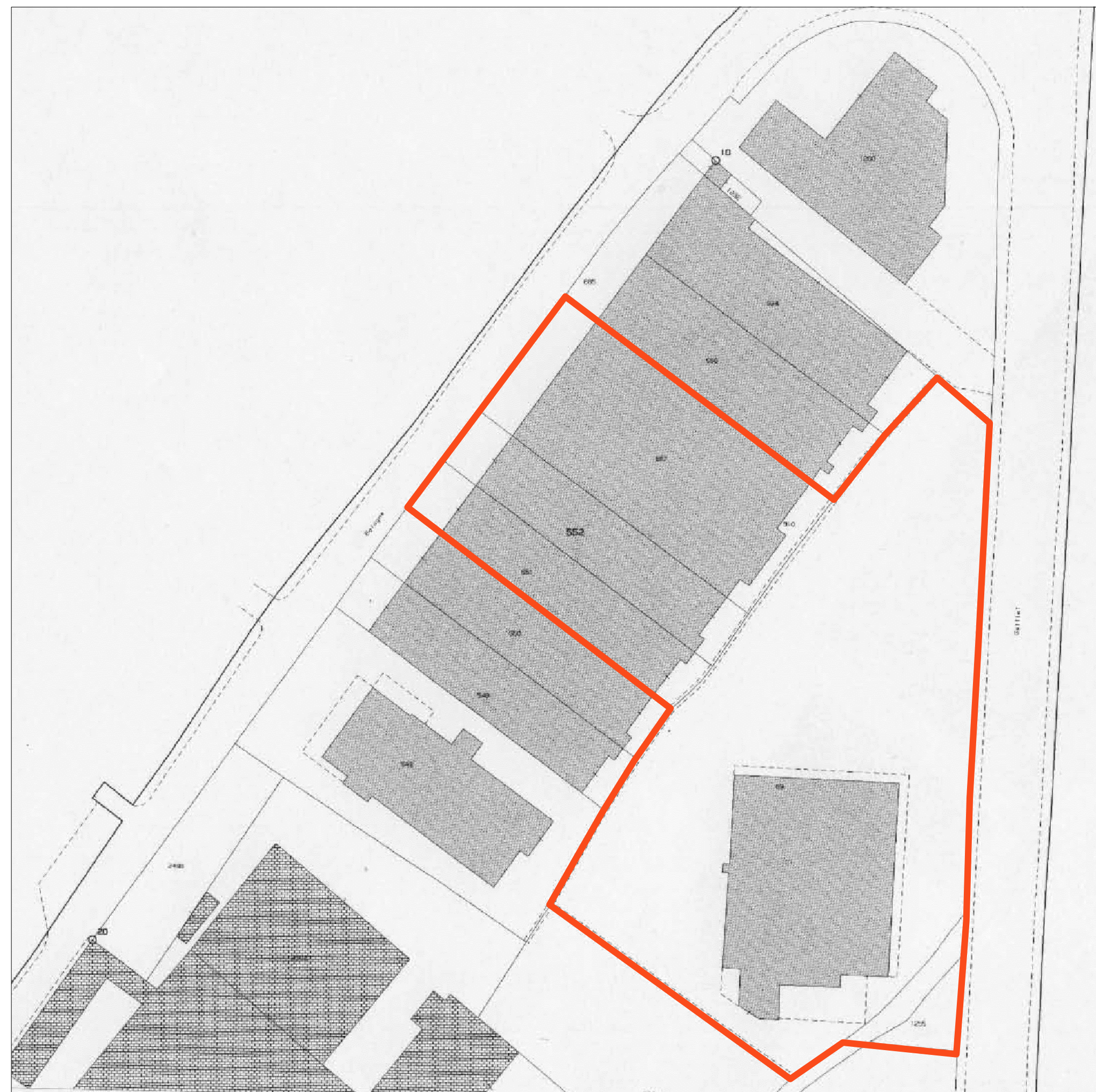
ESTRATTO CATASTALE. SCALA 1:1.000