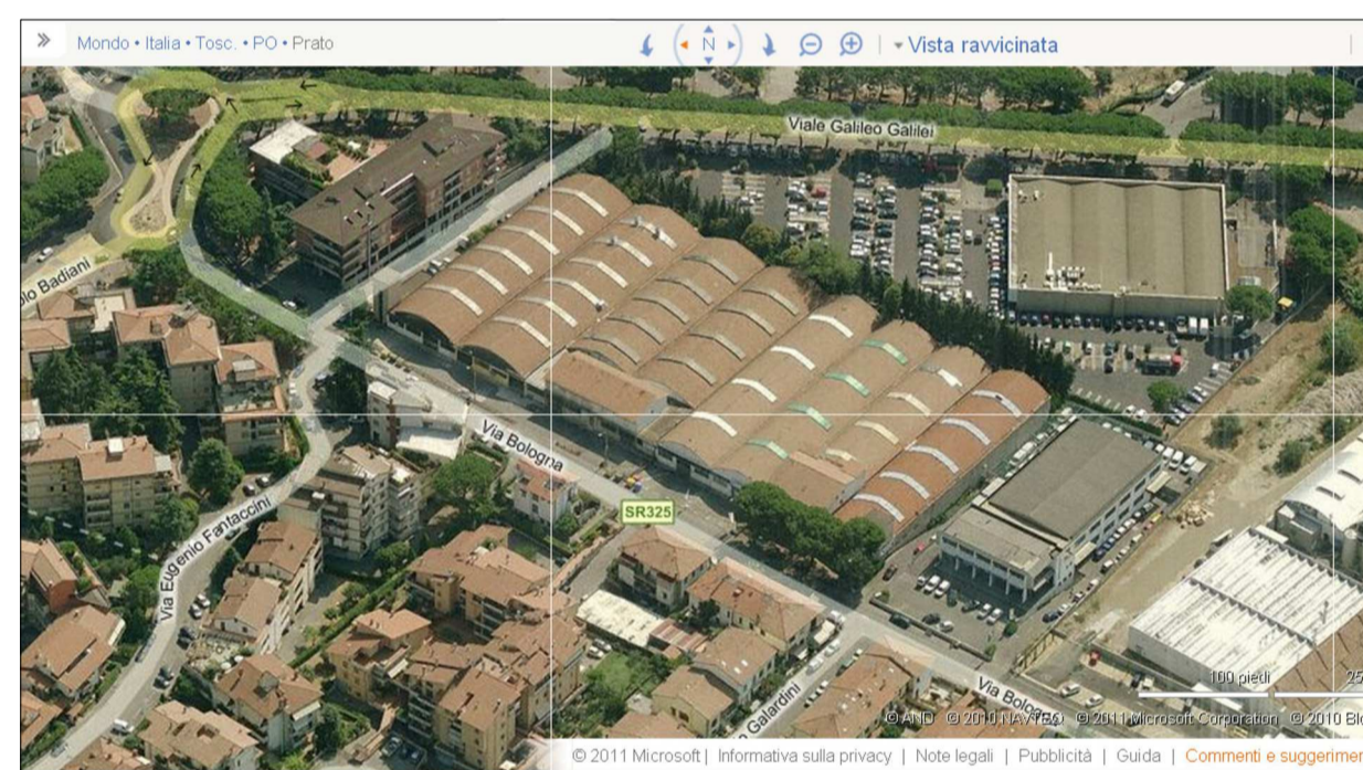
Vista da sud-ovest