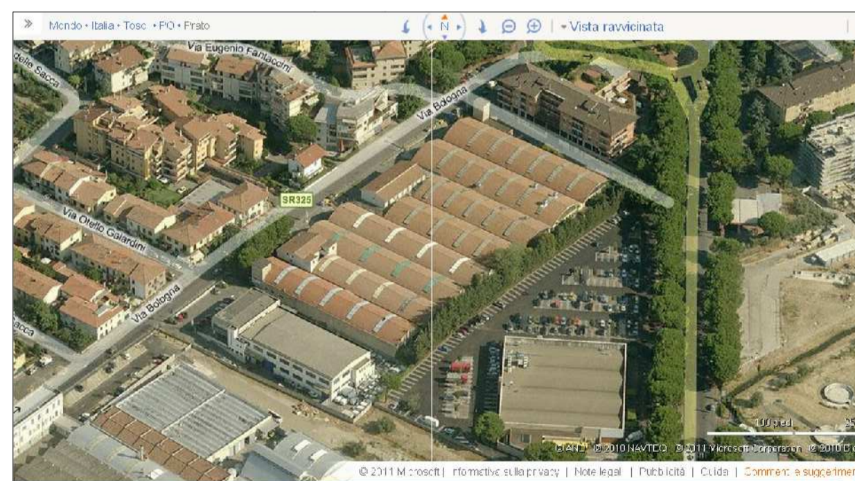
Vista da sud-est