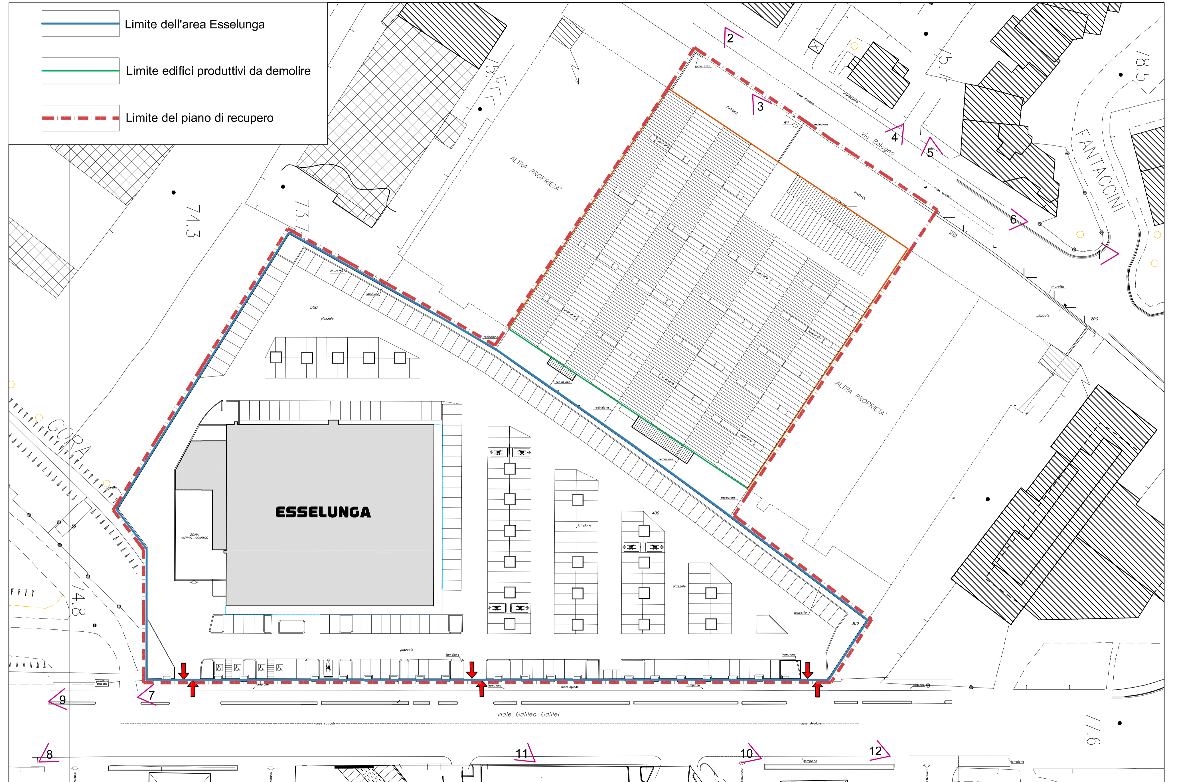
RILIEVO DELL'AREA SCALA 1:500