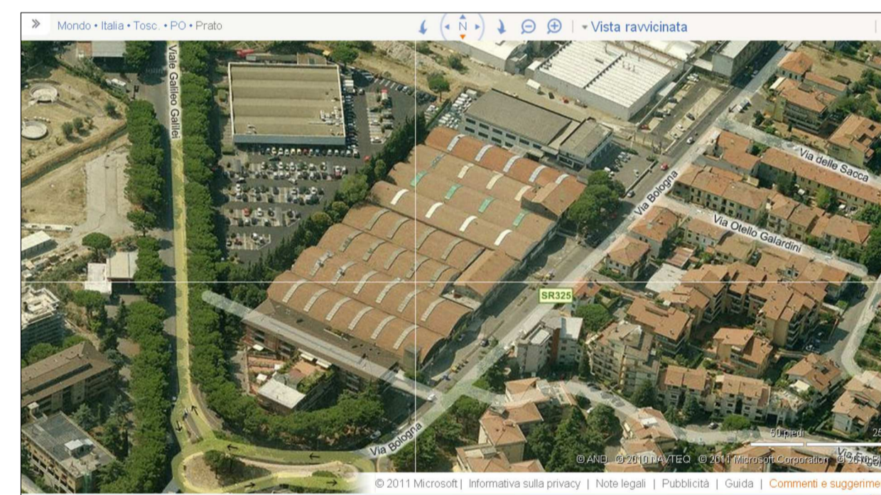
Vista da nord-ovest