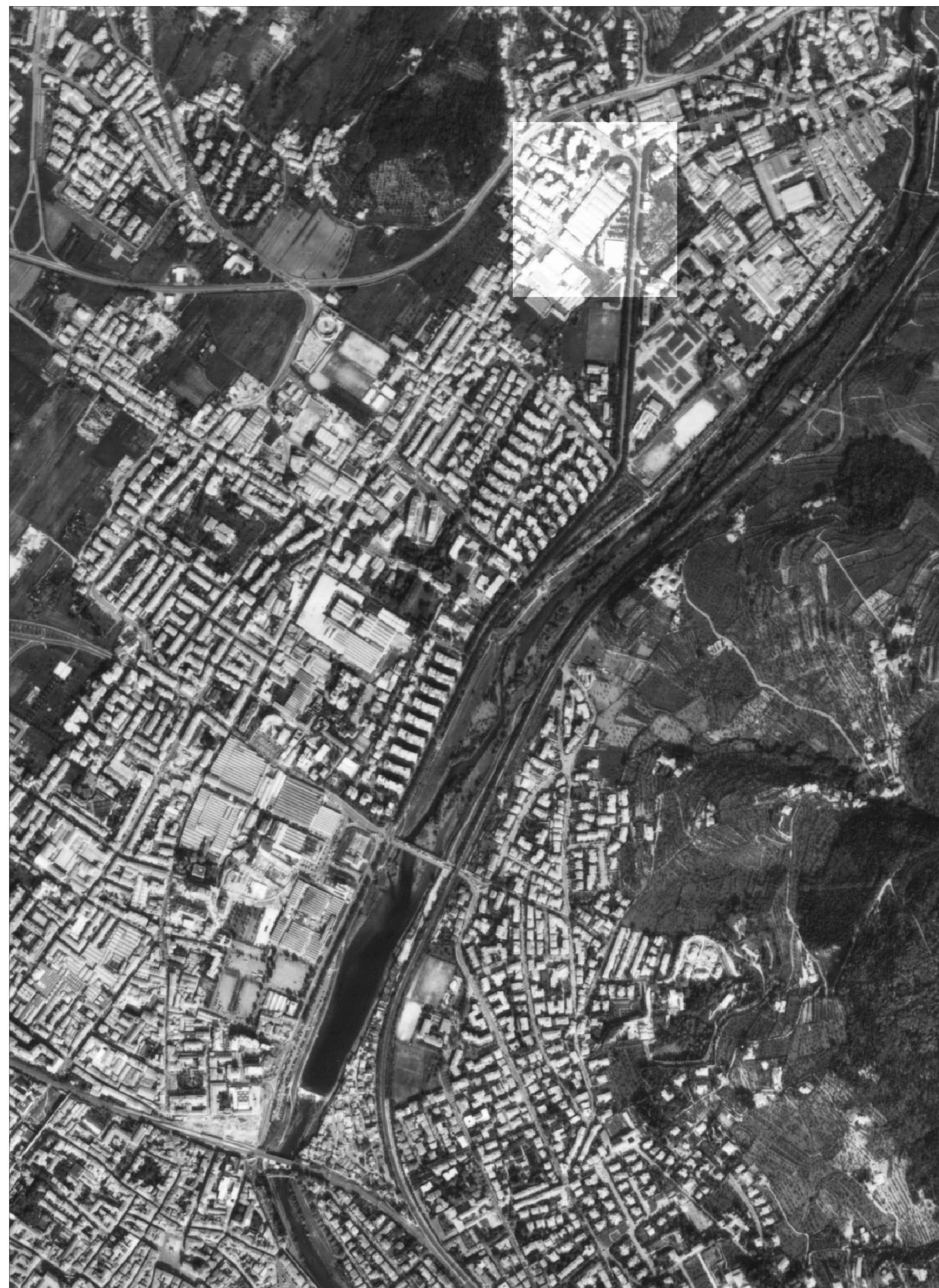
ESTRATTO DA ORTOFOTO. SCALA 1:5.000