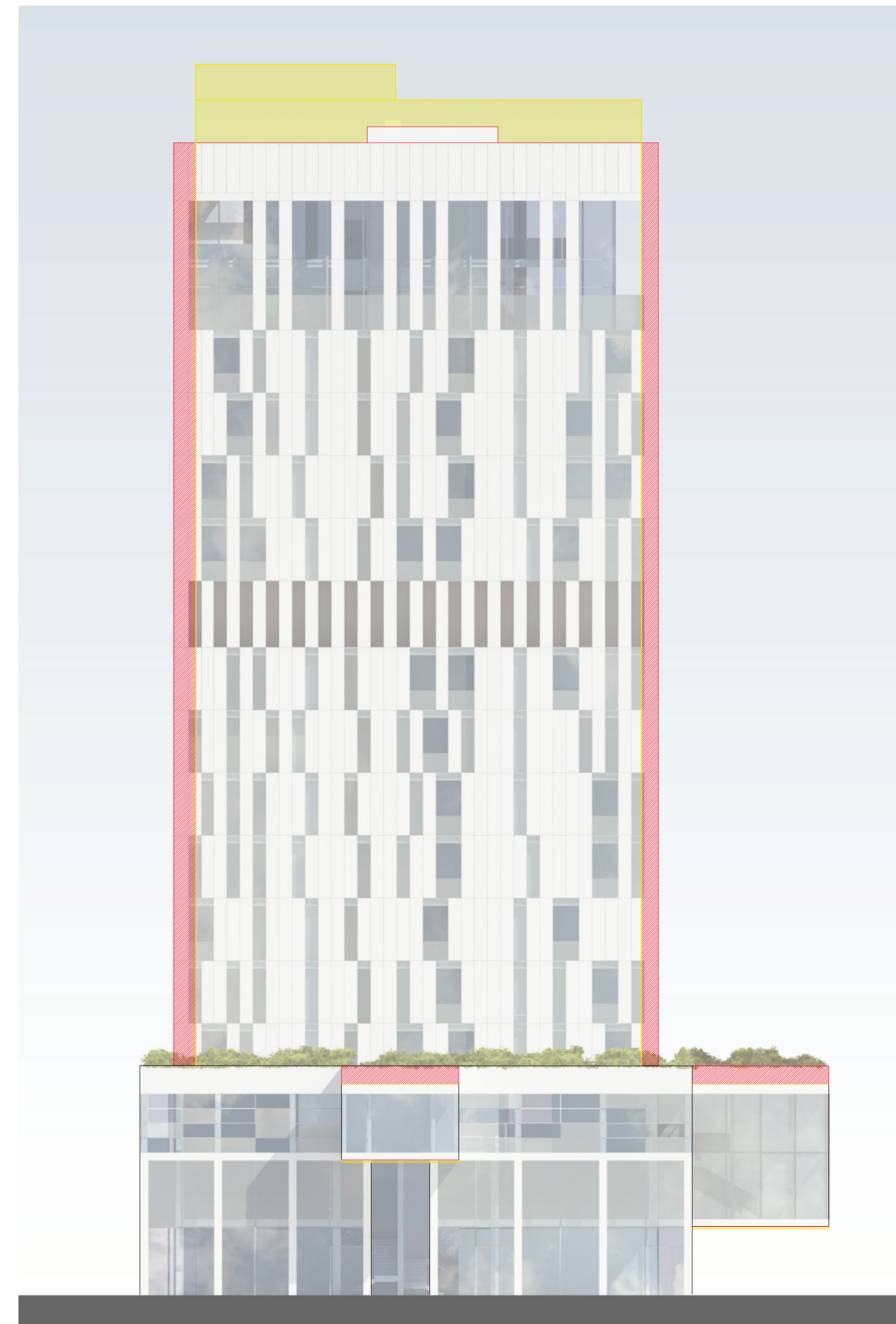
Prospetto est Scala 1 : 200