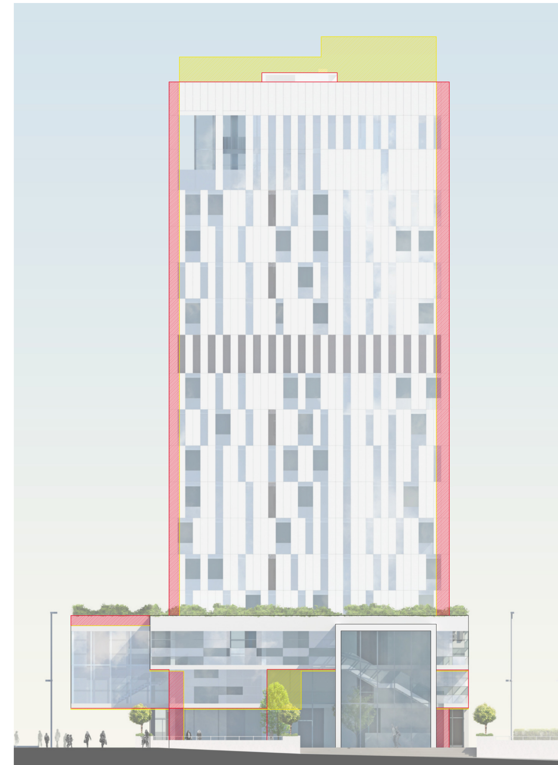
Prospetto ovest Scala 1 : 200