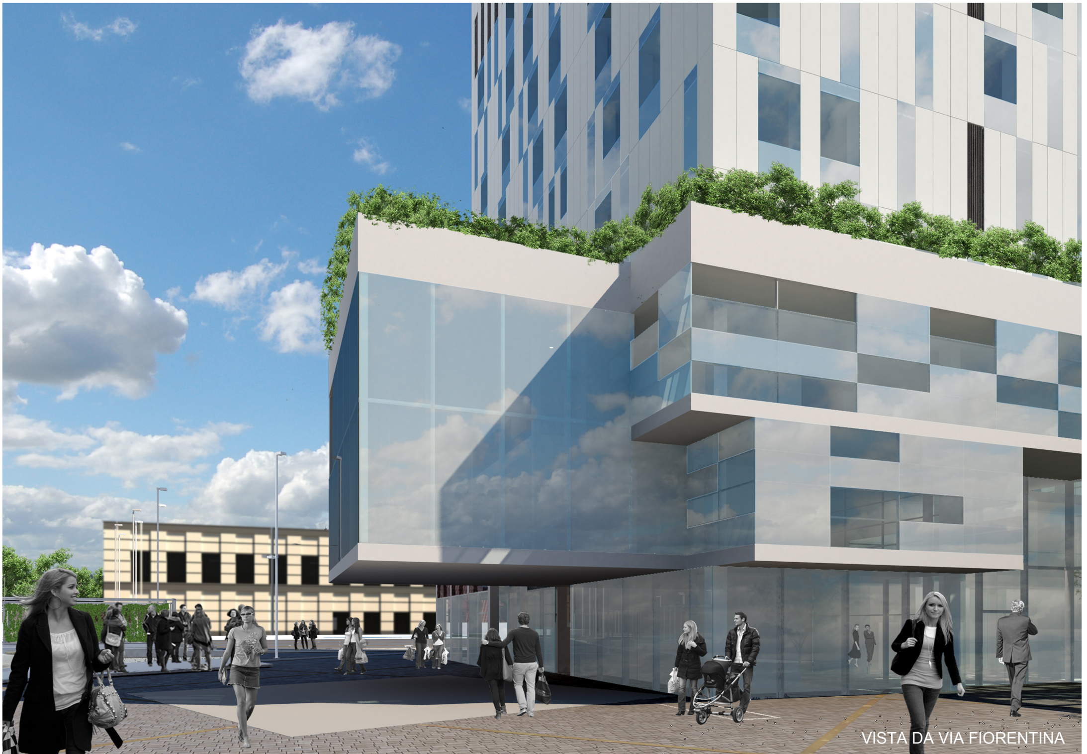
VISTA DA VIA FIORENTINA