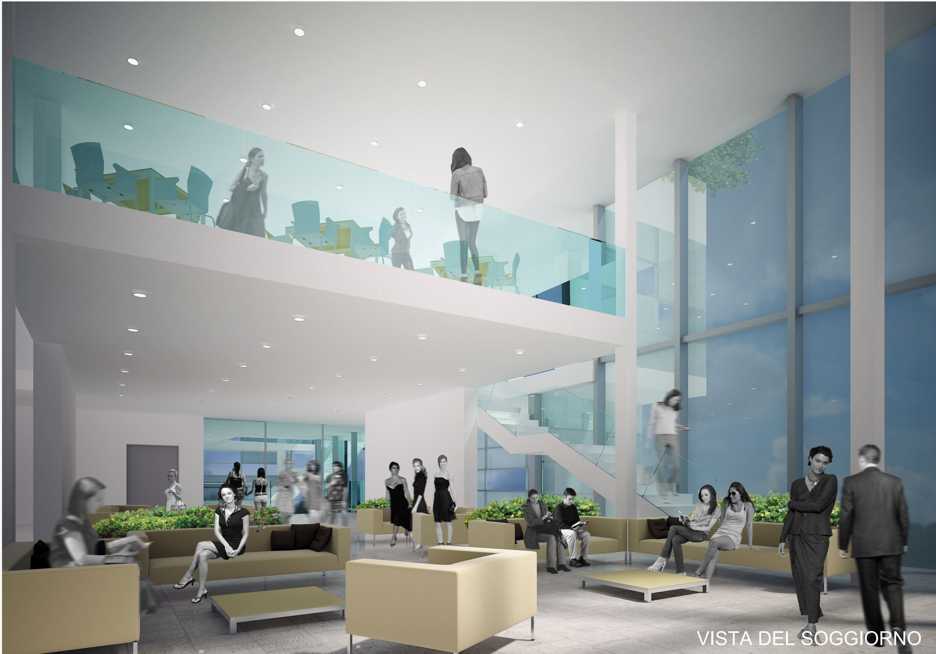
VISTA DEL SOGGIORNO