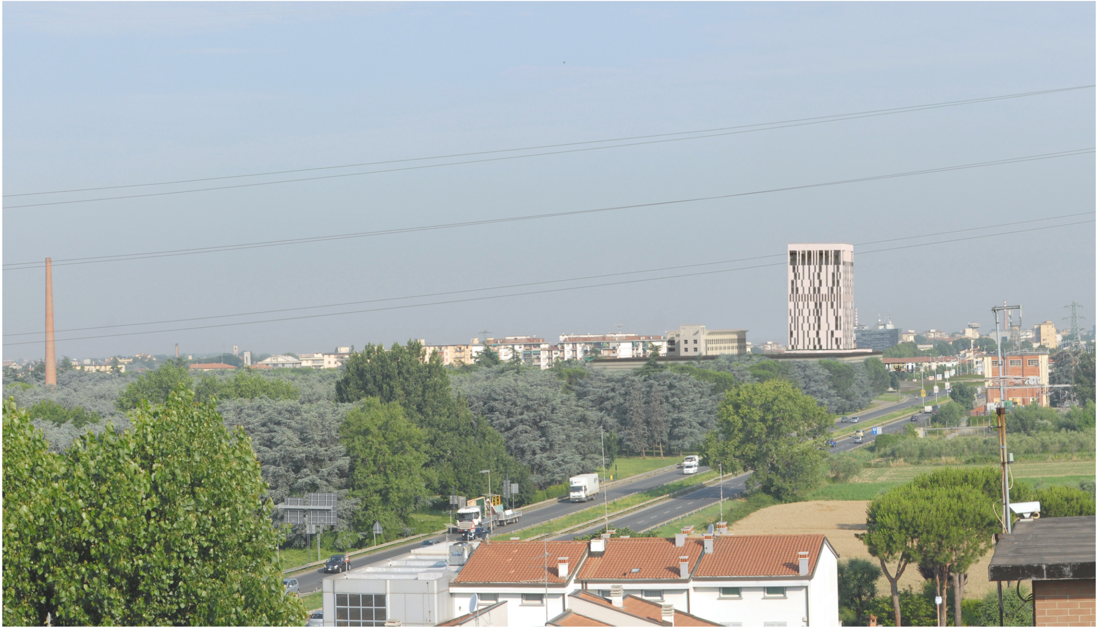
VISTA DA V.LE DELLA REPUBBLICA