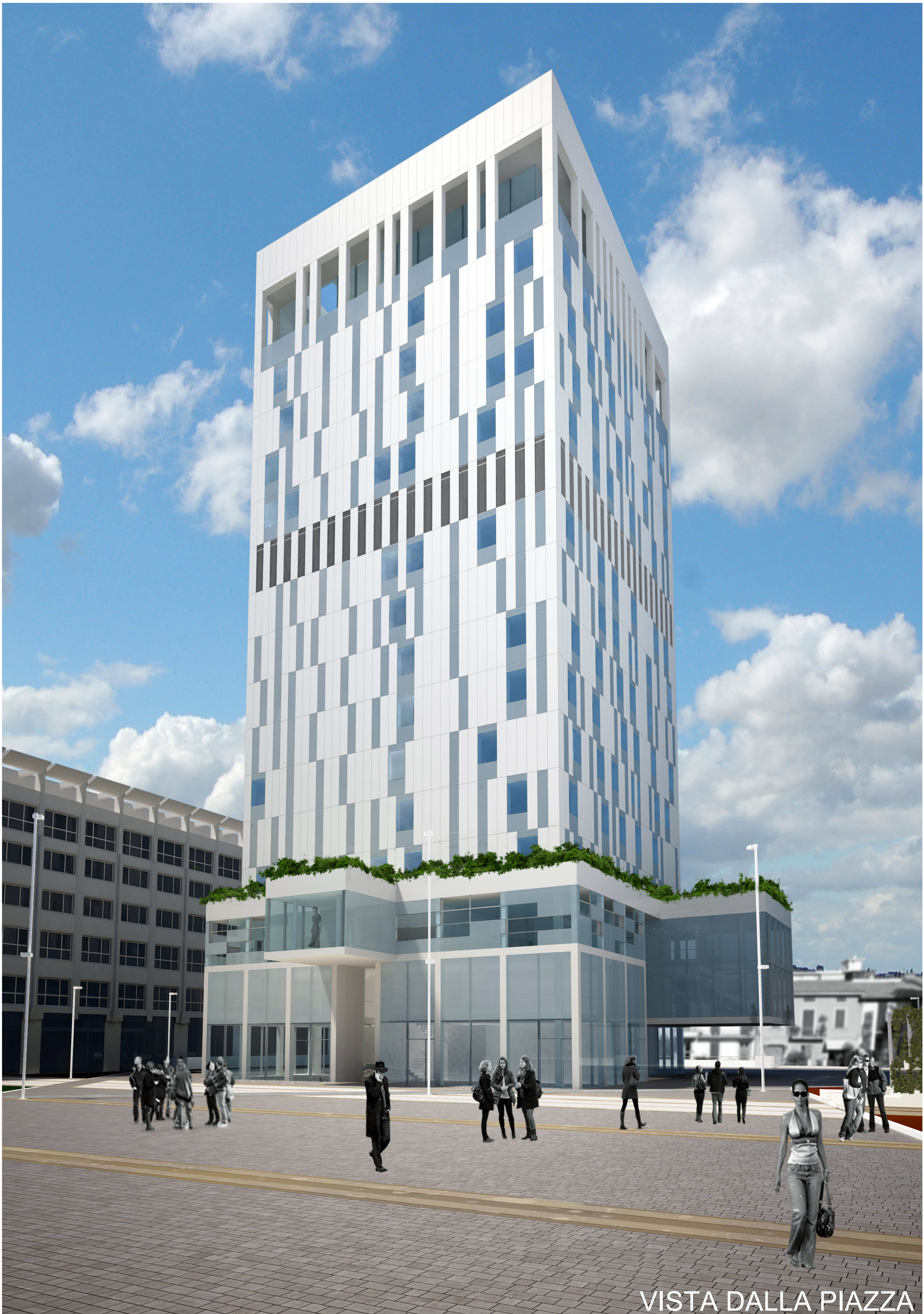
VISTA DALLA PIAZZA