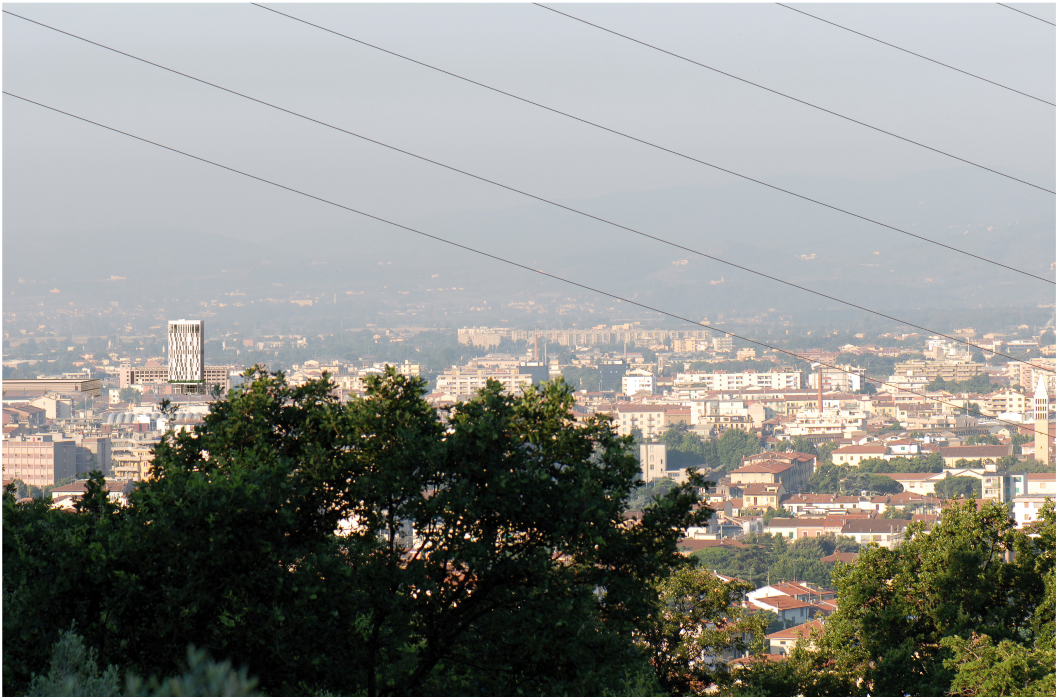
VISTA DA FILETTOLE