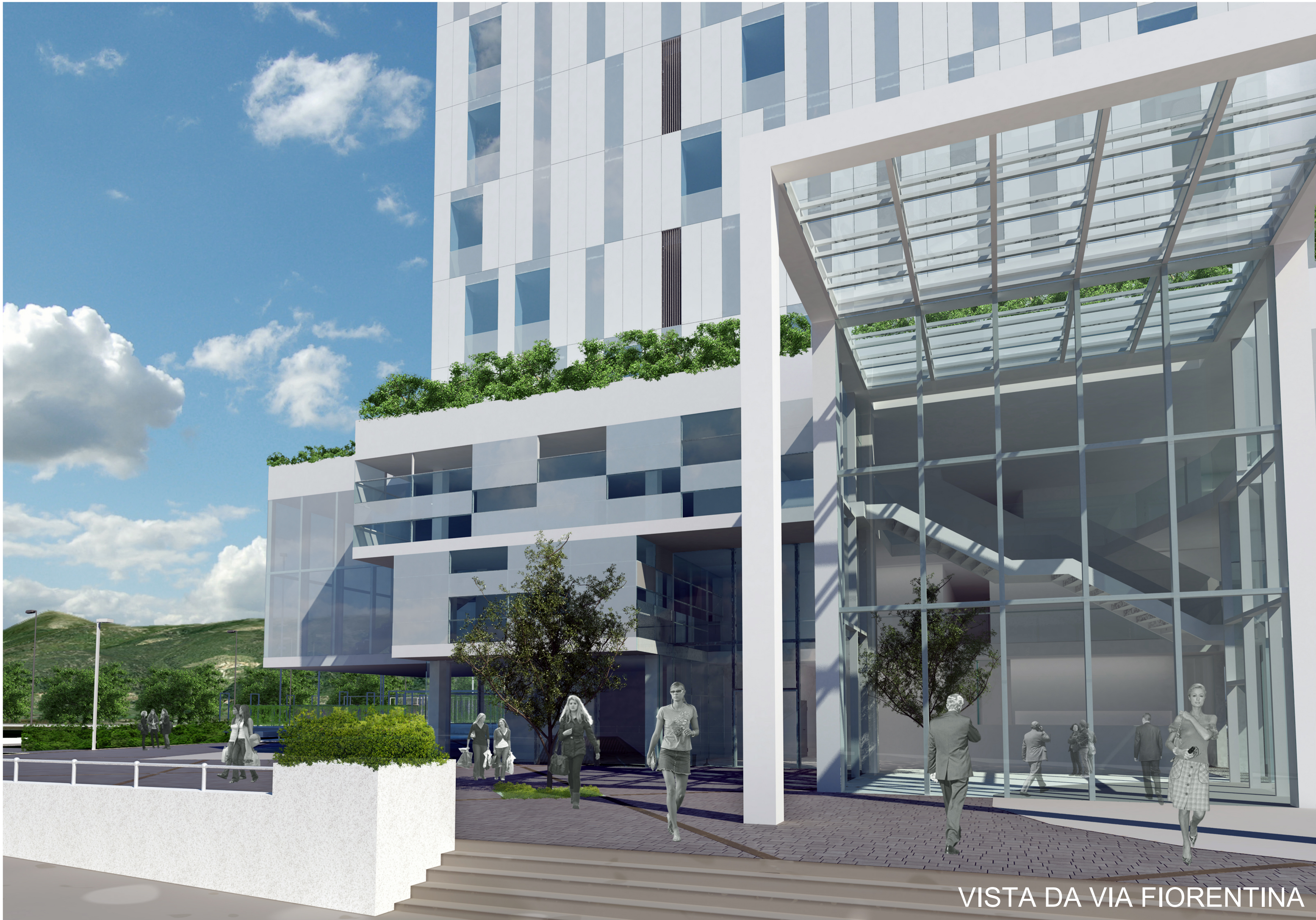
VISTA DA VIA FIORENTINA