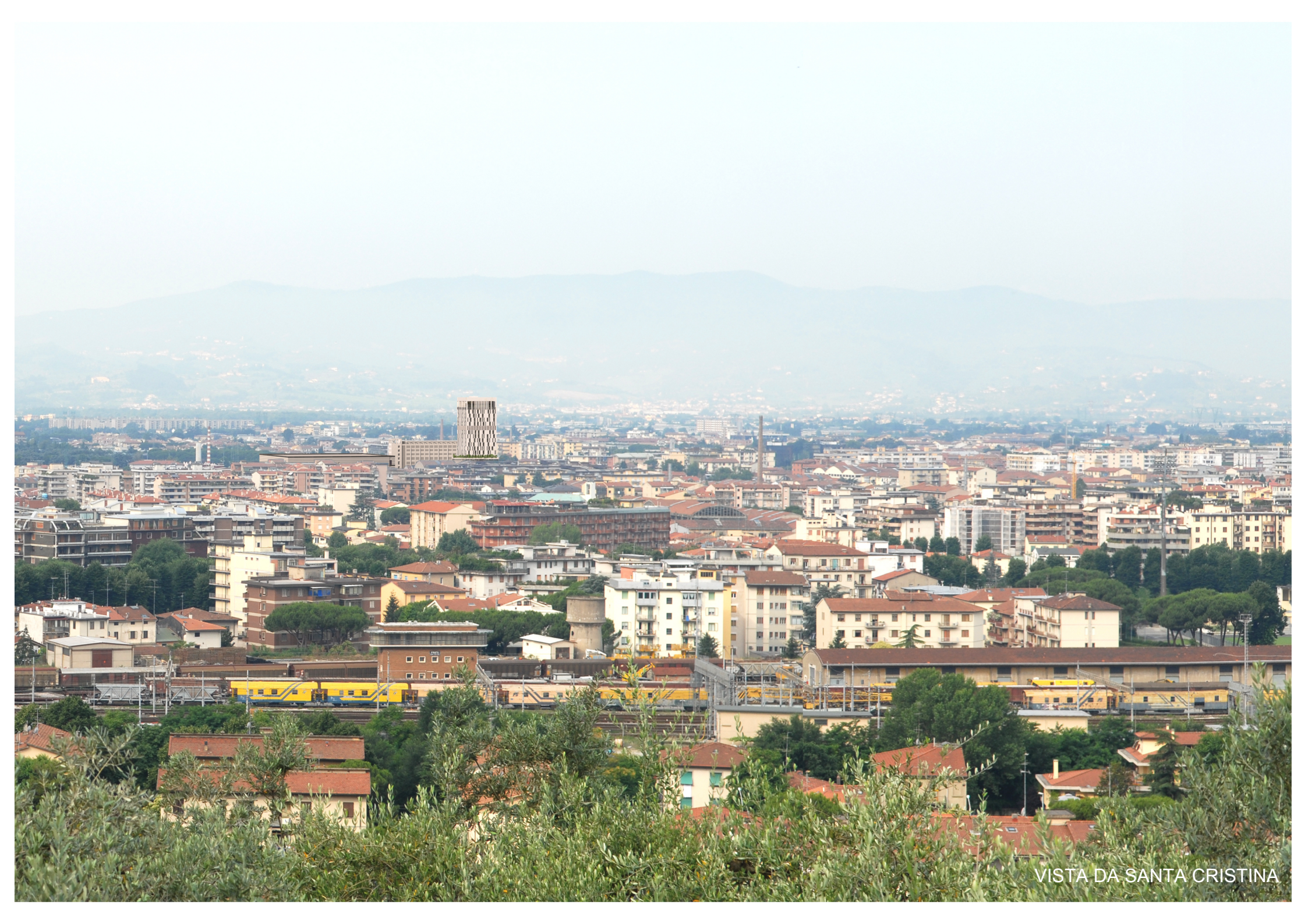
VISTA DA SANTA CRISTINA