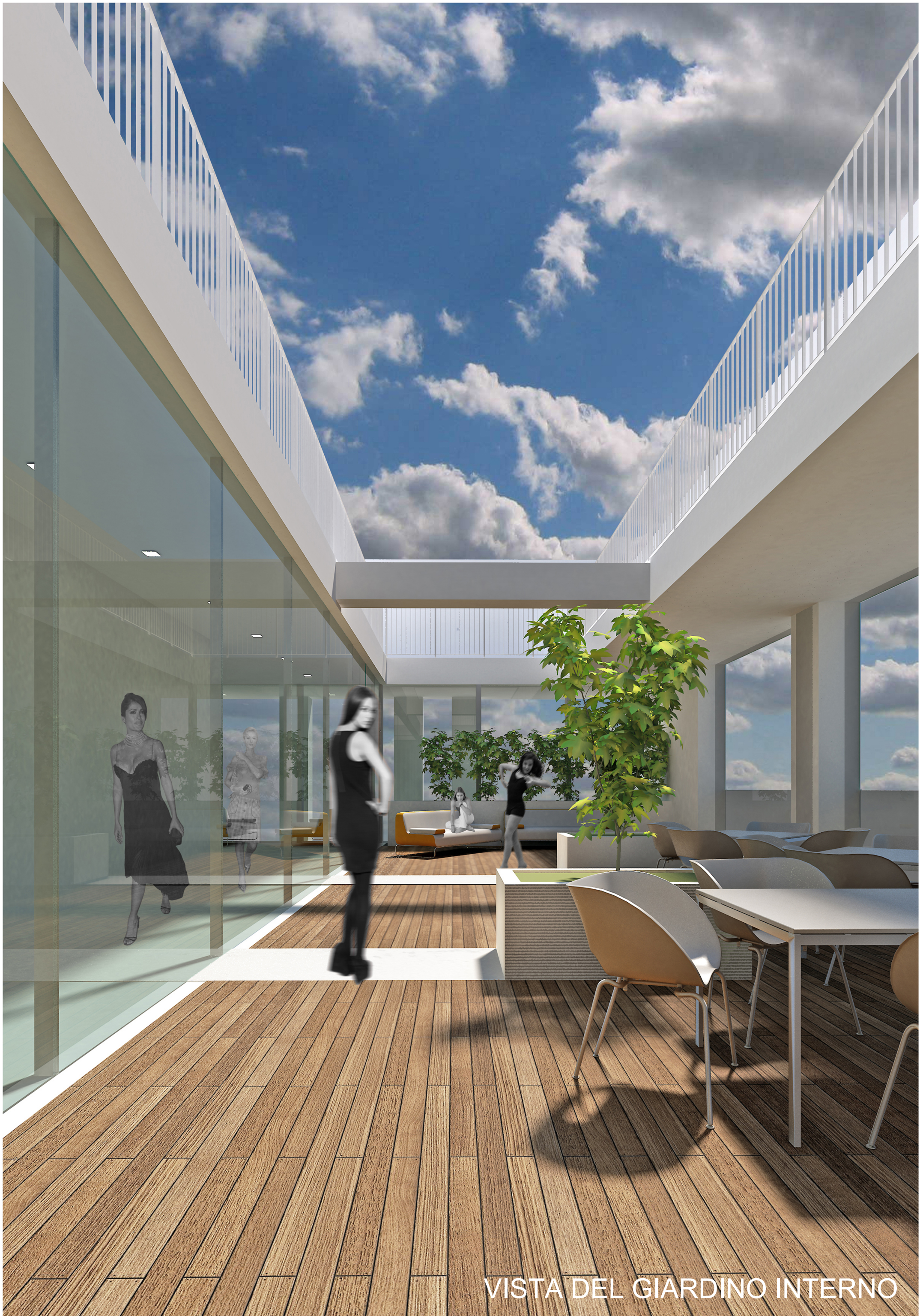
VISTA DEL GIARDINO INTERNO