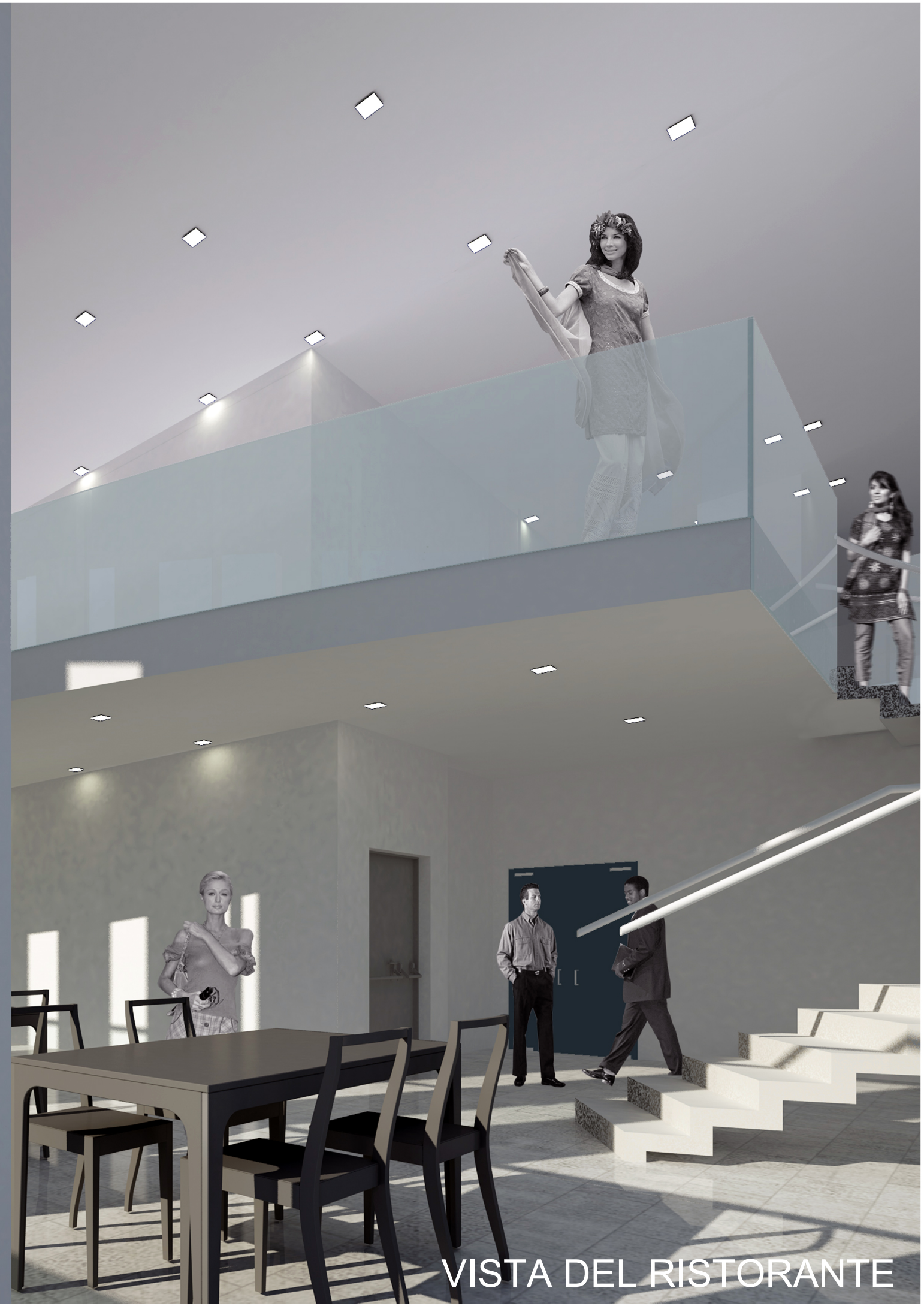
VISTA DEL RISTORANTE