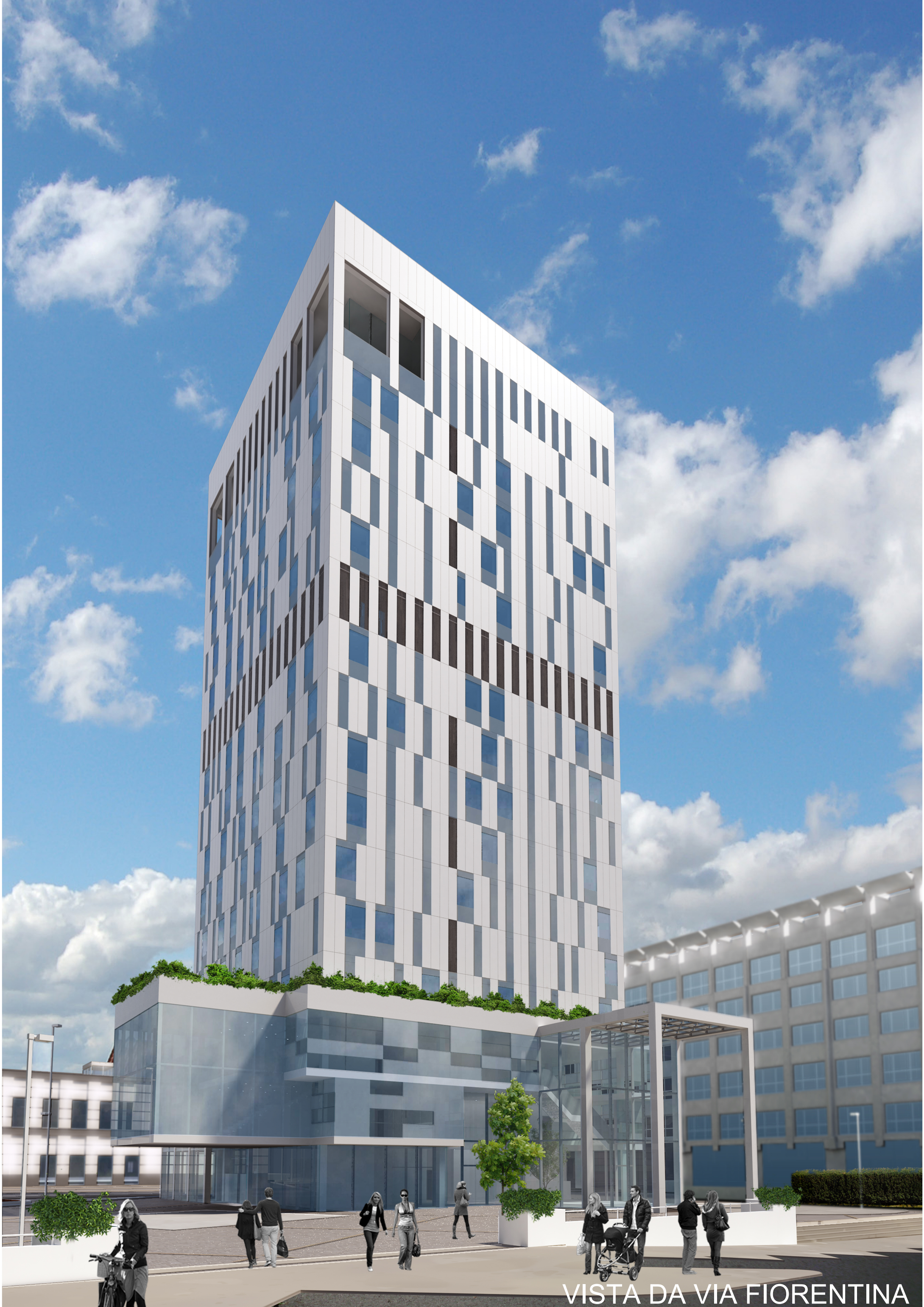
VISTA DA VIA FIORENTINA