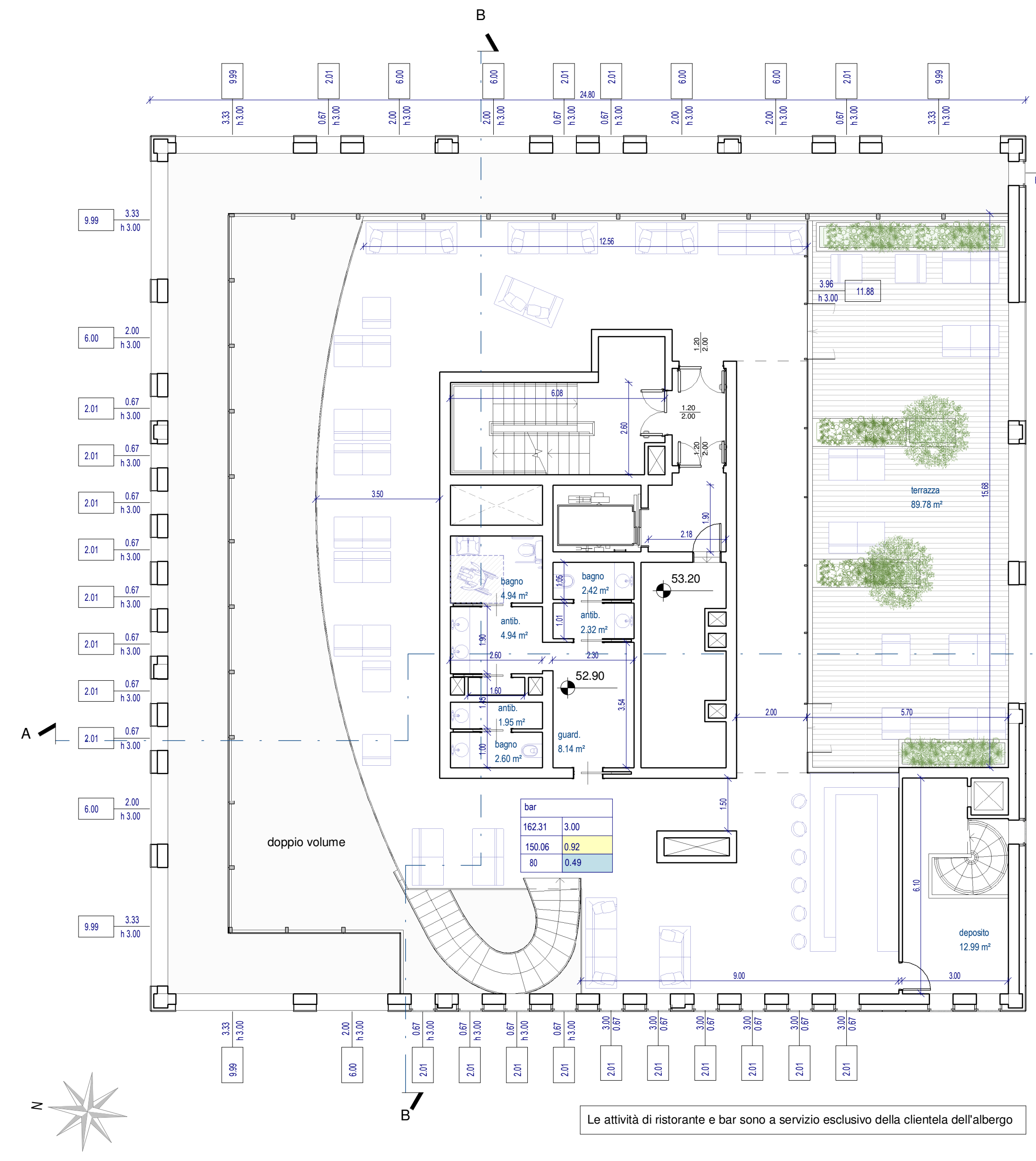
PIANTA PIANO 16°