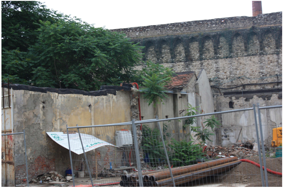
via del Melograno