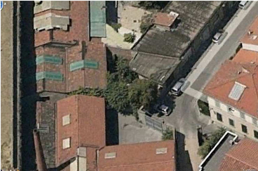
Foto aeree via del Melograno