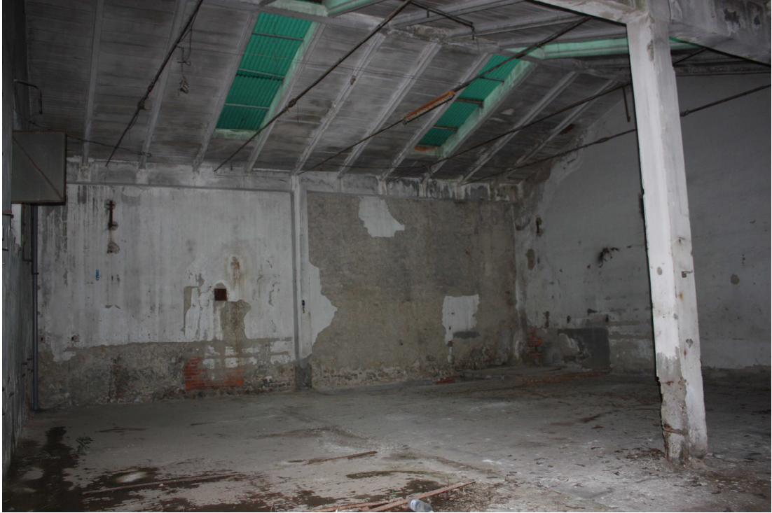
interno capannone via del Melograno