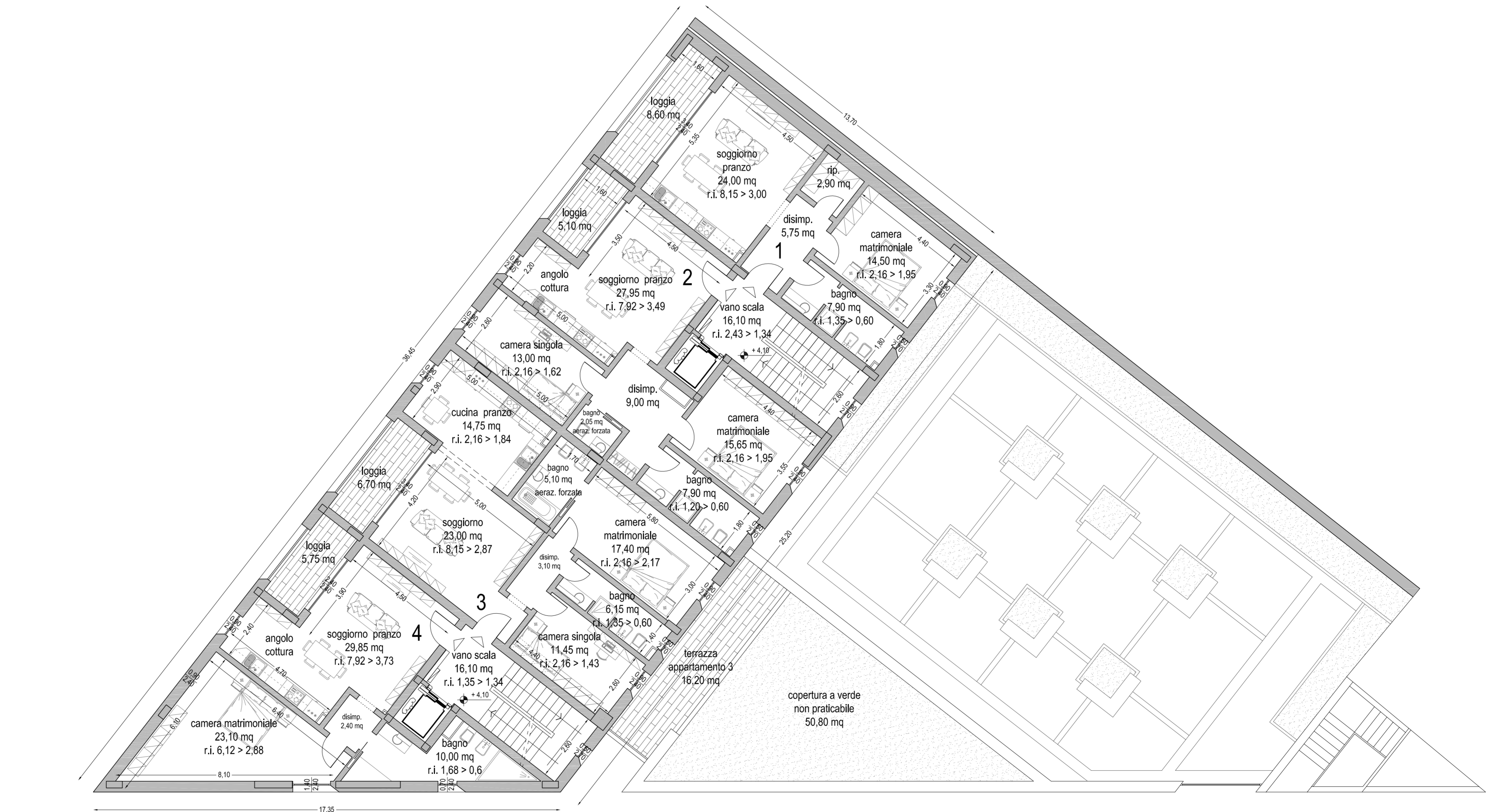
PIANTA PIANO PRIMO - SCALA 1/100