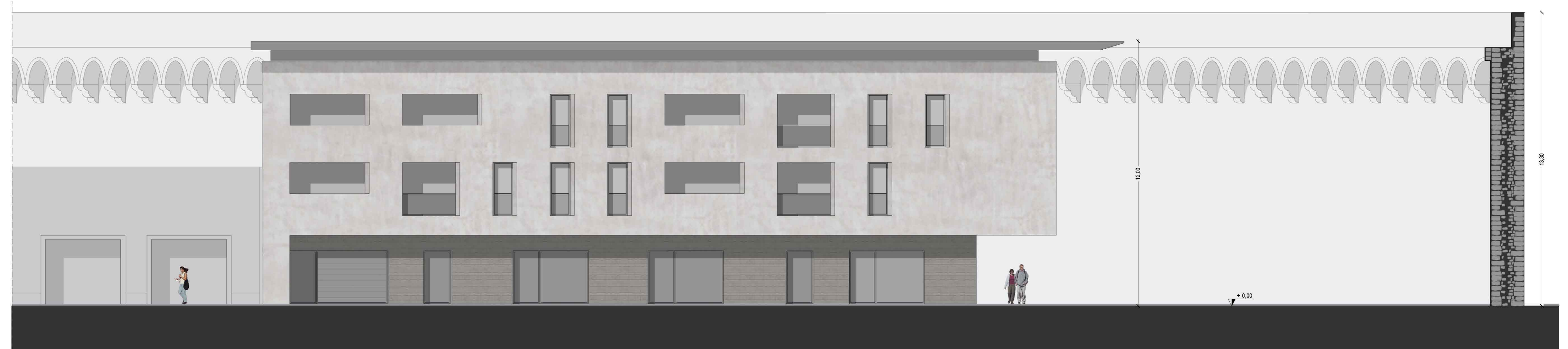
PROSPETTO SU VIA FRASCATI - SCALA 1/100