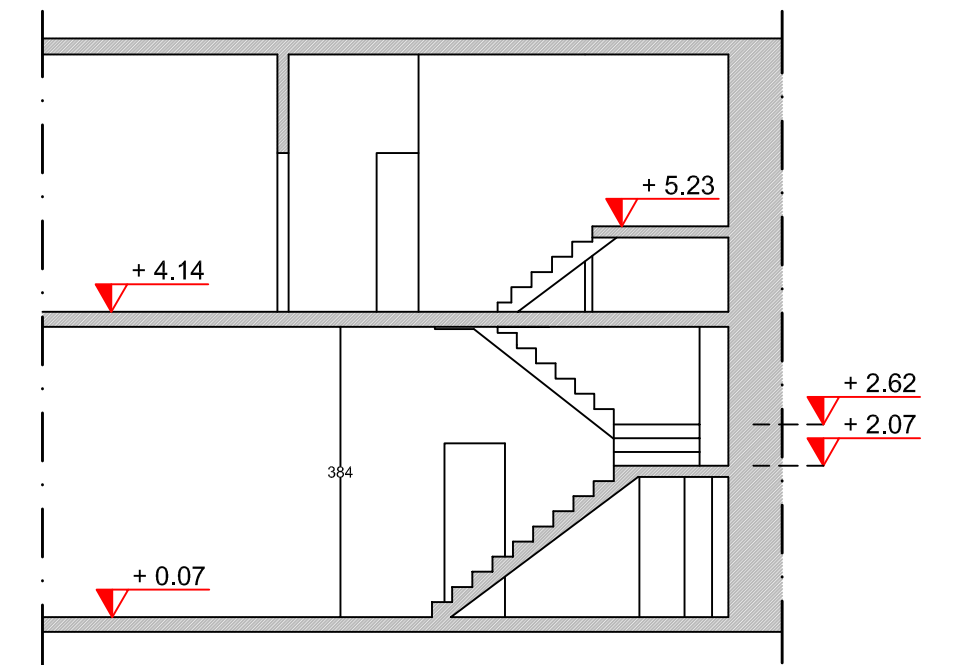
SEZIONE AA'_ scala 1:100