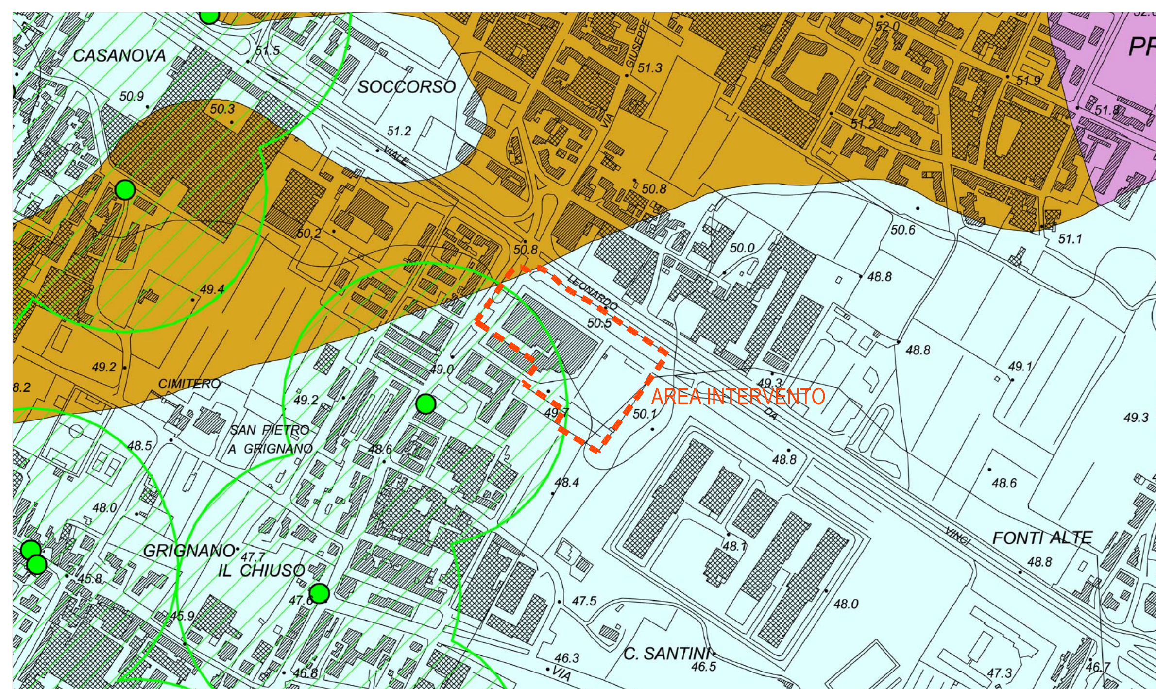
CARTA DELLE PROBLEMATICHE IDROGEOLOGICHE