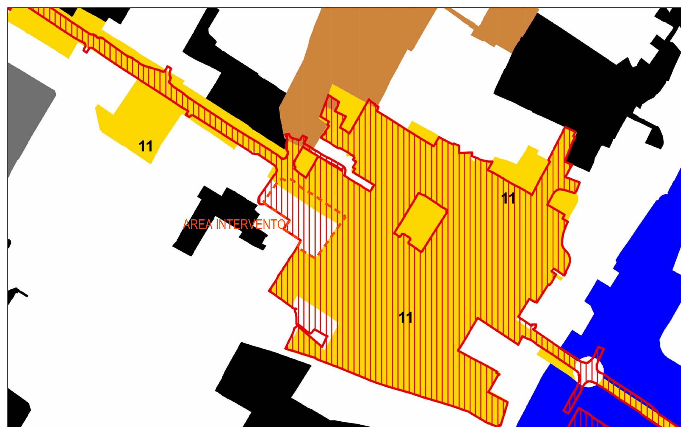
SCHEMI DIRETTORI E PROGETTI NORMA