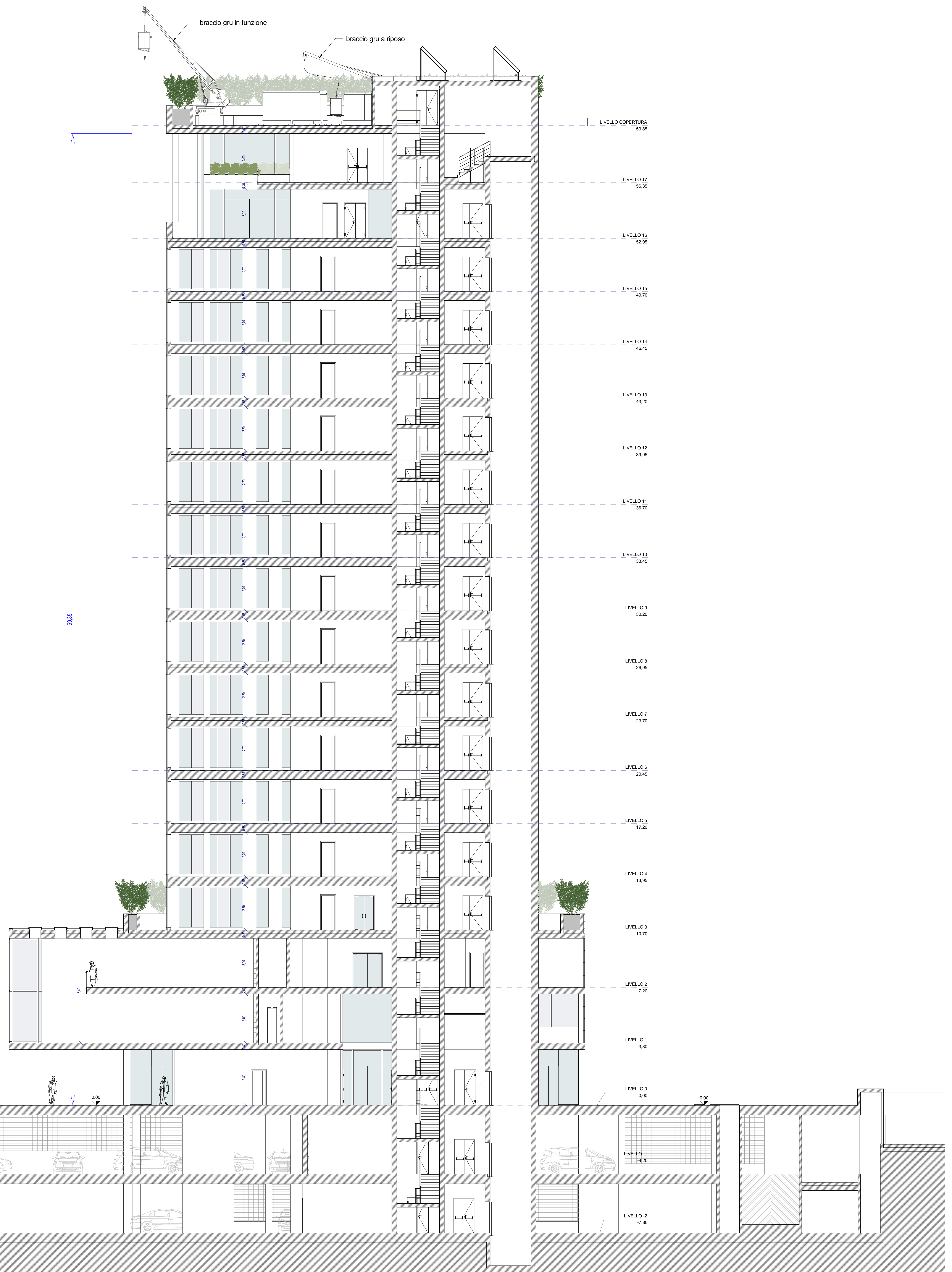
SEZIONE BB scala 1:100