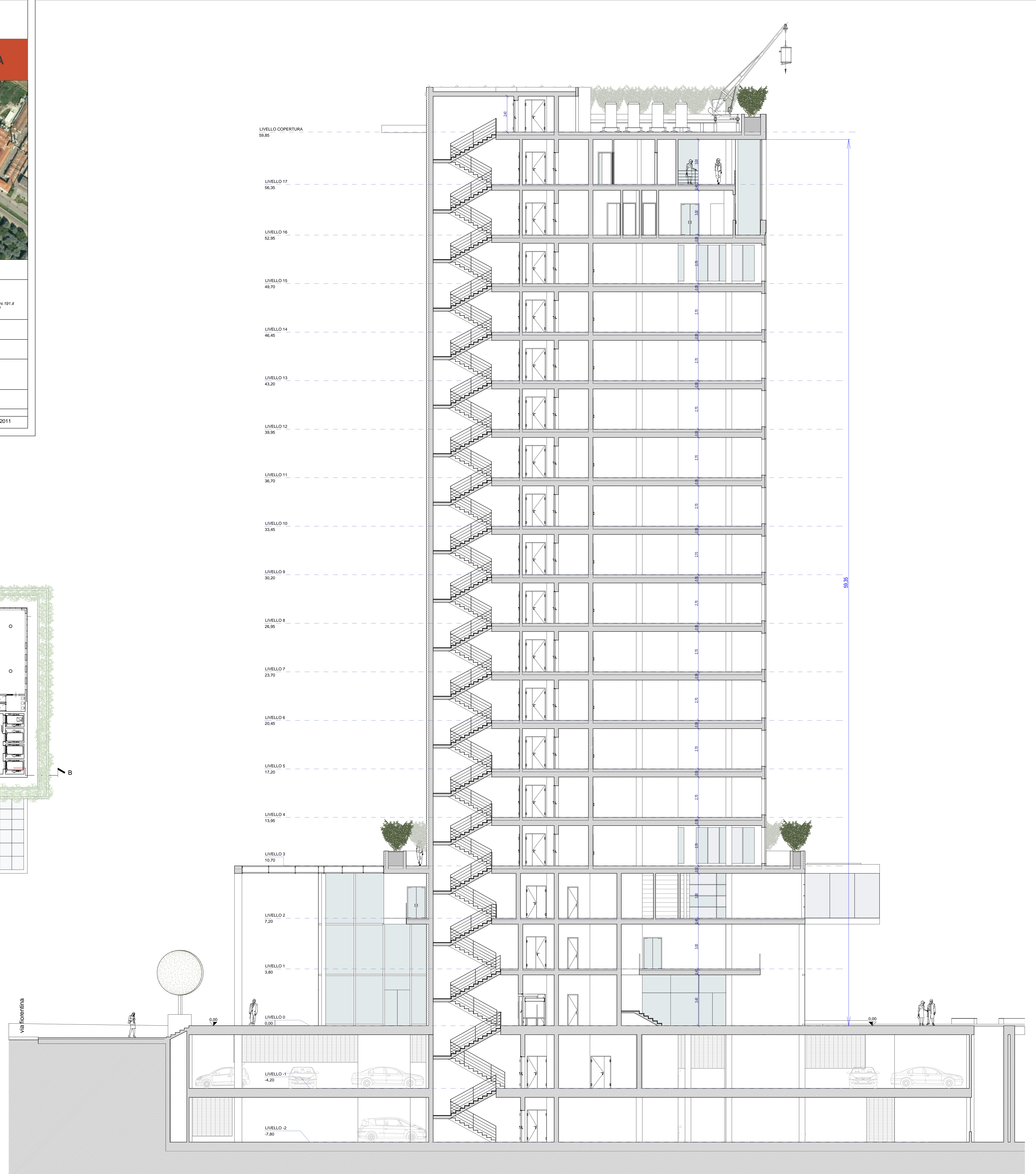
SEZIONE AA scala 1:100