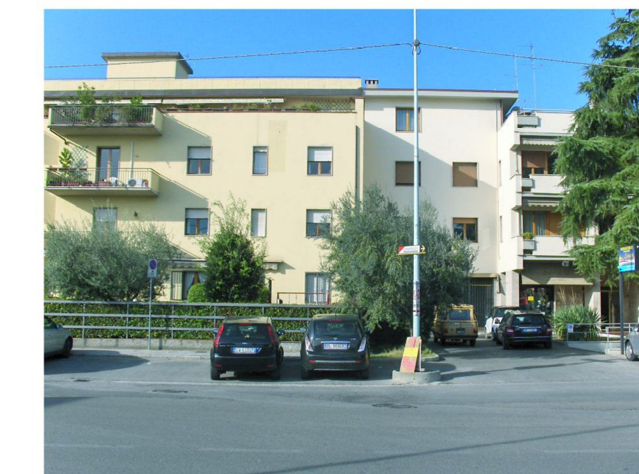
Edifici di 4 piani