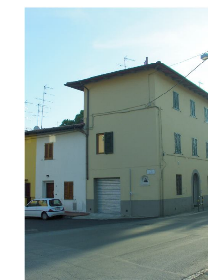
Edifici di 3 piani