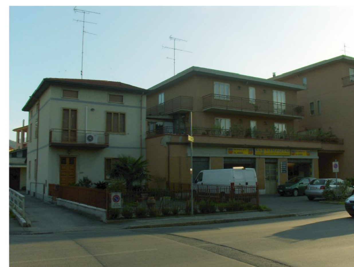
Edifici di 2/3 piani