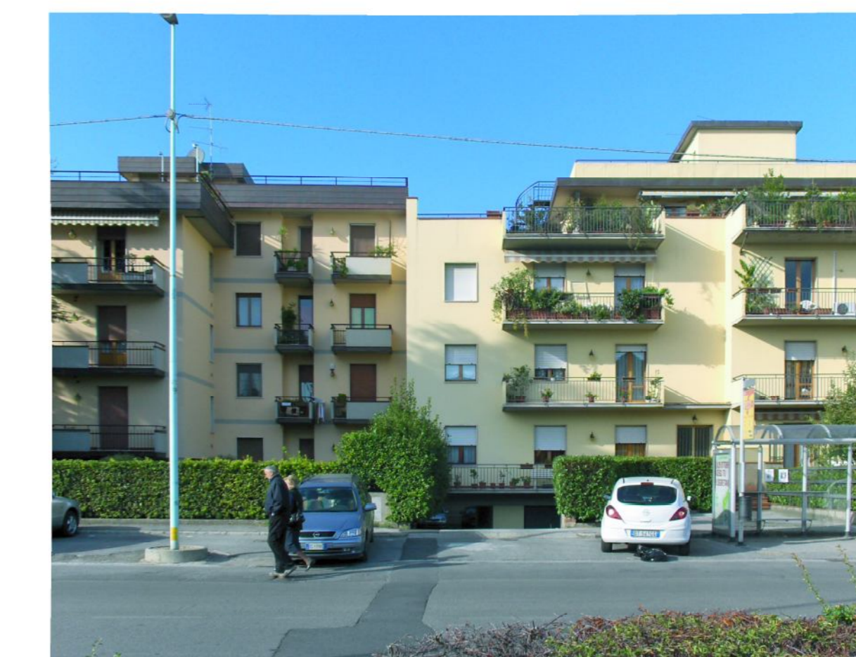
Edifici di 4 piani