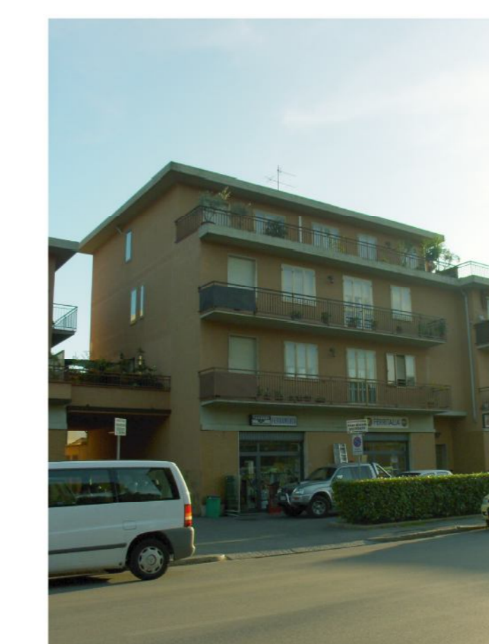
Edificio 4 piani