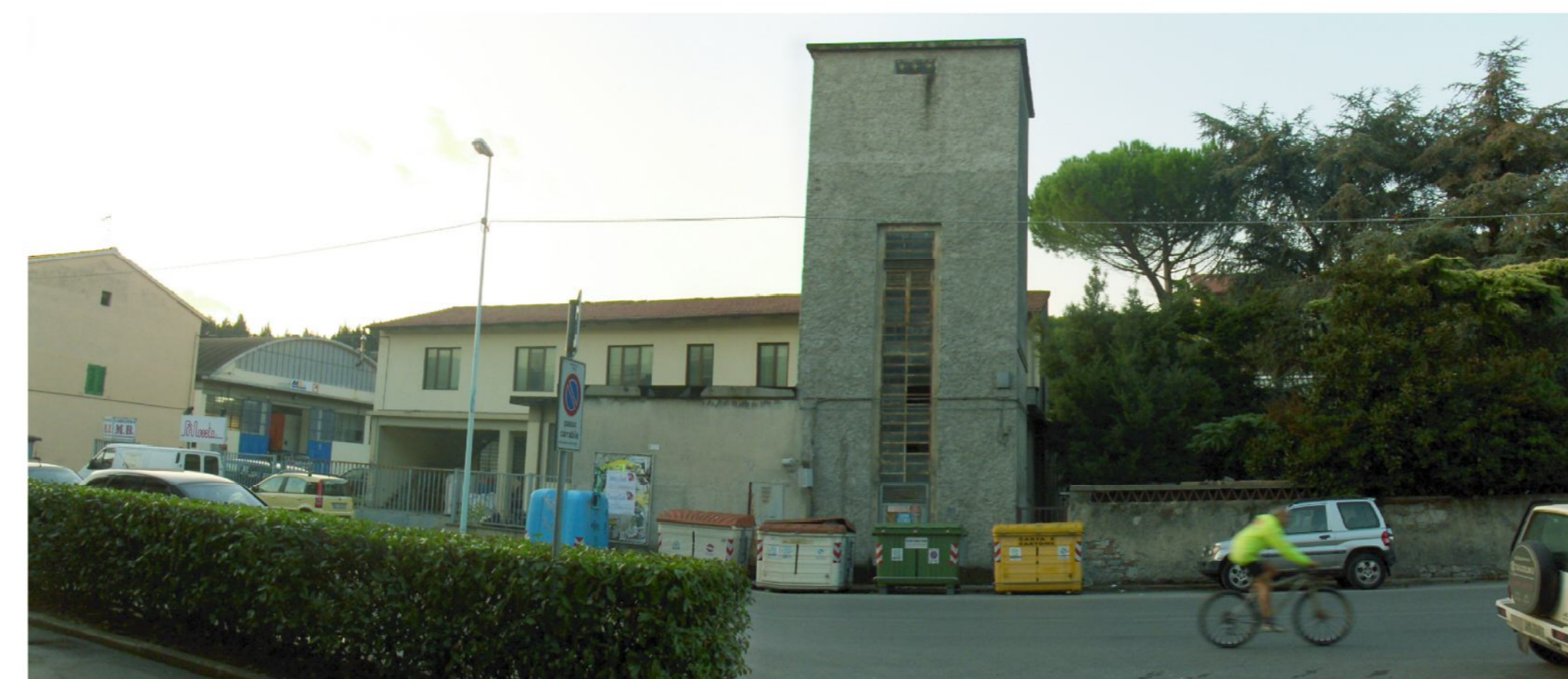
Area di intervento