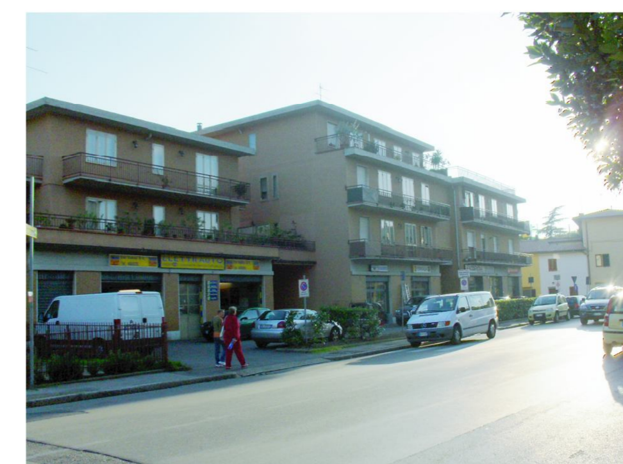
Edifici di 3/4 piani