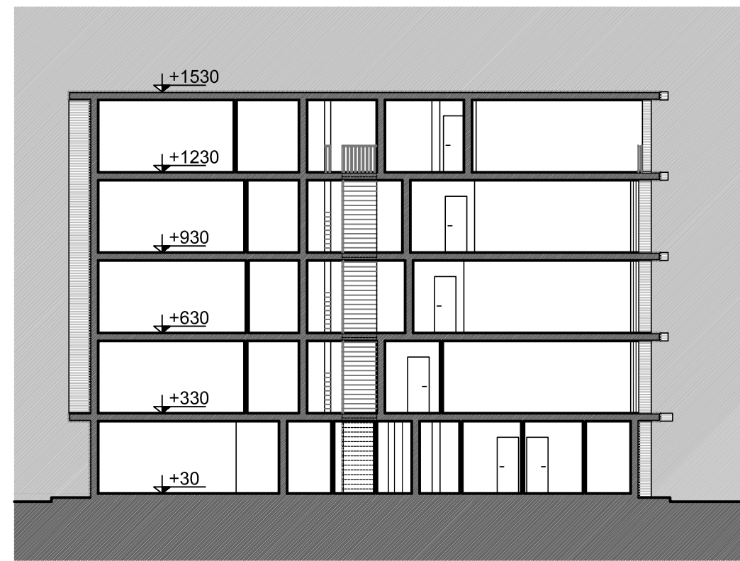
SEZIONE A-A - Rapp. 1:200