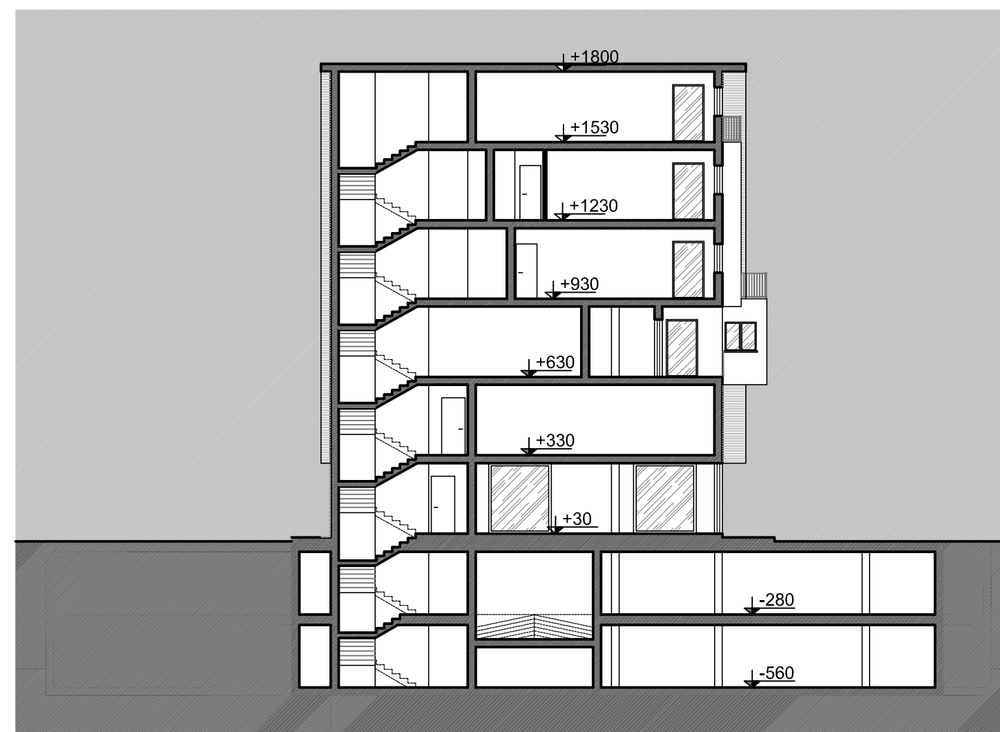
SEZIONE B-B - Rapp. 1:200