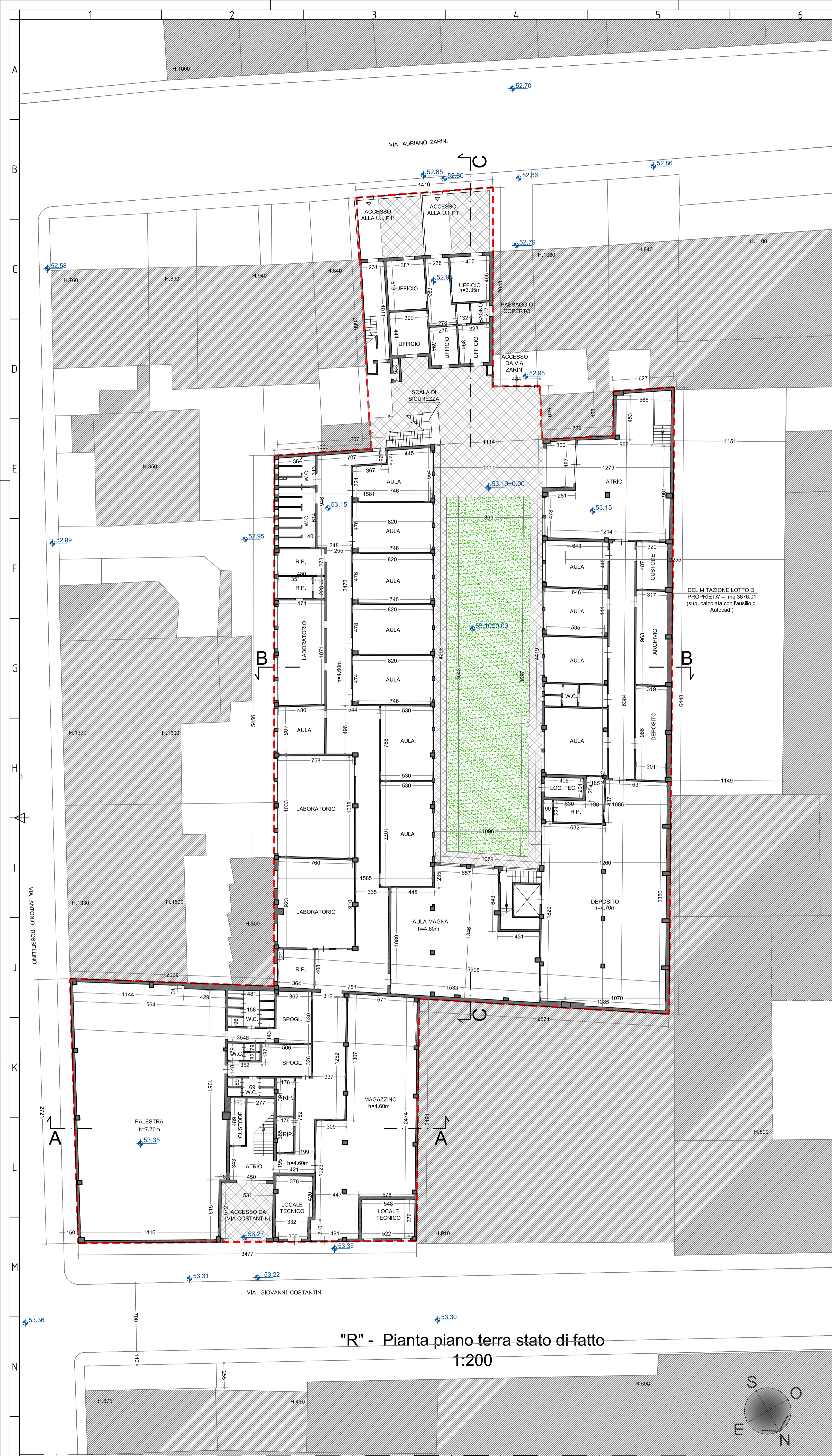
"R" - Pianta piano terra stato di fatto