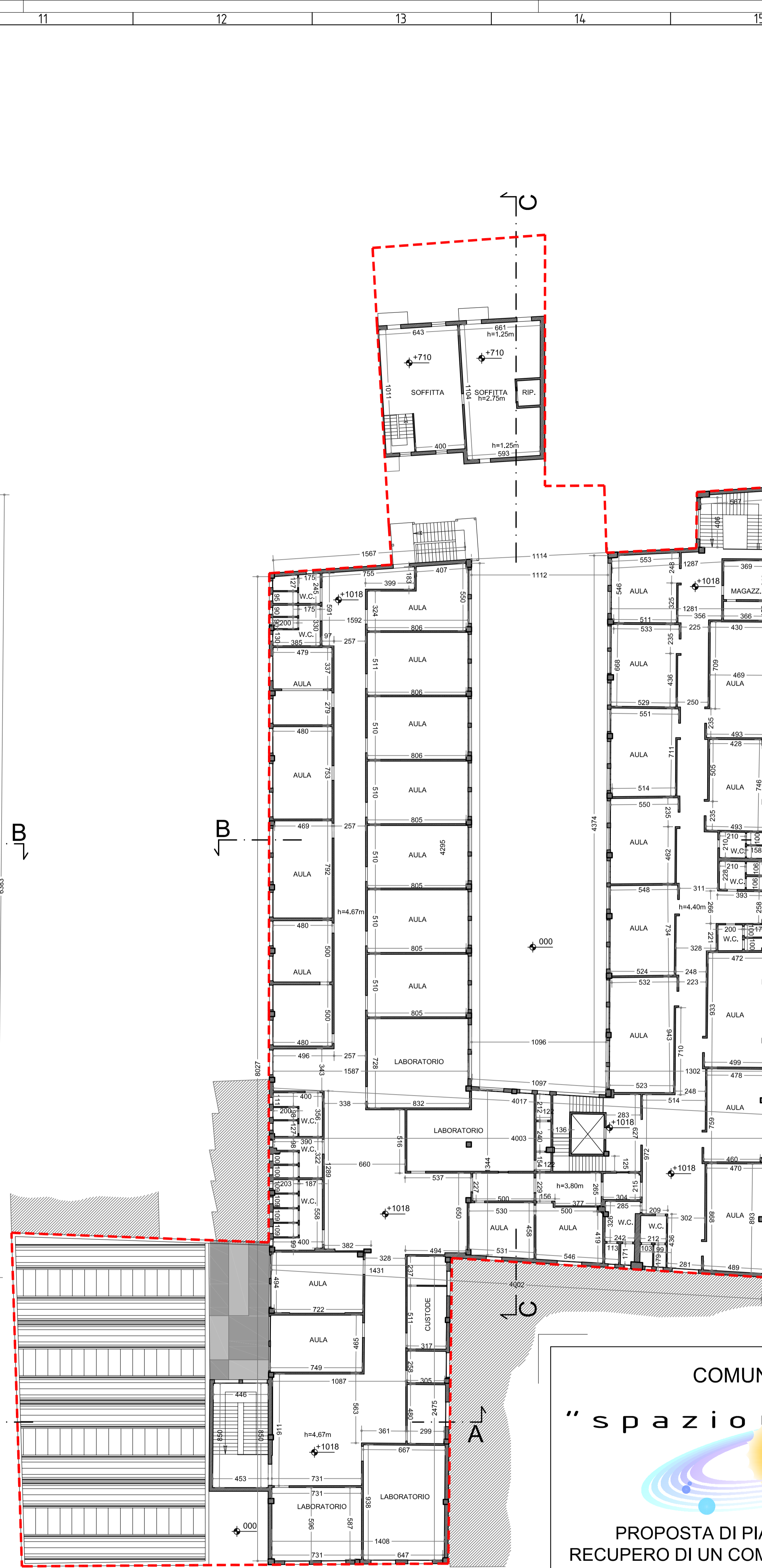
"R" - Pianta piano secondo stato di fatto