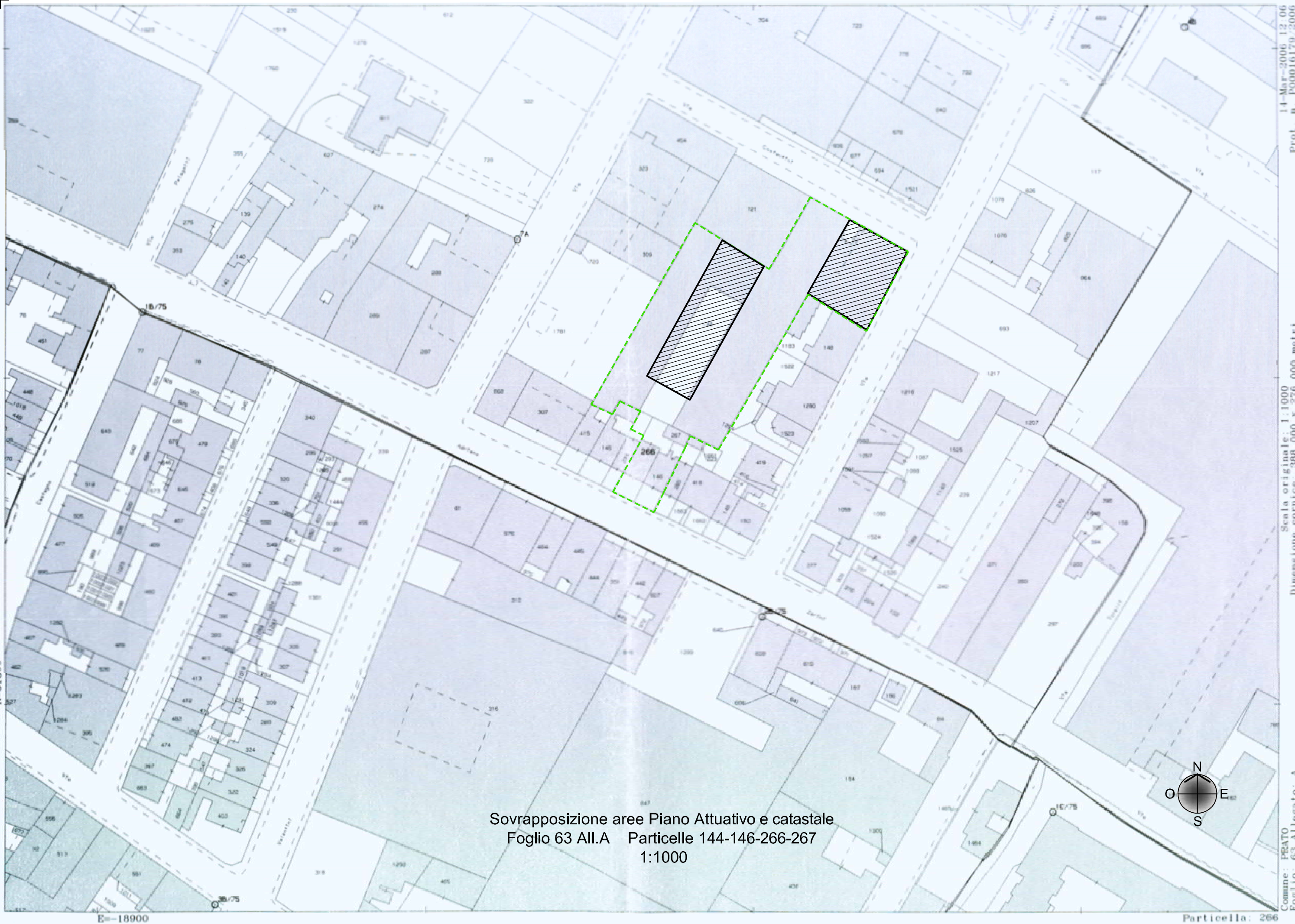
Sovrapposizione aree Piano Attuativo e catastale Foglio 63 All. A Particelle 144-146-266-267 1:1000