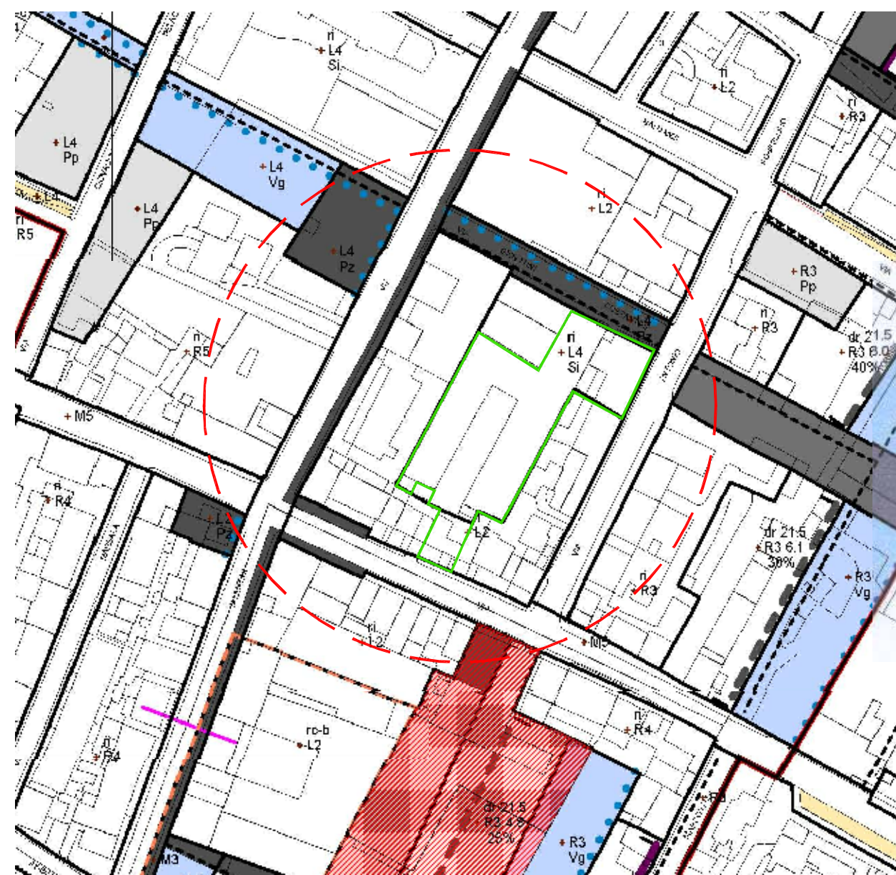
Piano Attuativo e previsioni strumenti urbanistici 1:2000