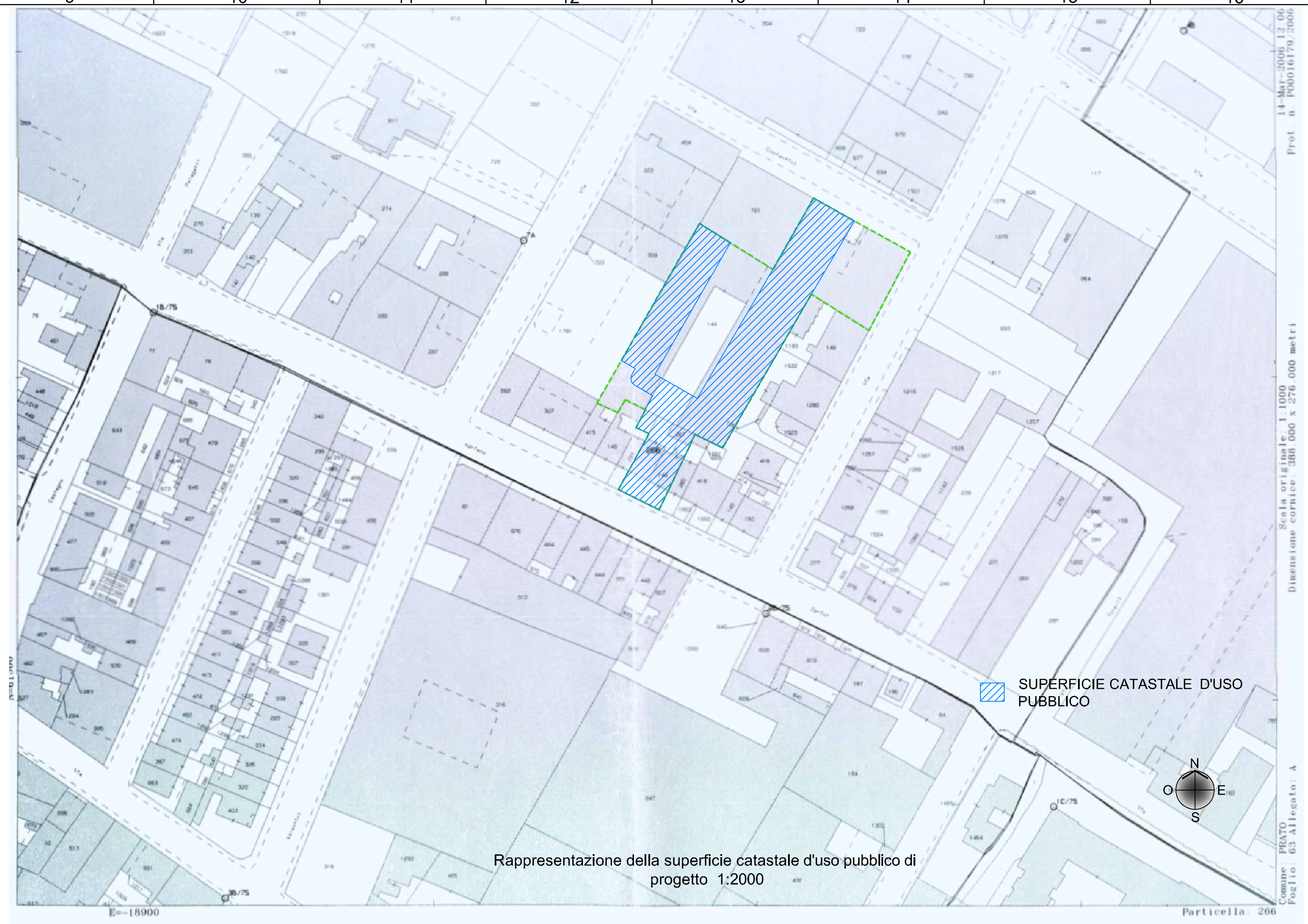
Rappresentazione della superficie catastale d'uso pubblico di progetto 1:2000

Perimetrazione area di progetto in sovrapposizione / raffronto con il Piano Attuativo (previsioni strumenti urbanistici) e cartografica CTR 1:2000