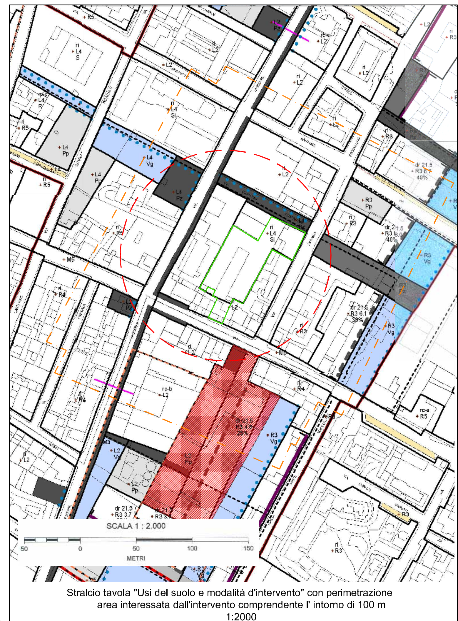
Stralcio tavola "Usi del suolo e modalità d'intervento" con perimetrazione area interessata dall'intervento comprendente l'intorno di 100 m 1:2000