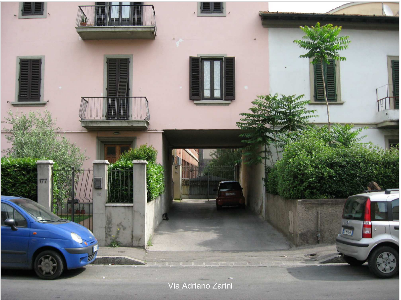
Via Adriano Zarini