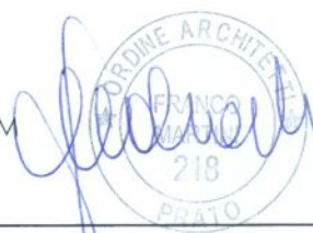
Tavola: ATTO NOTORIO, ESTRATTO DI MAPPA VISURA CATASTALE

C.F. MRT FNC 61B27 G999M Arch. Franco Martini