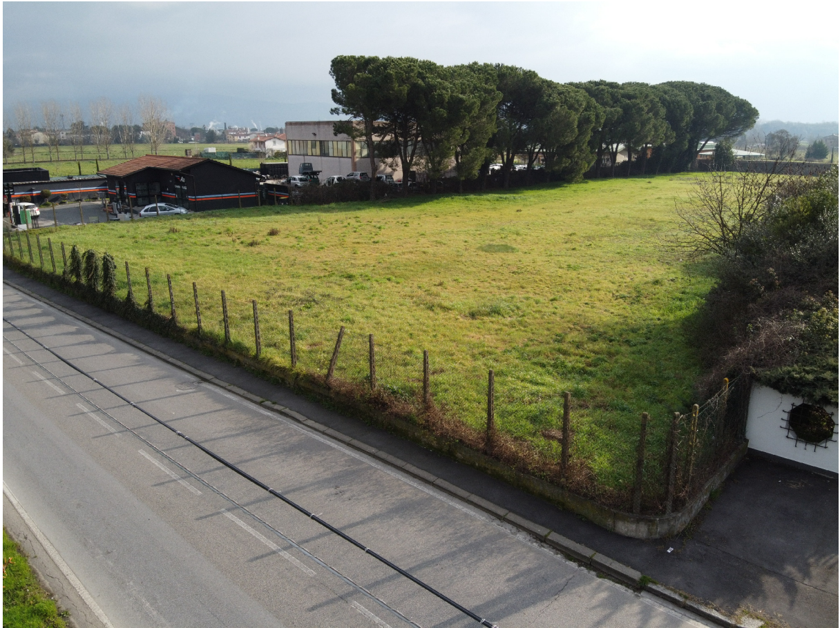
Foto area su Via Braga