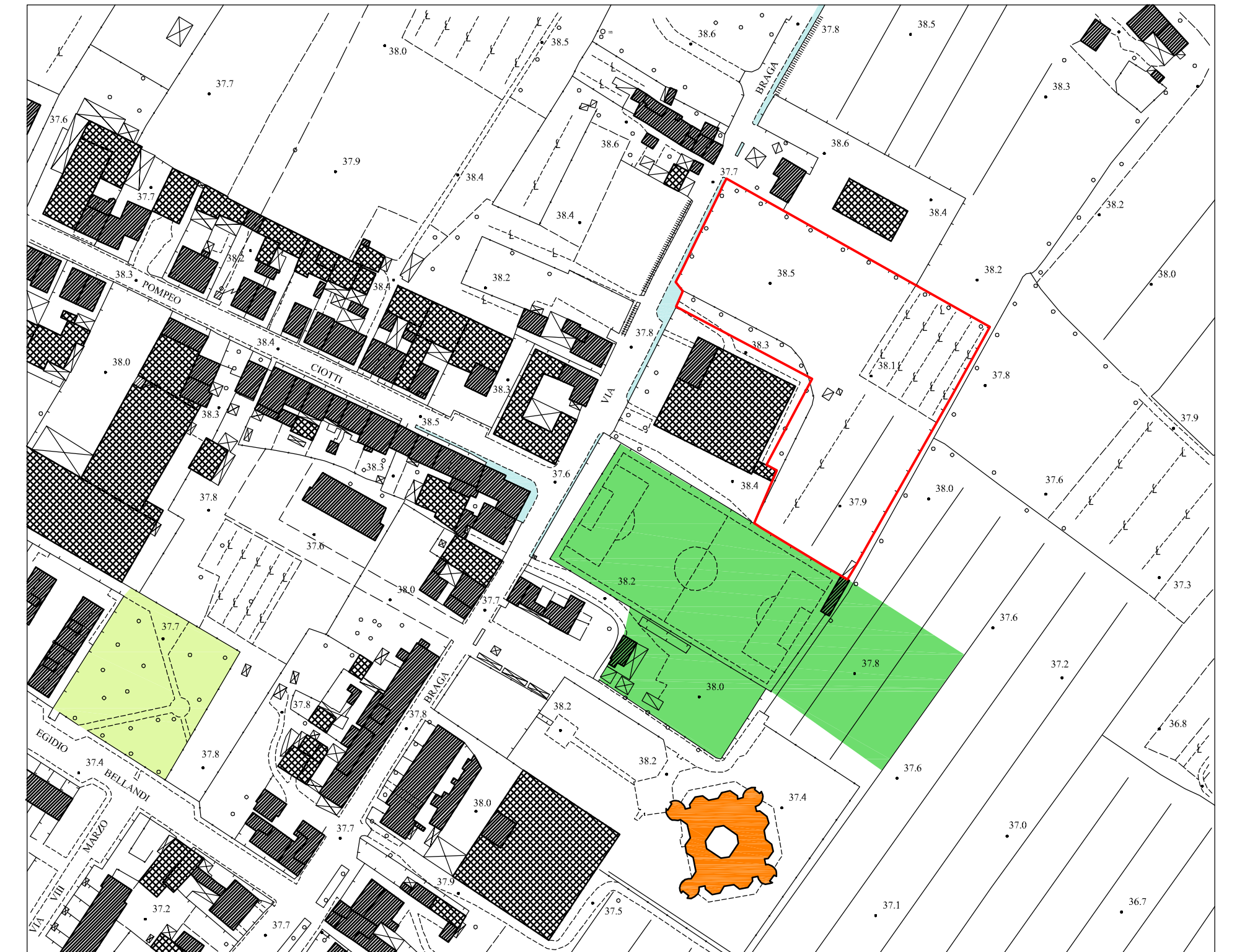
Planimetria - Scala 1:2.000