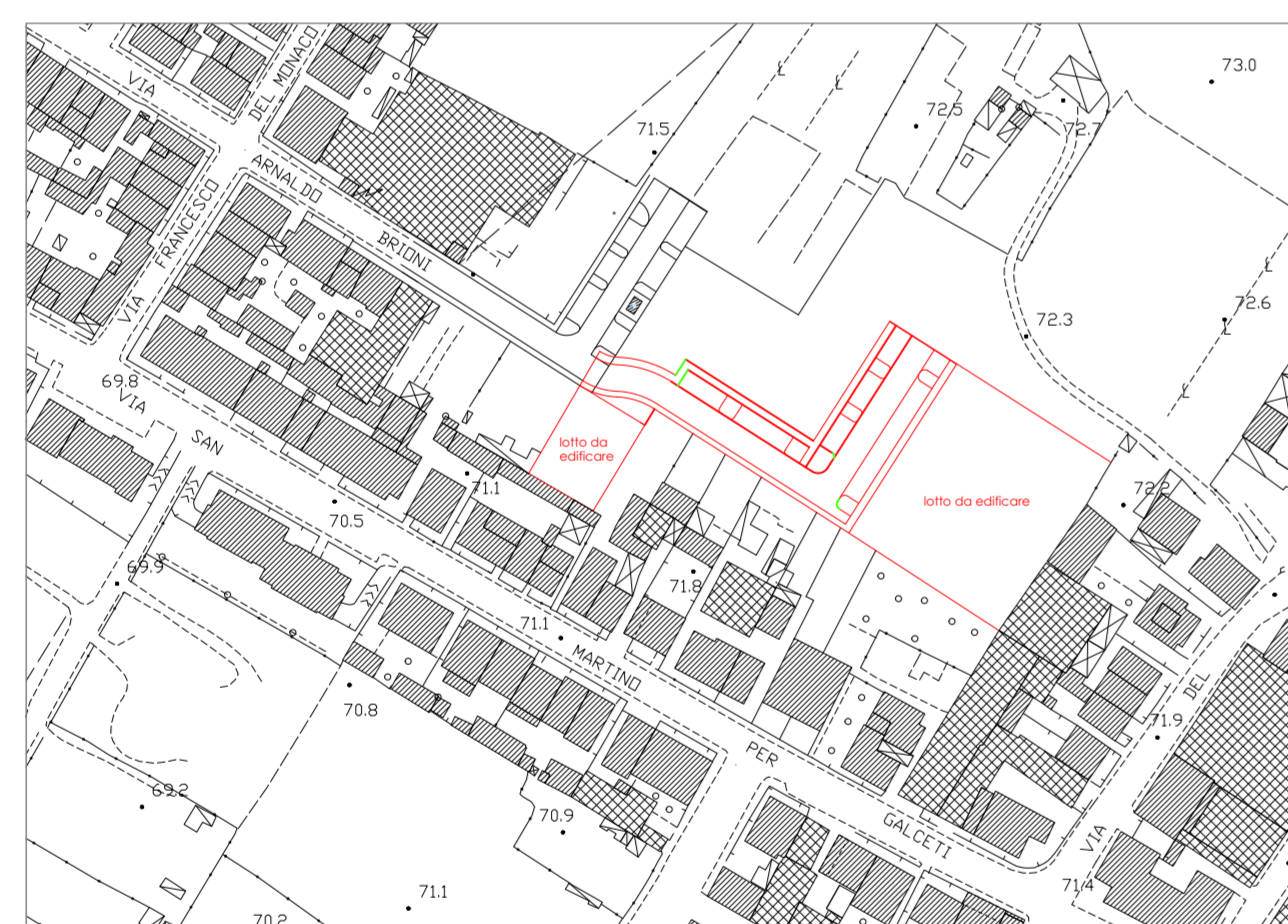
planimetria 1 : 2.000