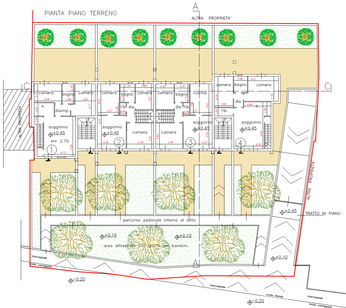
FIGURA 1 – DESCRIZIONE INTERVENTO – PIANTE PIANO TERRENO

A seguito della richiesta pervenuta dagli uffici regionali si provvede a sottolineare che l'intervento non prevedrà più la realizzazione di un parcheggio sul fronte stradale ma la realizzazione di un'area verde e pertanto viene meno la necessità di messa in sicurezza dell'area. Si allega di seguito la planimetria modificata, con anche l'indicazione della quota di +0.45 del piano di calpestio interna, e la sezione trasversale in corrispondenza della rampa di accesso agli interrati nella quale si vede il dosso di protezione. Si sottolinea che allo stato di progetto verranno previsti anche opportuni sistemi di pompaggio di emergenza in caso di allagamento.