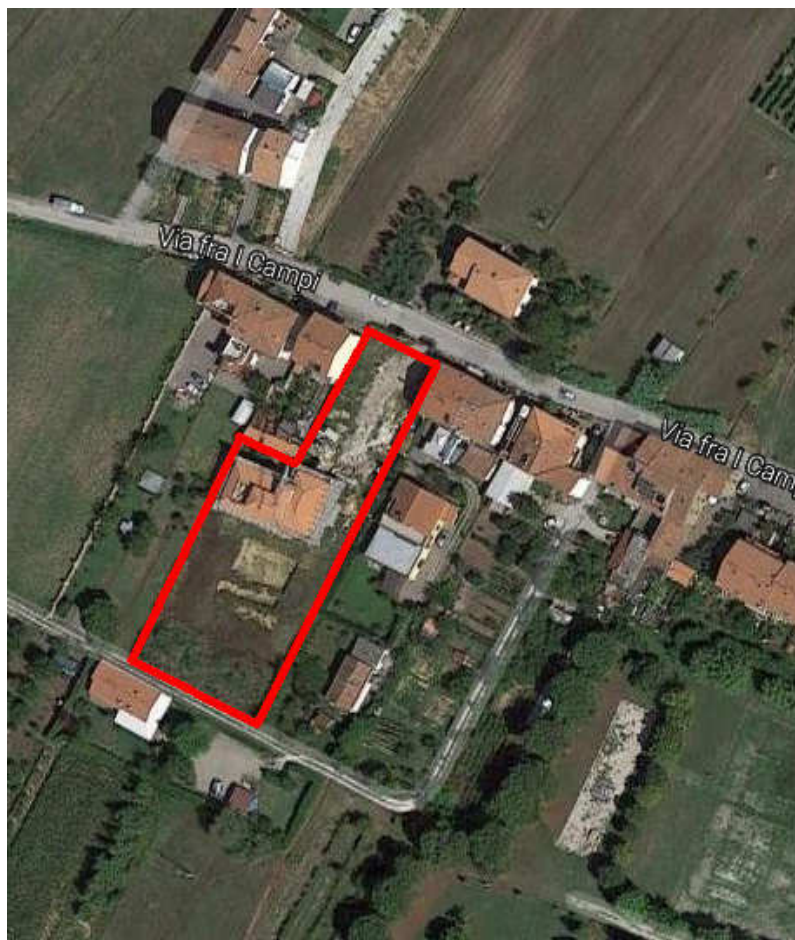
Google maps UMI 2 - Via Fra i Campi 31/H