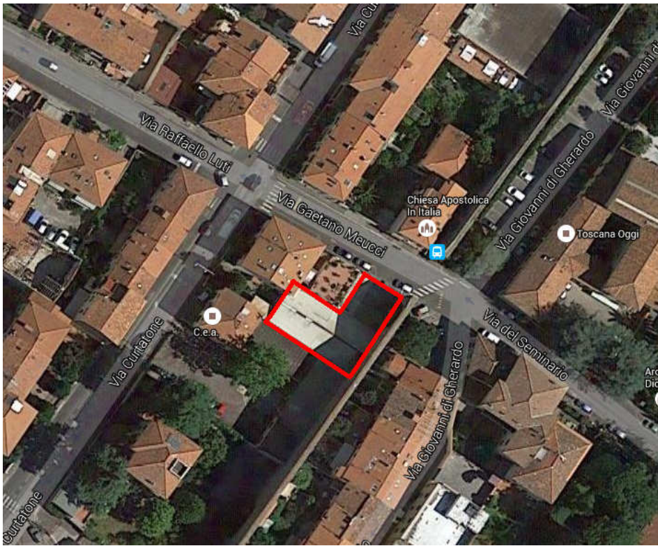
Google maps UMI 1 - Via Gaetano Meucci n. 6