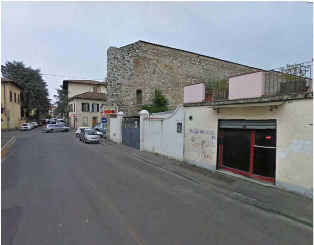
Foto 1B - Via Gaetano Meucci n.6