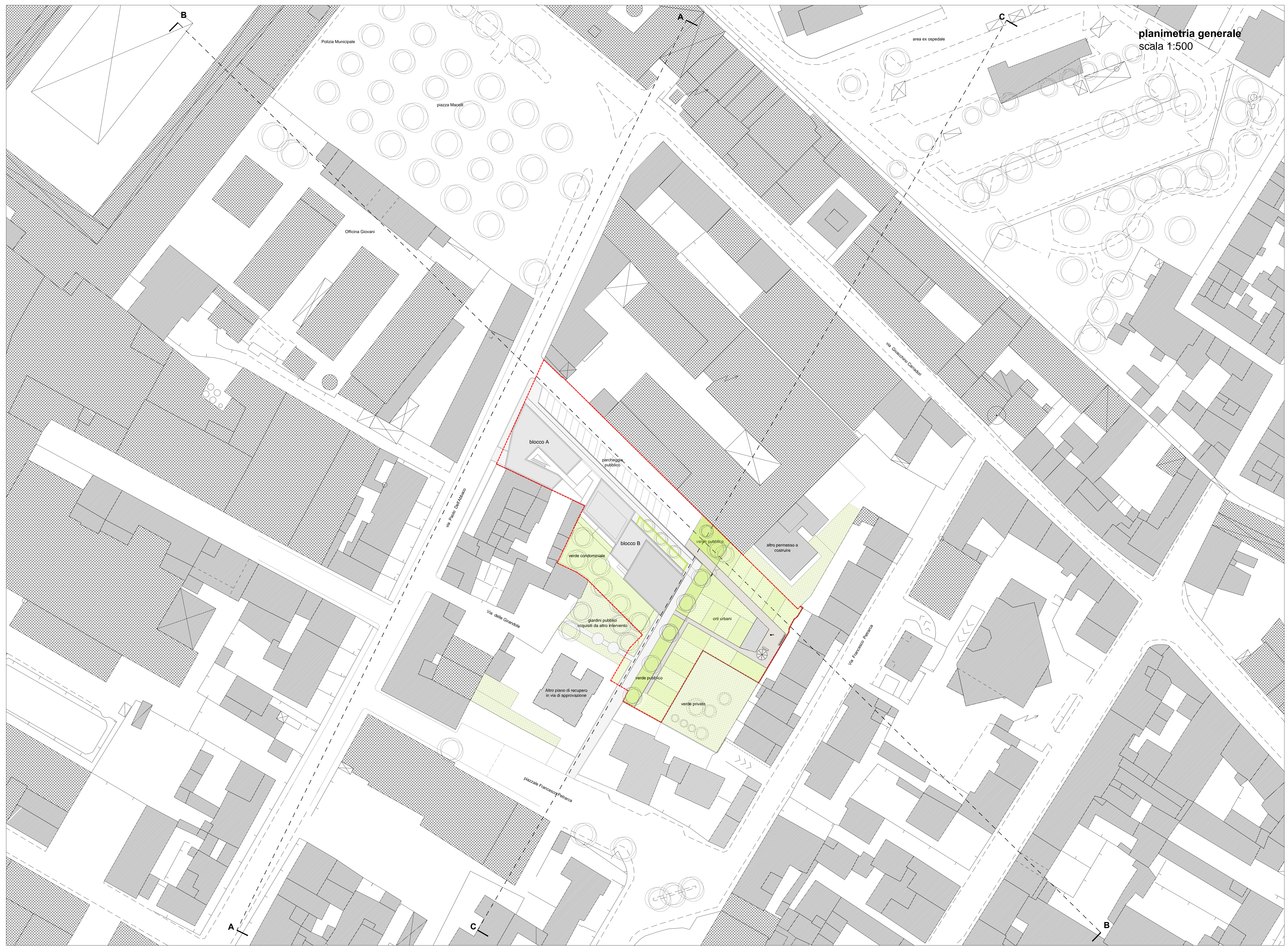
planimetria generale scala 1:500