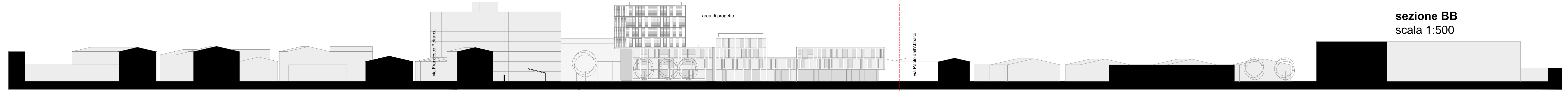
sezione BB scala 1:500