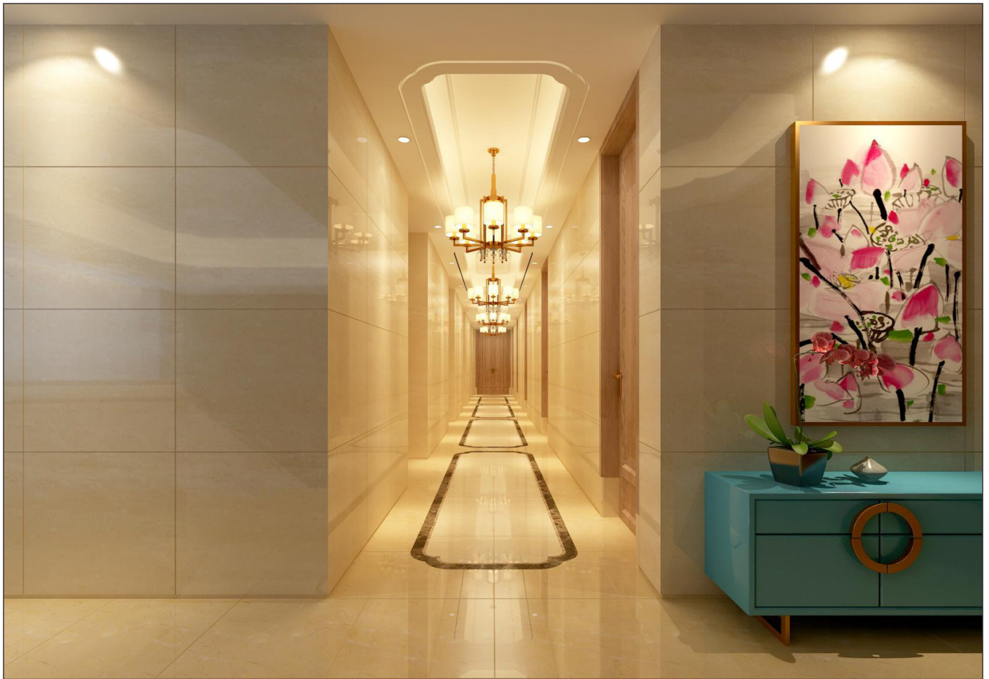
Vista corridoio piano terra