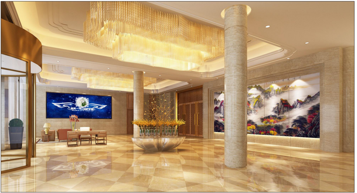
Vista ingresso piano terra