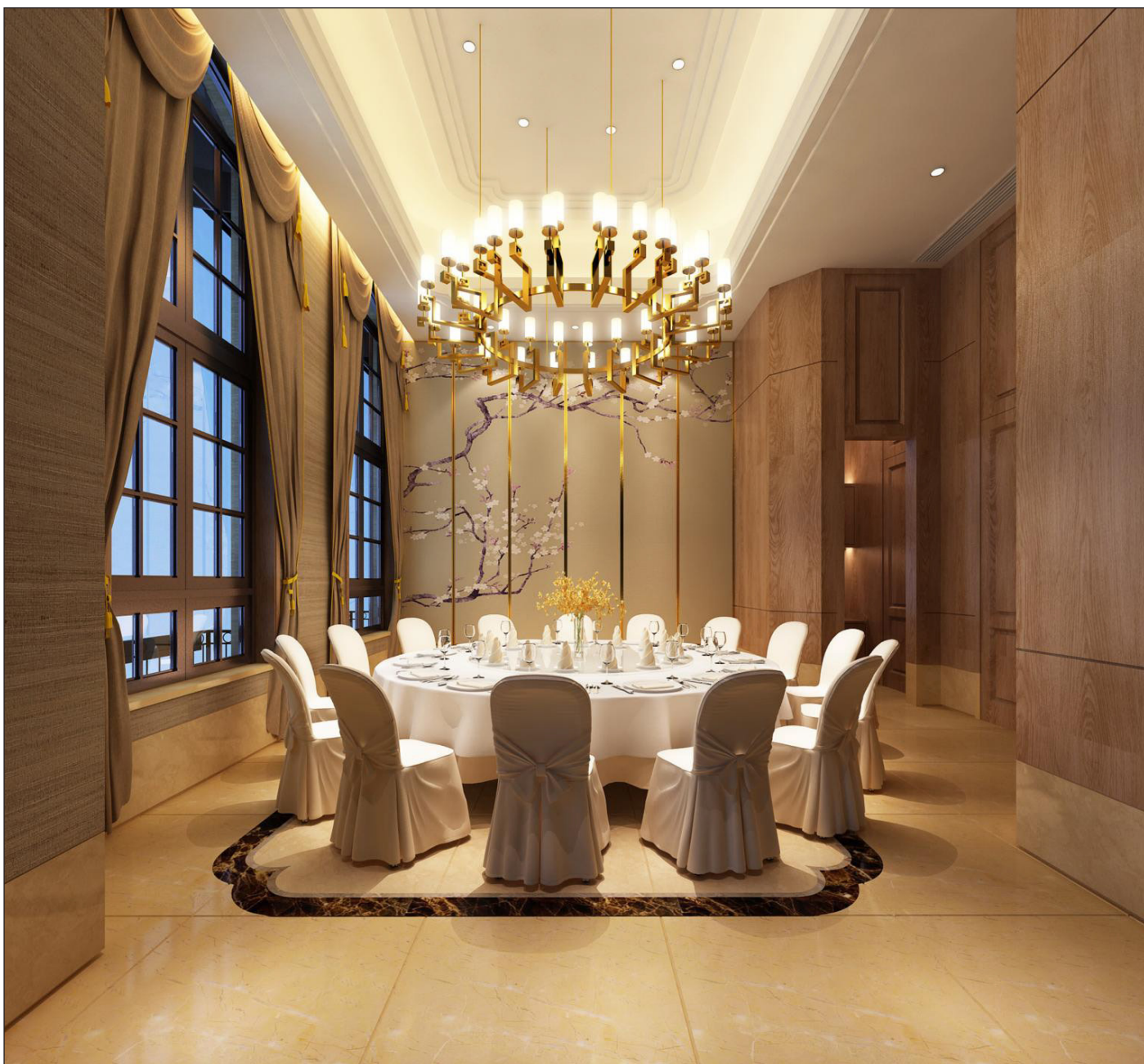
Vista saletta piano terra