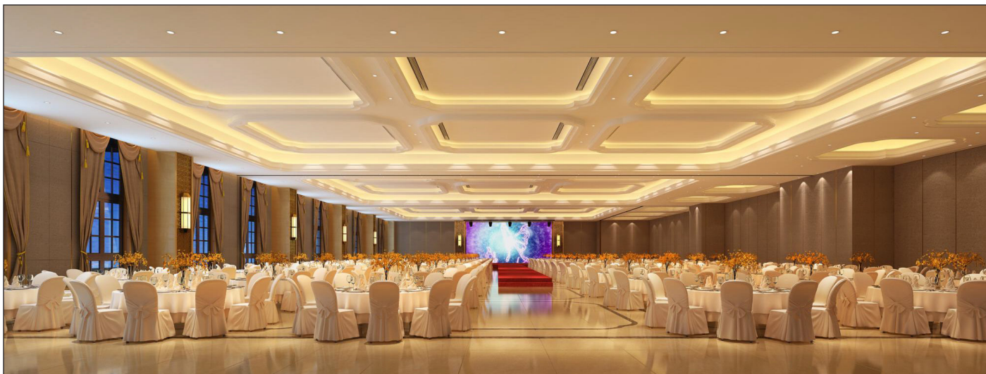
Vista sala piano terra