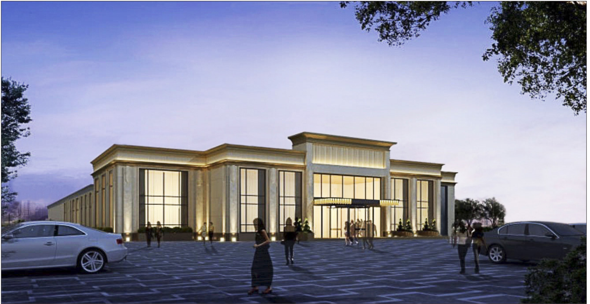
Vista esterna dal parcheggio