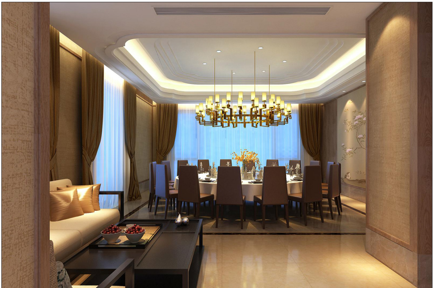
Vista saletta piano primo